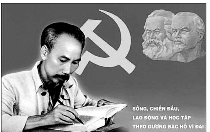
● У истоков партии вьетнамских коммунистов.

— Революция в России 1917 года открыла новую эру в истории человечества, эру национального и социального освобождения народов. Безусловно, она оказала влияние на процесс освобождения трудящихся и строительство нового общества в XX веке во Вьетнаме. Национальный лидер Хо Ши Мин писал о протекании трудов Маркса и Энгельса, изучения работ Ленина о Великой Октябрьской социалистической