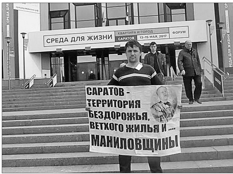
Пресс-служба Саратовского обкома КПРФ.