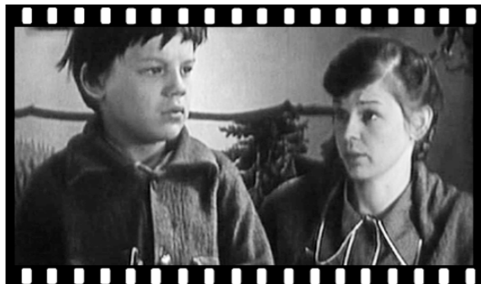
Кадр из фильма «Уроки французского».

Для детей надо делать фильмы, как для взрослых, только лучше. В Советском Союзе на кинематографе, адресованном подростку и взрослому поколению, не экономили. В стране существовала целая индустрия детского кино. Фильмы делали лучшие режиссеры нашей страны, в этих картинах с удовольствием снимались популярные актёры. Экранизировались известные сказки, создавались сценарии фантастических, приключенческих и т.д. Детское кино учило своих зрителей добру, взаимовыручке, уважению, формировало нравственные основы характера. Эти фильмы любили и взрослые, и дети. Их с удовольствием пересматривали по многу раз.