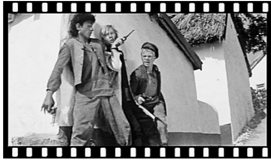
Кадр из фильма «Неуловимые мстители».

Сегодня, говорят, детское кино снимать невыгодно — не отобьётся в прокате. И потому современных российских детских фильмов выходит очень и очень мало. Но, к счастью, от прежних времён нам осталось огромное наследие. В Международный день защиты детей и в первые дни школьных каникул на канале «Красная Линия» смотрите фильмы о детях и для детей, вошедшие в золотой фонд советского кино.