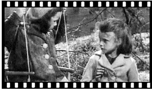
Кадр из фильма «Жила-была девочка».