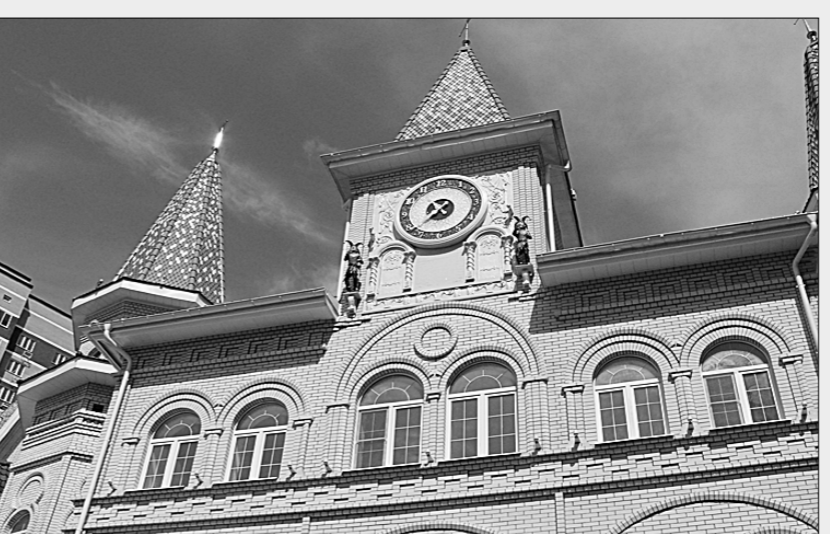
Интереснейший опыт Павла Николаевича Грудинина и возлаваемого им коллектива привлекает внимание многих. Недавно, как уже сообщалось, посетил уникальные новые здания школы и детского сада сюда приехал Г.А. Зюганов вместе с другими руководителями КПРФ. И, конечно, подобно всем гостям совхоза, они надобно забережались в сказочном детском чудо-городке, восхищаясь волшебными новинками, которые народное предприятие щедро дарит малышам.

закону, а в реальности — «по понятиям». Трудно бывает даже сделать что-либо в интересах общества.