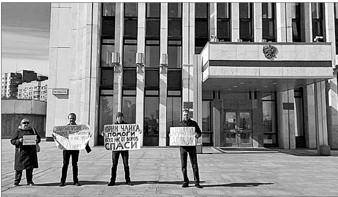
В Екатеринбург дольщики ЖК «Кольцовский дворик» вышли на пикет к зданию свердловского правительства. Они надеются, что в этот раз глава региона Евгений Куйвашев обратит на них внимание. Если нет, они готовы прийти сюда каждый день.