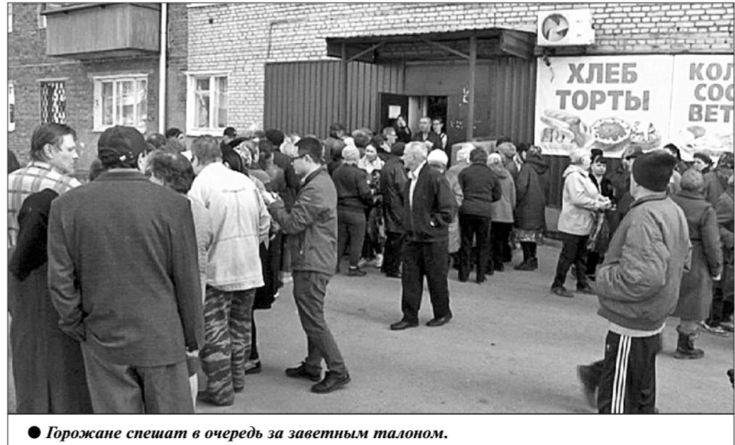
● Горжане спешат в очередь за заветным талоном.