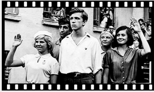
● Кадр из фильма «До свидания, мальчики».

Для защитников Брестской крепости война началась в 3.45 утра (4.45 по московскому времени). Отрезанные от остальной страны, в одиночестве, окружённые врагами, понимая, что наша армия отступает на восток, они отчаянно, насмерть бился с врагом. «Бессмертный гарнизон» — первый художественный фильм о защитниках крепости — вышел на экраны в 1956 году. К тому времени ещё не все имена бойцов, сражавшихся в Брестской крепости, были установлены, и герои киноленты выведены под вымышленными именами, однако детали их подвигот отражают реальные события.