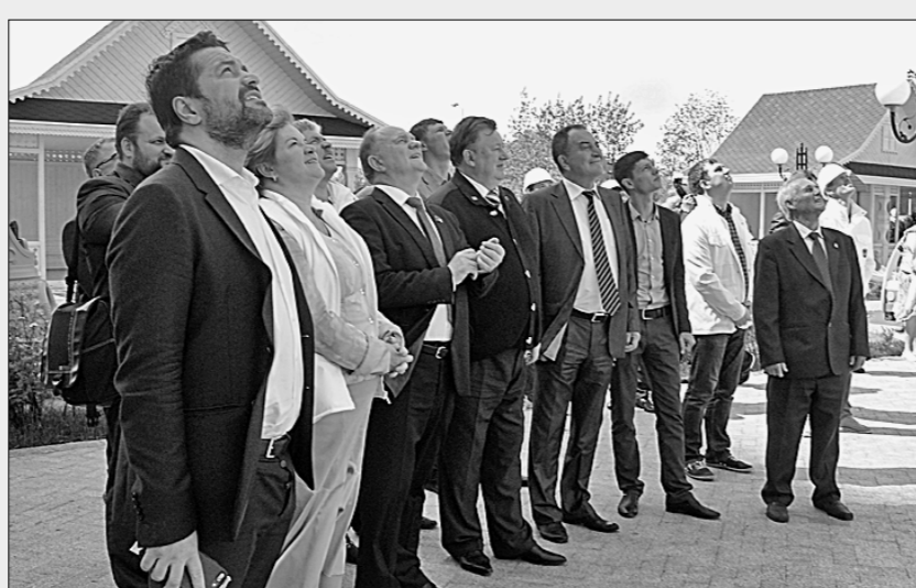
Интереснейший опыт Павла Николаевича Грудинина и возлаваемого им коллектива привлекает внимание многих. Недавно, как уже сообщалось, посетил уникальные новые здания школы и детского сада сюда приехал Г.А. Зюганов вместе с другими руководителями КПРФ. И, конечно, подобно всем гостям совхоза, они надобно забережались в сказочном детском чудо-городке, восхищаясь волшебными новинками, которые народное предприятие щедро дарит малышам.

— Не приемлют эти олигархи и правящая верхушка. — Понимаю. Сам про то говорю. Но пусть помнят 1917-й. Законы истории неотменимы и неотвратимы.