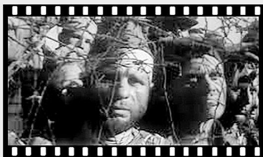
● Кадры из фильма «Бессмертный гарнизон».

Для защитников Брестской крепости война началась в 3.45 утра (4.45 по московскому времени). Отрезанные от остальной страны, в одиночестве, окружённые врагами, понимая, что наша армия отступает на восток, они отчаянно, насмерть бился с врагом. «Бессмертный гарнизон» — первый художественный фильм о защитниках крепости — вышел на экраны в 1956 году. К тому времени ещё не все имена бойцов, сражавшихся в Брестской крепости, были установлены, и герои киноленты выведены под вымышленными именами, однако детали их подвигот отражают реальные события.