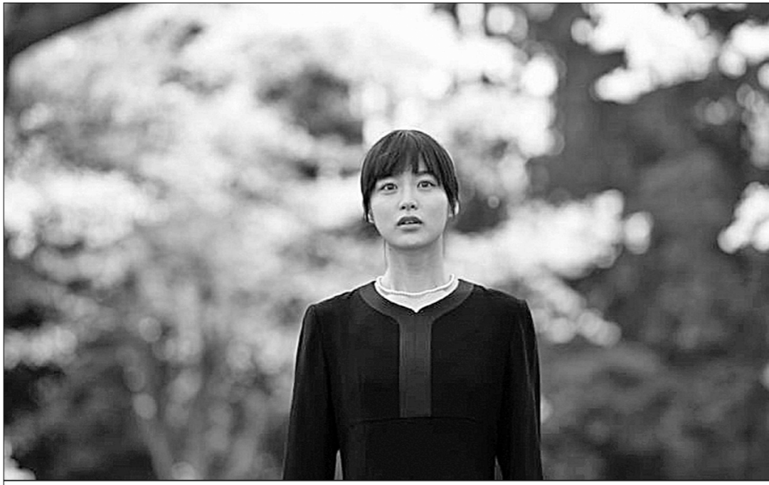
● «Апрельский сон».

Судя по фильмам, демонстрируемым в программе МКФ, режиссёры и в новом веке не спешат отойти от старого, доброго, в смысле надёжности и востребованности публикой, реалистического метода. Художники среднего и молодого поколения ищут свои сюжеты в окружающей действительности. Причём нередко они пользуются личным опытом и не скрывают этого. Для них важно донести до зрителя правду чувств, рождённых самой жизнью. И вот что существенно: представляя свои картины, почти все они выражают благодарность русской классической литературе и советскому киноискусству — очень часто они пробуждали и направляли творческие устремления будущих кинематографов, в какой бы культуре те ни воспитывались.