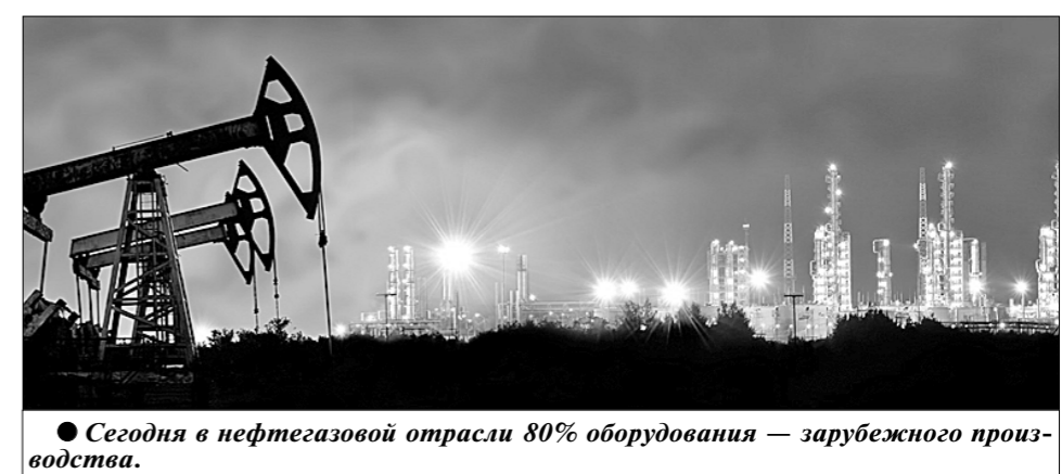
Сегодня в нефтегазовой отрасли 80% оборудования — зарубежного производства.

Вся надежда властей предрешённых в современной России до недавнего времени опиралась на наполнение бюджета за счёт выручки, получаемой от продажи за рубеж сырой нефти и газа. Отрасль считалась процветающей. РФ только по добыче «чёрного золота» и «голубого топлива» приближалась к показателям 1990 года. Именно в этой отрасли появились первые в России транснациональные компании. Здесь и наибольшее в стране число нуборшей, попадающих в списки журнала «Форбс», когда он считает долларовых миллиардеров. В общем, образцовая отрасль капиталистического труда. Но благостный мираж видится только при взгляде со стороны.