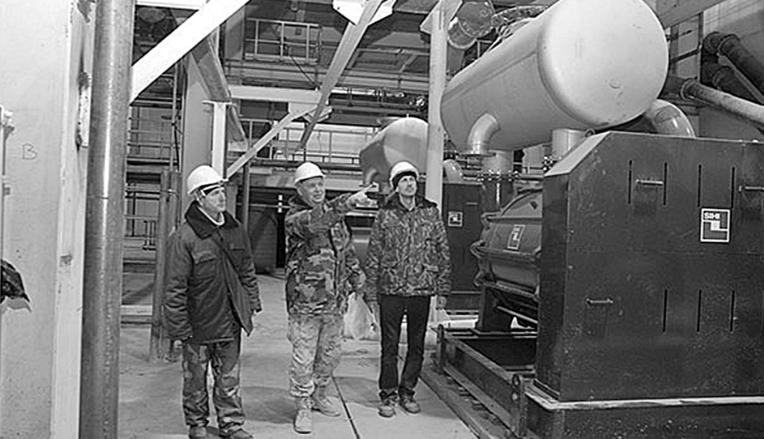
По страницам зарубежной печати

Сергей КОЖЕМЯКИН. (Соб. корр. «Правды»). г. Бишкек.