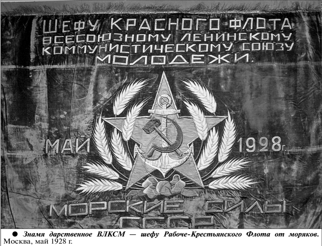
Знамя дарственное ВЛКСМ — шефу Рабоче-Крестьянского Флота от моряков. Москва, май 1928 г.

США развернули широкомасштабную морально-психологическую войну против нашего народа, искажая факты нашей истории, натравливая народы бывших республик СССР друг против друга. Флот и судоремонтную базу приходится восстанавливать заново, это стоит больших затрат и усилий, которые леги на плечи трудового народа. В годы Советской власти наш флот превосходил морские силы США и стран НАТО, сегодня по многим параметрам российский флот уступает американскому и несравнимо отстает от стран НАТО по численности кораблей.