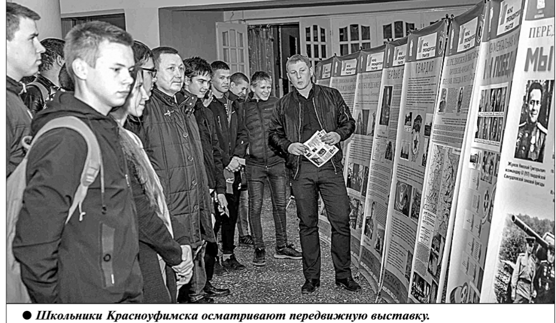
Школьники Красноуфимска осматривают передвижную выставку.

Вопросом, когда люди рассказывают друг другу, как они запыляются, как боится вольте детей в детский сад, выходя на улицу и т.д. Отсутствие какой-либо информации, понимания происходящего и уверенности в действиях властей, направленных на исправление ситуации, только увеличивает страх.