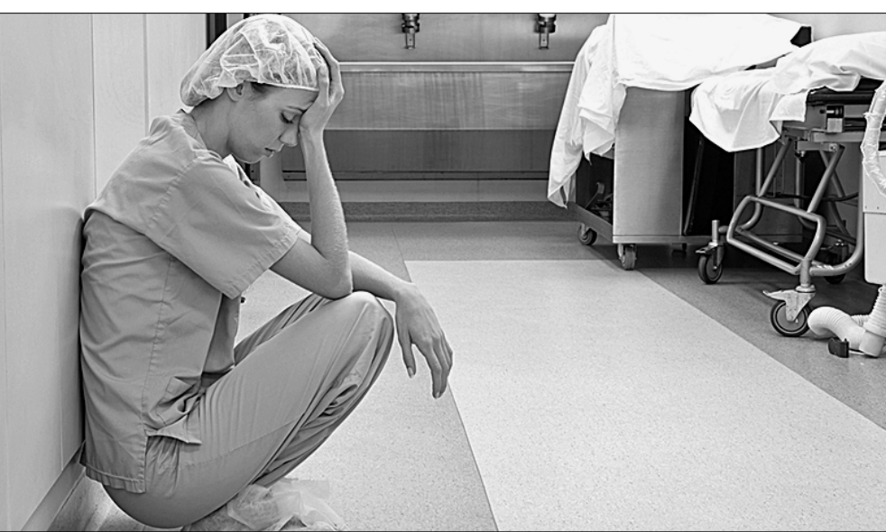
В случае ЧП делается самое простое: увольняют, а то и сажают врача...

Готовы ли мы платить своими жизнями за безумную политику властей?