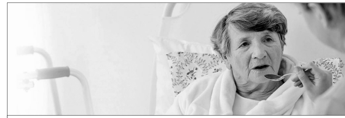
● Более 3 млн человек в России нуждаются в регулярной медико-социальной помощи.

Государство сегодня и к здоровым, работающим людям относится как к расходному материалу, что уж говорить о неизлечимо больных и инвалидах. Милосердие нынче явно не в моде. Но даже если посмотреть с чисто прагматической точки зрения: при таком равнодушном отношении к семьям с больными людьми миллионы активных работников на многие годы выпадают из экономики, чаще всего без возможности потом вернуться в строй. По данным опроса, проведённого в рамках исследования «Российский рынок