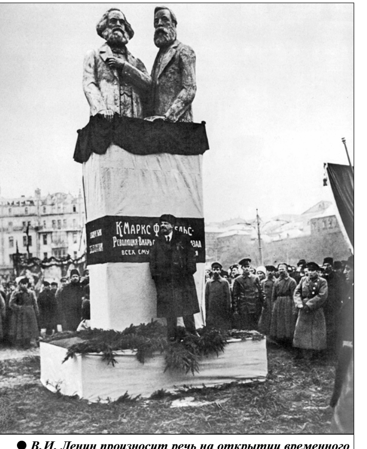
В.И. Ленин произносит речь на открытии временного памятника К. Марксу и Ф. Энгельсу. 7 ноября 1918 г.

В.К. Что ж, надеюсь, читатели это учтут. Спасибо. До новых встреч на страницах «Правды»!