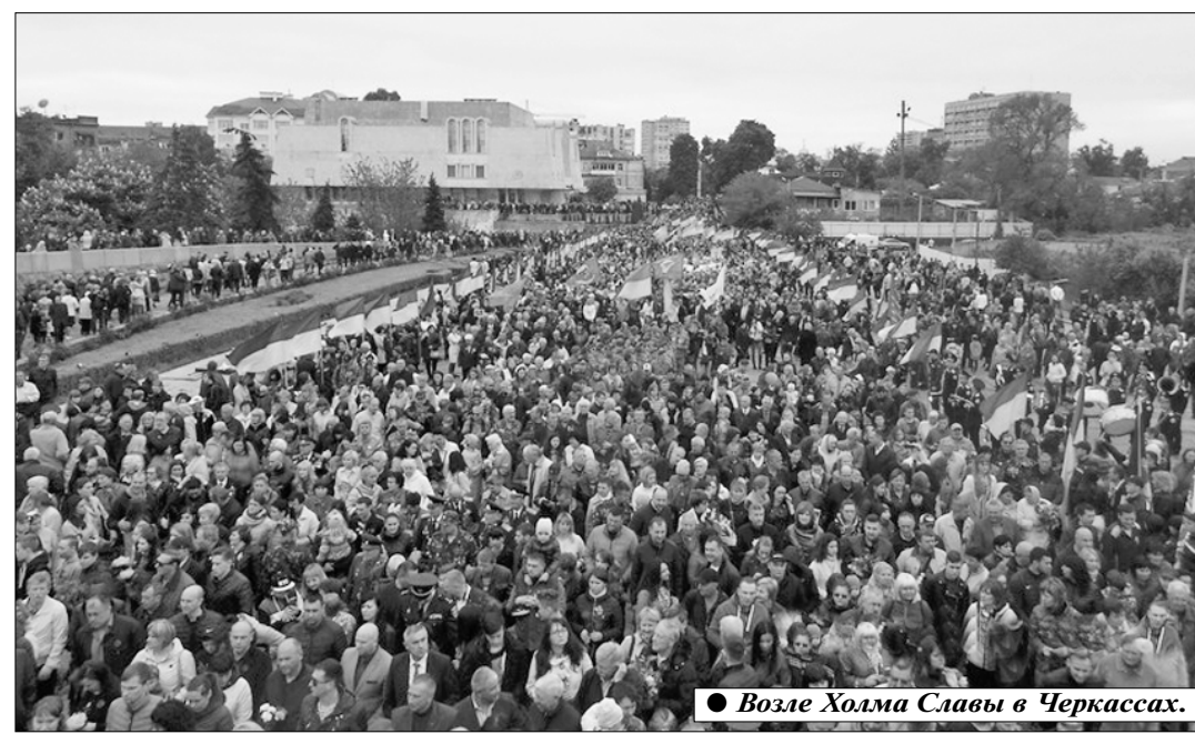
● Возле Холма Славы в Черкассах.

Такие же мероприятия прошли и в соседних Винницкой и Черниговской, в Полтавской и