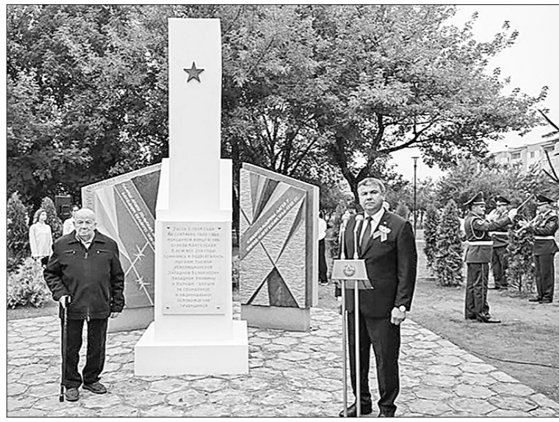
Ярко, дружно, масштабно отметили в Белоруссии новый государственный праздник — День народного единства, приуроченный к годовщине освобождения Красной Армии, в результате которой часть республики воссоединилась с БССР.