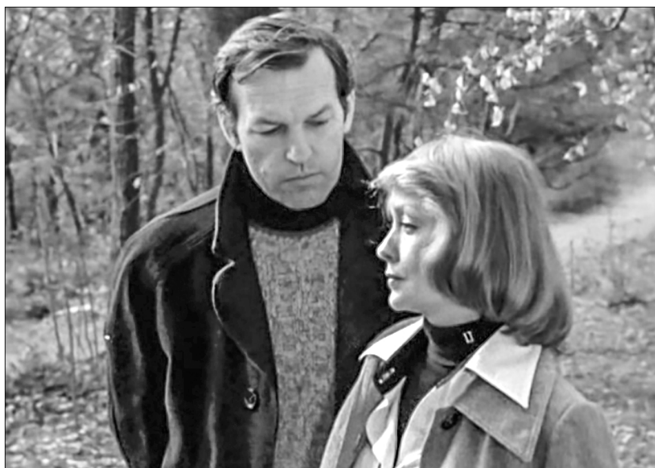
«Из жизни отдыхающих».