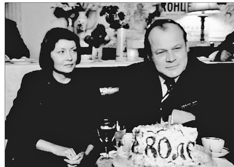
«И жизнь, и слёзы, и любовь».