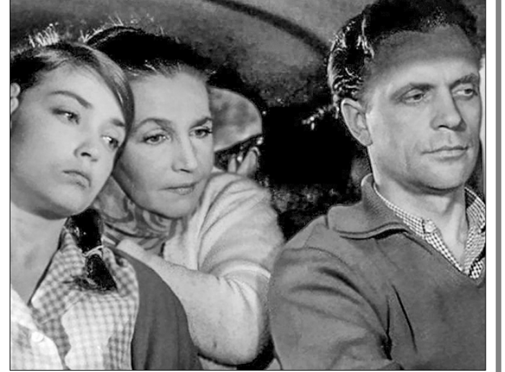
«Люди и звери».