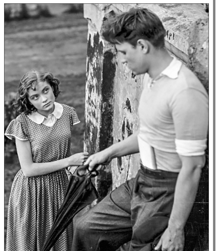
«Дом, в котором я живу».