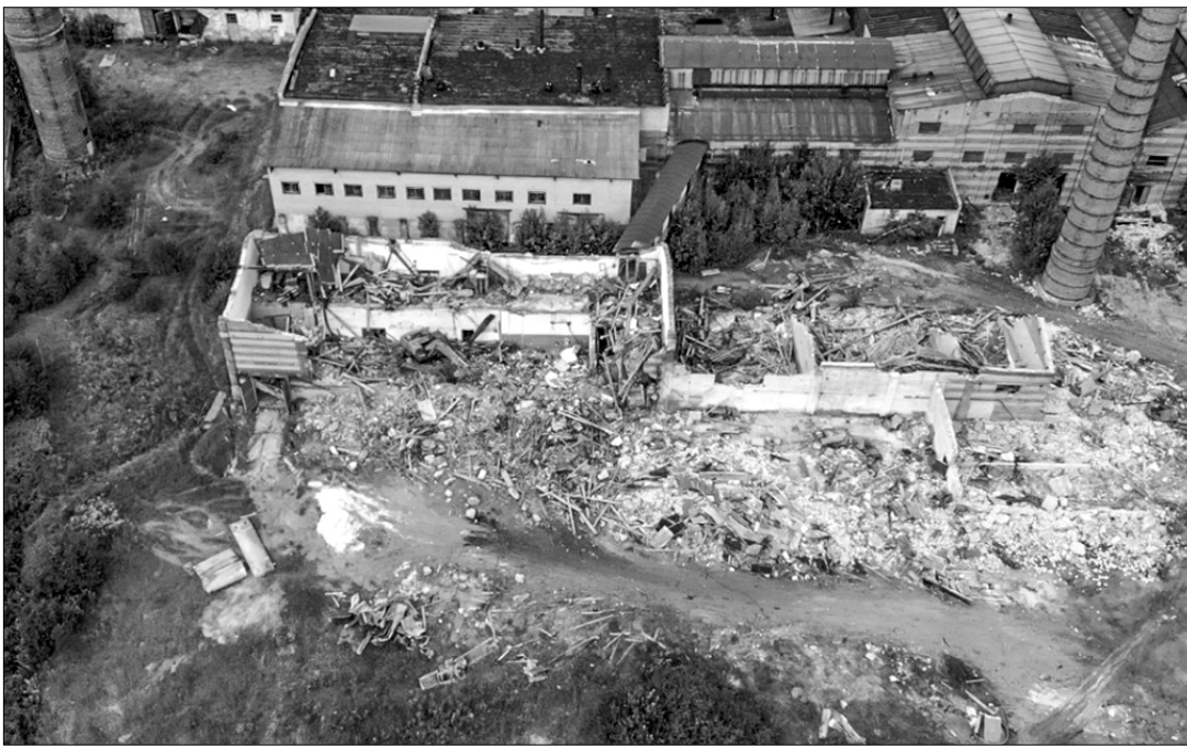
Бывшие заводы — стекольный...