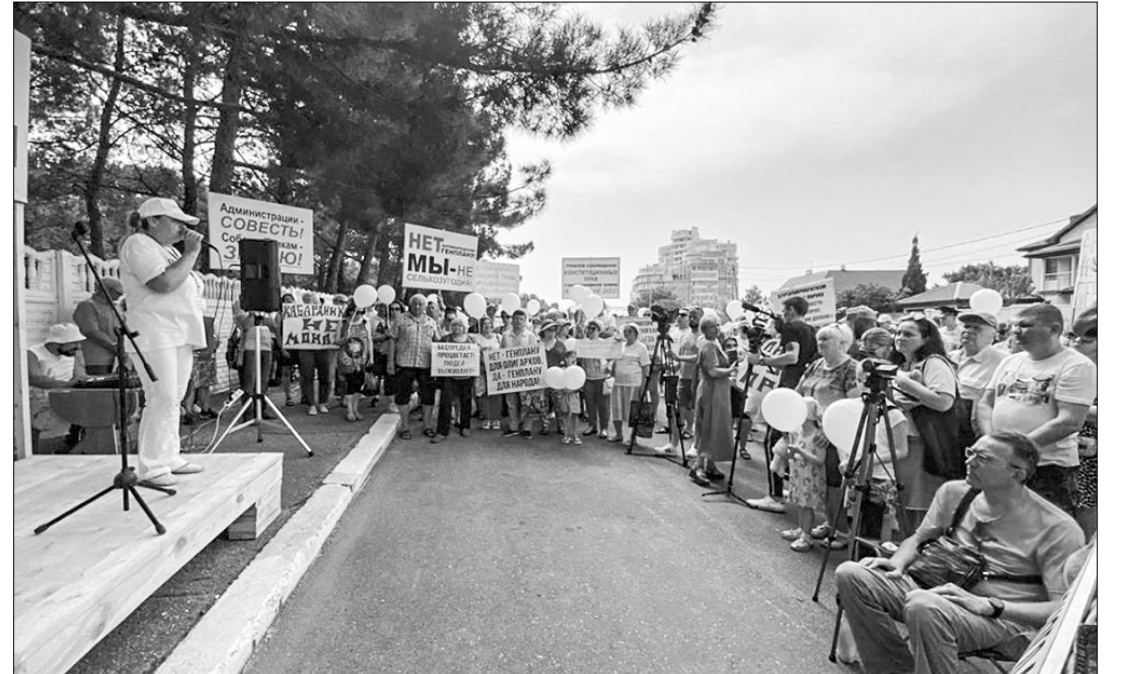
5 июня в Геленджике прошёл протестный митинг против безжалостной «перекройки» города, обсуждалась на нём и другая проблема. В митинге приняли участие около 300 жителей — люди протестовали целыми семьями, вместе с детьми.

строенной, но отправленной властями под снос, а также противники вырубки реликтовых лесов курорта под виноградники и многие другие горожане.