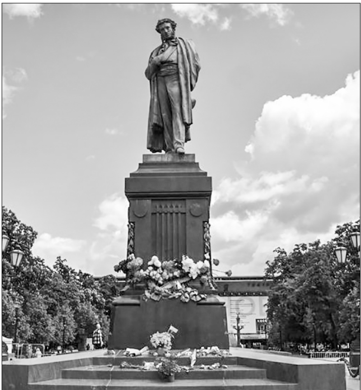
Шестого июня, в День русского языка и в день рождения А.С. Пушкина, в Москве состоялось памятное мероприятие с торжественным возложением цветов к монументу великого поэта. В акции, помимо руководства КПРФ и Московского городского комитета партии, приняли участие Ленинский комсомол, «Всероссийский женский союз — «Надежда России», «Левый фронт» и другие левые общественные организации и движения.