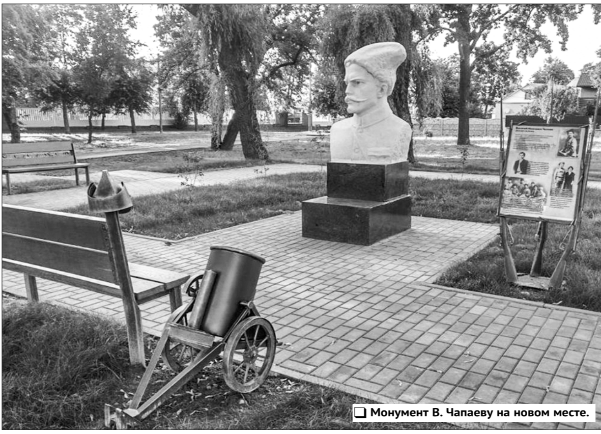
Монумент В. Чапаеву на новом месте.

Споры вокруг монумента красному командиру начались задол-