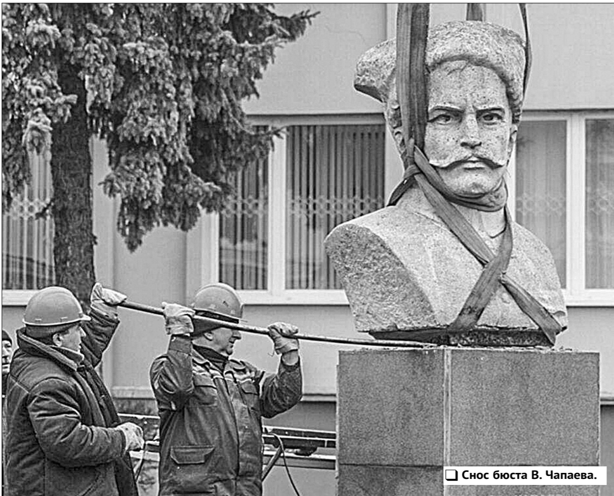
Снос бюста В. Чапаева.

то до его демонтажа. Формальным поводом для этого послужил акт вандализма, совершенный радикальными активистами «Молодого фронта». Осенью 2010 года свора неонацистов отбила у бюста табличку с именем героя, приколотив на её место новую, с именем генерала Белой армии, армии БНР и Войска Польского С. Булак-Балаховича.