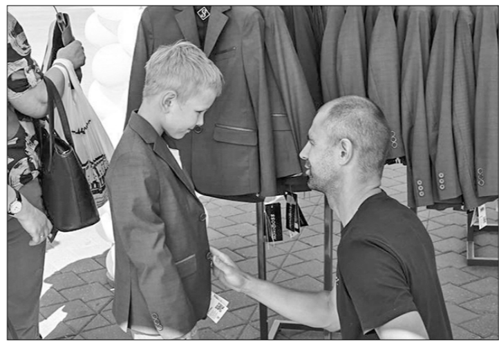
Возле Дворца спорта в столице Белоруссии — городе Минске работает школьный базар выходного дня, сообщает БЕЛТА. Здесь представлен широкий ассортимент продукции к новому учебному году: школьная форма, обувь, письменные принадлежности и многое другое. Родители приходят сюда с детьми, которые активно участвуют в выборе товара. Особенно большой интерес проявляют к предлагаемой продукции будущие первоклашки.