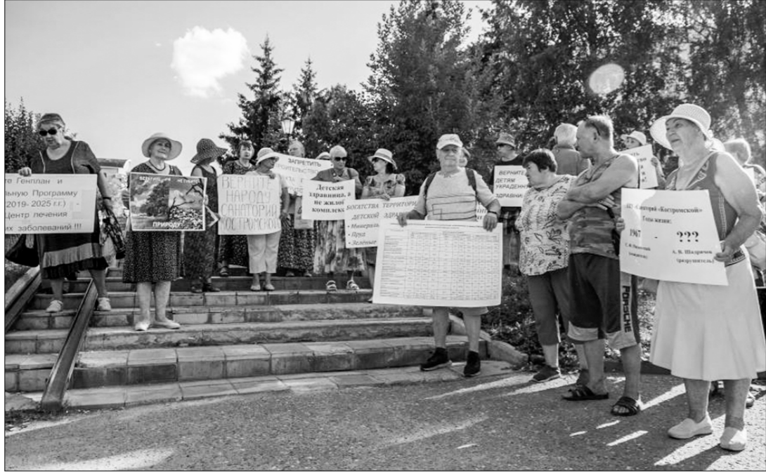
Коммунисты и активисты движения «Левый фронт» приняли участие в организованном в Костроме экологическим движением «Во имя жизни» массовом пикете против уничтожения детского санатория.

Протестовавшие требовали от властей сохранить здравницу и не допустить застройки её территории коммерческим жильём. По словам общественников, земли санатория «Костромской» руководство Федерации профсоюзов продало строительной компании КФК. А что на них планируют строить? Похоже, элитное жильё!