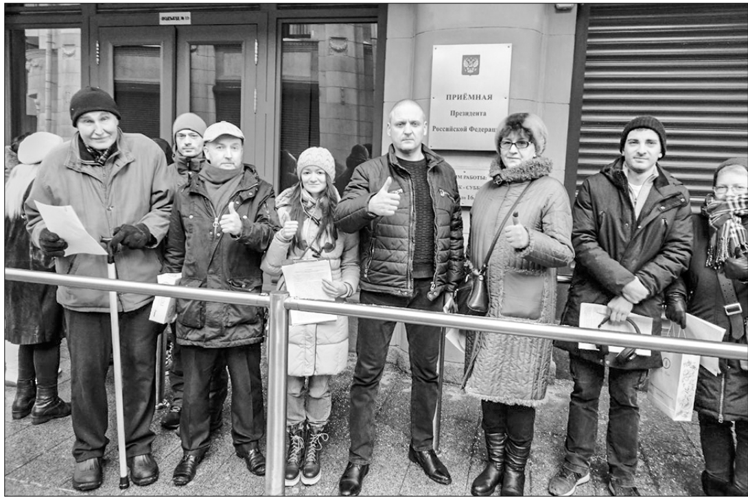
В субботу, 2 декабря, в Москве, возле здания приёмной администрации президента РФ, собралась более трёхсот человек, чтобы передать властям требования в защиту московских природных территорий (Битцевский лес, Лосиный остров, Алёшинский лес, поймы реки Язсы, парк «Косинский», Белорусский сквер, Троицкий лес, парк «Ангарские пруды», Крылатское и другие).

Среди собравшихся — районные экологические активисты, представители «Левого фронта», КПРФ, Моссовета и других организаций, выстроившиеся вдоль здания в длинную очередь. Подать обращения заняло несколько часов. Основные требования москвичей — запрет на изъятие земель природных территорий для последующего строитель-