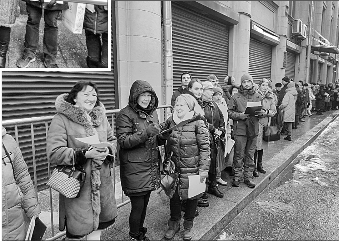
Пресс-служба «Левого фронта».

острых проблем развития столицы и обеспечения конституционного права граждан на благоприятную окружающую среду, — отмечено в обращении москвичей к главе государства. — Сегодня масштабное, в том числе коммерческое, строительство высотных жилых домов и автомагистралей, сопровождаемое изъятием значительных площадей ООПТ, других природных и озеленённых территорий, крайне негативно сказывается на состоянии окружающей среды столицы».