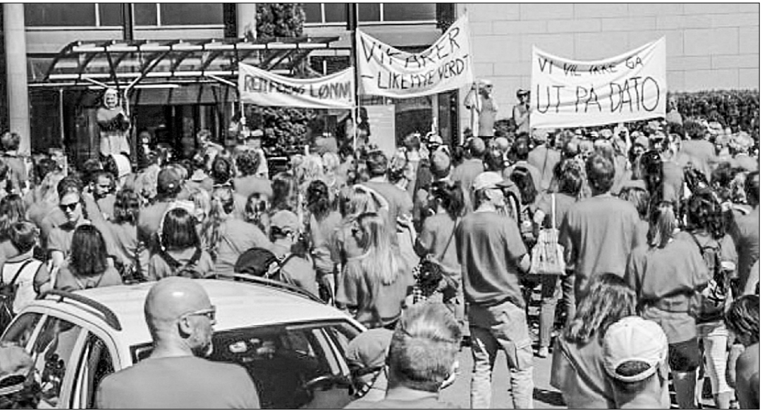
Забастовщики в Осло. Фото из Яндекс.ру

Николай ПЕТРОВСКИЙ. □ Забастовщики в Осло. Фото из Яндекс.ру