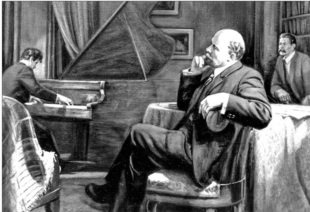
«В.И. Ленин слушает «Аппассионату» Бетховена». Г. Светлицкий, 1938—1948.

Ленин воскликнул: «Это замечательно, это чудесно, это хорошо!.. Хорошо, что наши бойцы хотят учиться, и как раз искусство в помещениях, где хранились ценные картины и фрески». Ленин ответил: «Все памятники должны оставаться на месте. Пусть будущее поколение видит и помнит историю нашего народа».