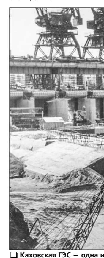
Каховская ГЭС — одна из великих строен коммунизма. 18.05.1955 — 06.06.2023.

кратились, когда «Поэме о море» была присуждена Ленинская премия.