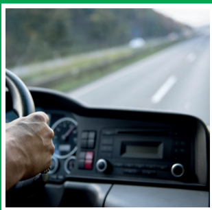
Возможна вахта и проживание