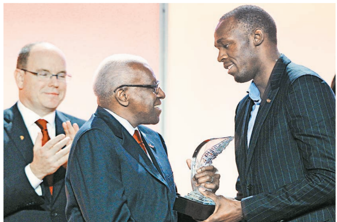
Четырехкратный обладатель приза лучшему легкоатлету года Усейн Болт в августе 2013-го собирается в Москву.

Расписание шведского этапа Кубка мира выглядит не совсем обычно: он продлится целую неделю. Сегодня и завтра стартуют нет, в среду и четверг — индивидуальные гонки, в субботу — спринт и в воскресенье — гонки преследования.