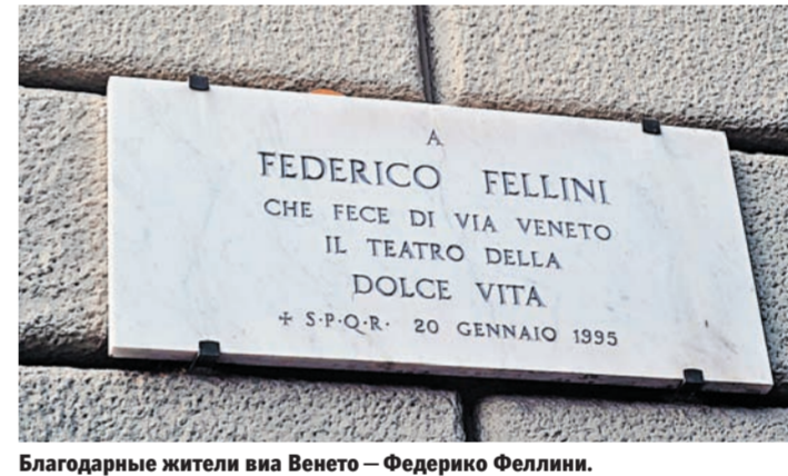
Благодарные жители виа Венето — Федерико Феллини.