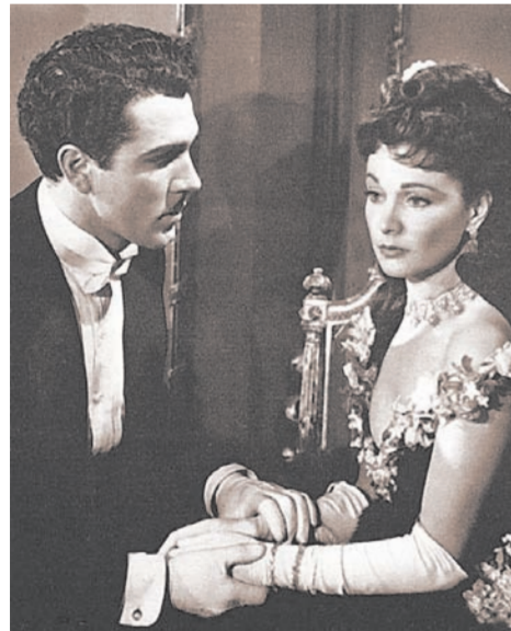
Роль Анны Карениной играли на экране Вивьен Ли (1948), Софи Марсо (1997), Татьяна Самойлова (1967).