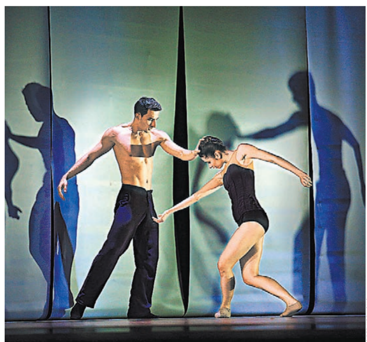
Персонажи балета «Бессонница» — на грани яви и сна.