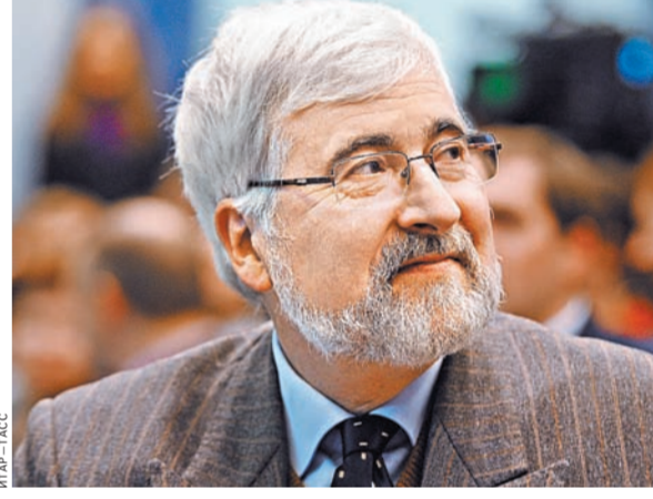
Жан де Глиннасти уверен, что Париж не станет повторять ошибок Вашингтона касательно «списка Магнитского».

Французские власти не собираются по примеру США принимать так называемый «список Магнитского». Об этом в интервью российским СМИ заявил французский посол в РФ Жан де Глиннасти. Марина Алешкина