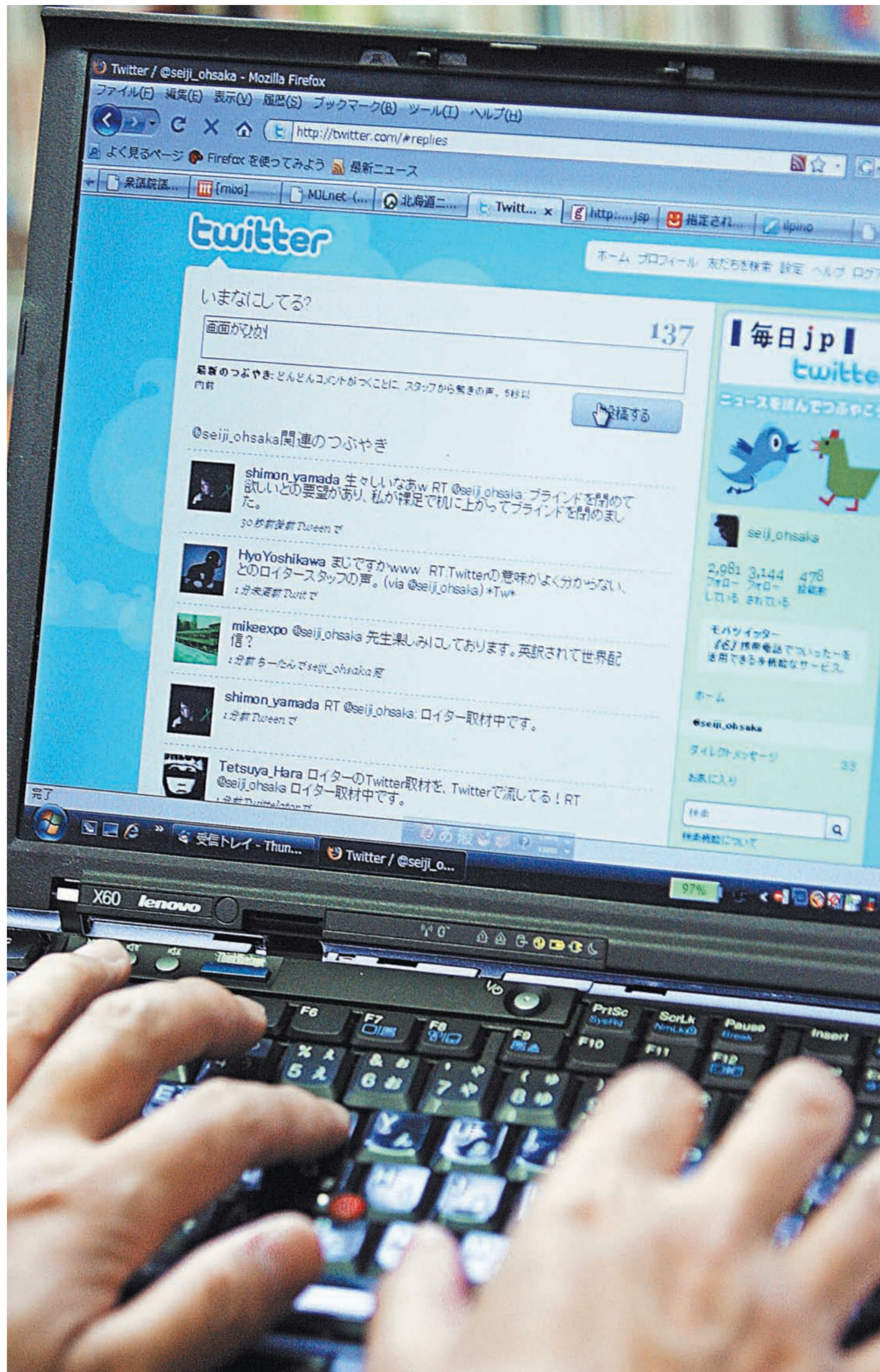
Социальные сети говорят на всех языках мира.

Сегодня в Италии в отдельных сферах, к примеру в борьбе с мафией, государство уже никак не обходится без помощи соцсетей. В стране прочно укрепился новый феномен под названием «Фейсбос». Для итальянских мафиози Интернет стал удобным и быстрым способом коммуникации, с помощью которого они посылают угрозы своим конкурентам, выходят на связь с подельниками, скрывающимися от правосудия, и совершают нелегальные сделки. Соответственно, правоохранительным органам не остается ничего другого, как ночи напролет проводить в «Фейсбук» и «Твиттере» в надежде перехватить очередного мафиозного деятеля. Итальянские чиновники любого ранга, обитающие в социальных сетях в рабочих целях, волны размещают там любые данные, которые, как им кажется, необходимы для обнародования.