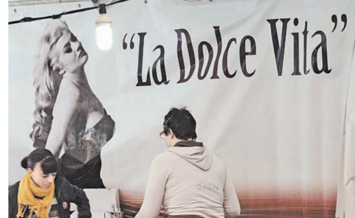
«Сладкая жизнь» стала брендом виа Венето.