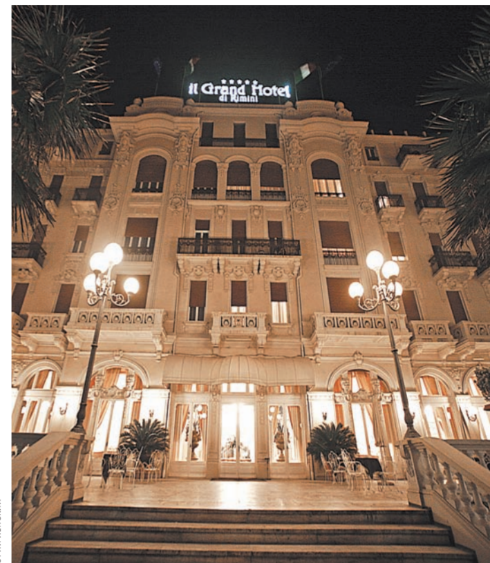
Феллини подарил этому отелю вечную жизнь.

Я отправился оттуда на тихую улочку виа Маргутта в центре Рима поклониться гению, который жил в этом доме, который своим прикосновением подарил вечную жизнь и «Гранд-отелю» в Римини, и «Ексельсиору» в Риме, и виа Венето в таком же вечном городе.