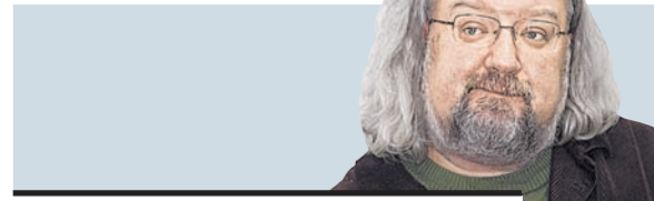
Андрей Максимов писатель, член Академии российского телевидения