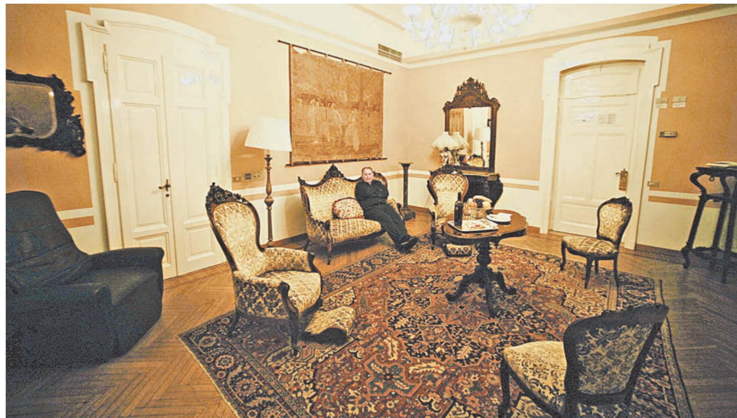
Я выпил бокал вина, присел в уголок дивана и стал ждать...