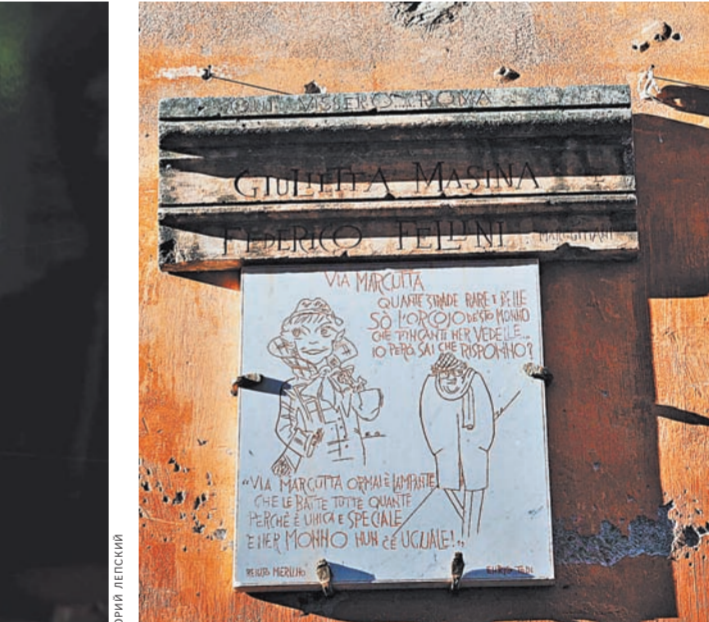
На виа Маргутта, у дома, где он жил.