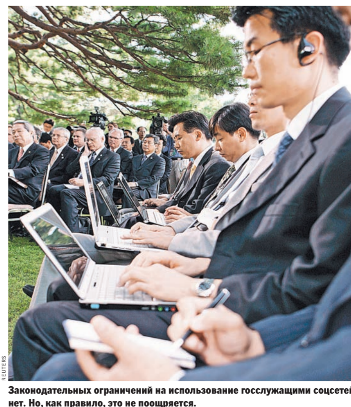
Законодательных ограничений на использование госслужащими соцсетей нет. Но, как правило, это не поощряется.

федеральных чиновников сейчас работают в США