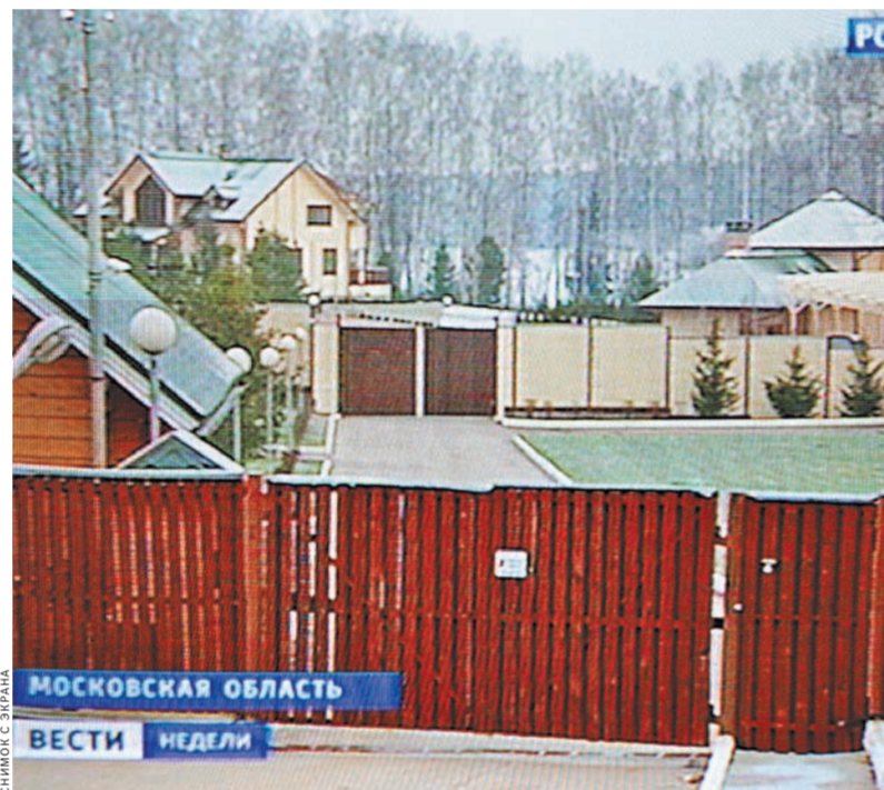
Следователи провели обыски в элитном поселке, где жили высокопоставленные чиновники Минобороны и в том числе бывший министр Анатолий Сердюков.