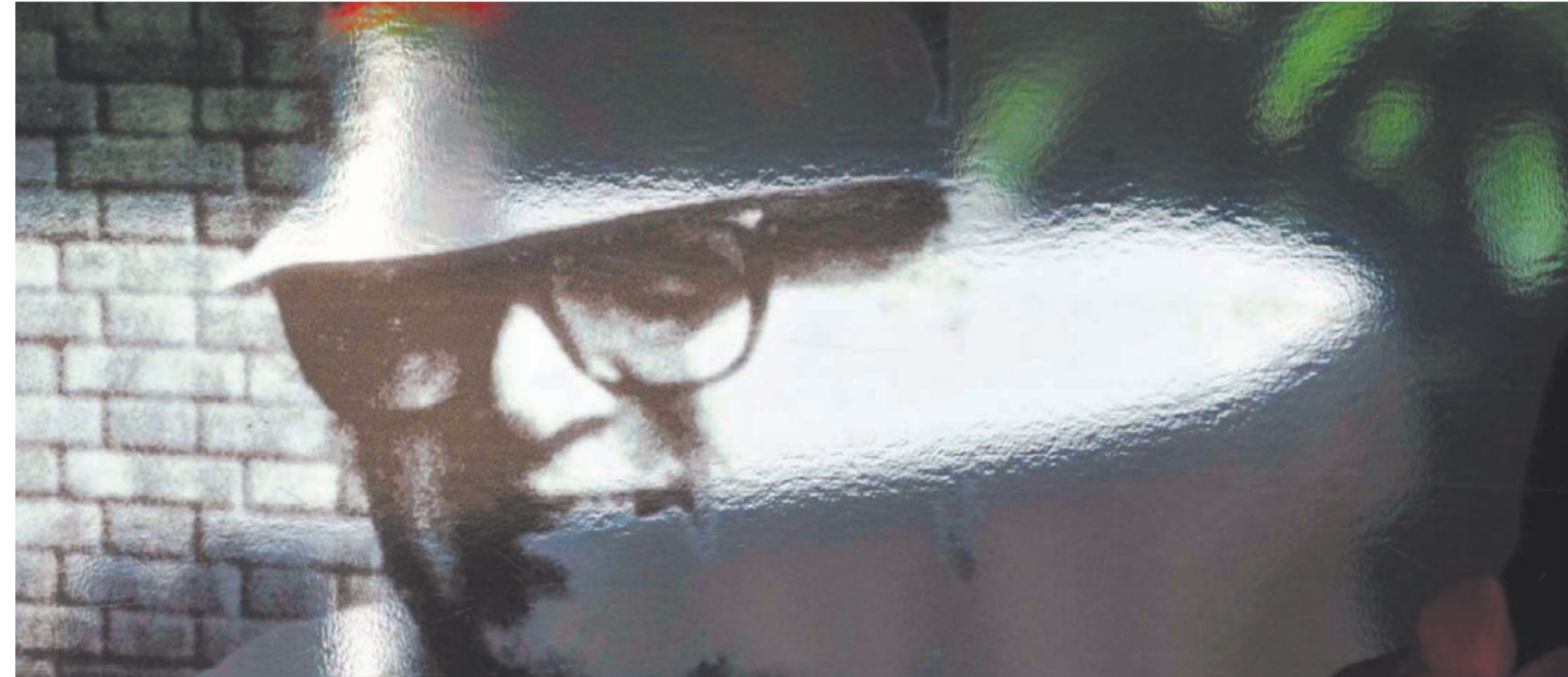
Кажется, он и сейчас здесь, на улицах вечного города.