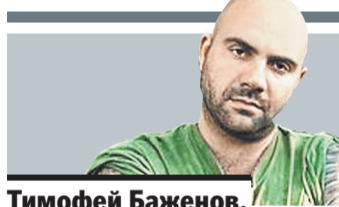
Тимофей Баженов, телеведущий

В МОЕЙ жизни было несколько случаев, когда виновники ДТП, в которых я участвовал, скрывались с места преступления. Действительно, их объявляли в розыск, но в основном и, к большому сожалению, не находили. Однако при условиях составления протокола я мог воспользоваться услугами страховой компании, в которой предварительно страховался. Я считаю: если протоколы будут составляться только после нахождения виновника аварии в ситуации, как пишет