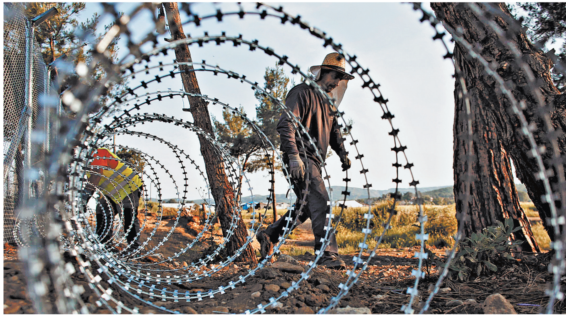
Жители, по меньшей мере, десяти стран Евросоюза, включая Германию, разочаровались в политике «открытых дверей» в отношении беженцев — об этом свидетельствуют данные опроса.

Екатерина Забродина, Анна Роза, Максим Макарычев