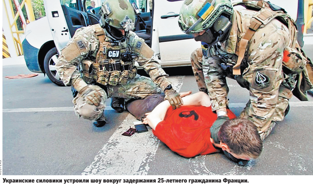
Украинские силовики устроили шоу вокруг задержания 25-летнего гражданина Франции.

Можно объяснить и то, почему Грицаку понадобилось выставлять напоказ всему миру изнанку «революции достоинства». Дело в том, что на Западе, в отличие от Украины, не прошел незамеченным 13-й доклад Управления верховного комиссара ООН по правам человека, в котором говорилось о пытках и иных преступлениях, совершаемых киевским режимом. Попытка Киева опровергнуть обвинения, в частности — о наличии тайных тюрем и пыточных камер, окончилась конфузом. Генпрокурор Юрий Луценко вместе с Грицаком устроили экскурсию в один из следственных изоляторов СБУ, дабы показать открытость и отсутствие пыток в нем. Но тут же выяснилось, что это место заключения де-юре закрыто еще в 2003 году и с точки зрения международного права является именно «тайной тюрьмой».