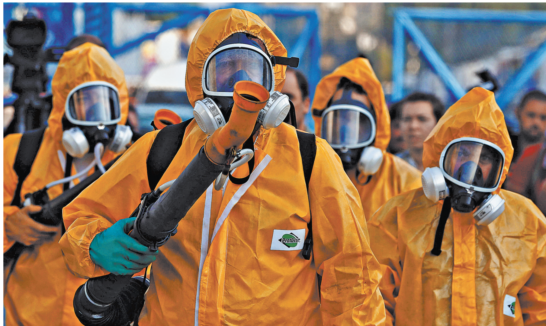
Вот такие костюмы авиапассажирам не понадобятся. Аэрополь от комаров безопасна для людей.