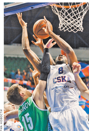
В финале УНИКС не раз демонстрировал характер, но для победы над ЦСКА этого оказалось недостаточно.