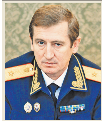
Анатолій Багмет, генерал-майор юстиції, кандидат юридических наук. Окончив Свердловський юридический інститут. Начав працювати помічником прокурора в Національній прокуратурі України в Чельабінську, де пройшов всі прокурорські ступені. Керував слідчим управлінням СК при прокуратурі Москви. В 2011 році указом президента призначений директором Інститута підвищення кваліфікації СКР. Автор і співавтор 50 наукових творів і публікацій.