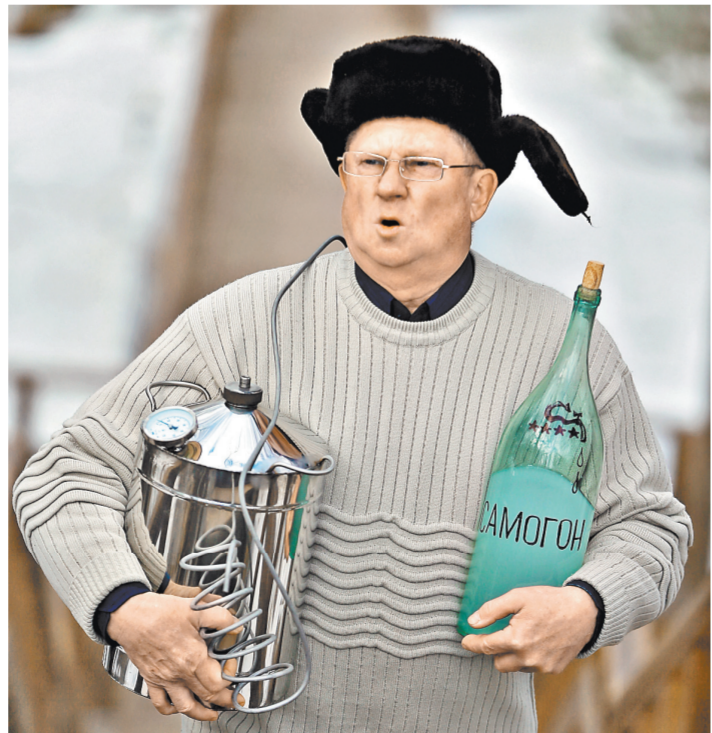
Индивидуальным предпринимателям будет легче выйти на рынок со своей винодельческой продукцией. Но ею должно быть именно качественное вино, а не самогон или «бормотуха».

Сегодня в России виноделием занимаются около 200 специализированных хозяйств. При этом только за 2015 год потребление всей винодельческой продукции в России составило 140 миллионов дал (мера объема в виноделии, равно 10 литрам — «РГ»), а