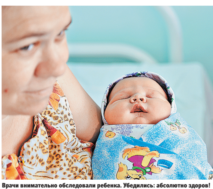
Врачи внимательно обследовали ребенка. Убедились: абсолютно здоров!

Видео смотрите на сайте www.rg.ru/art/1267680