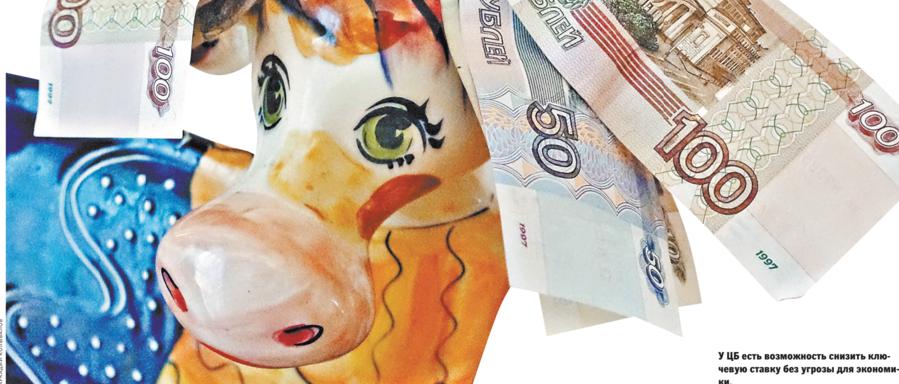
У ЦБ есть возможность снизить ключевую ставку без угрозы для экономики.