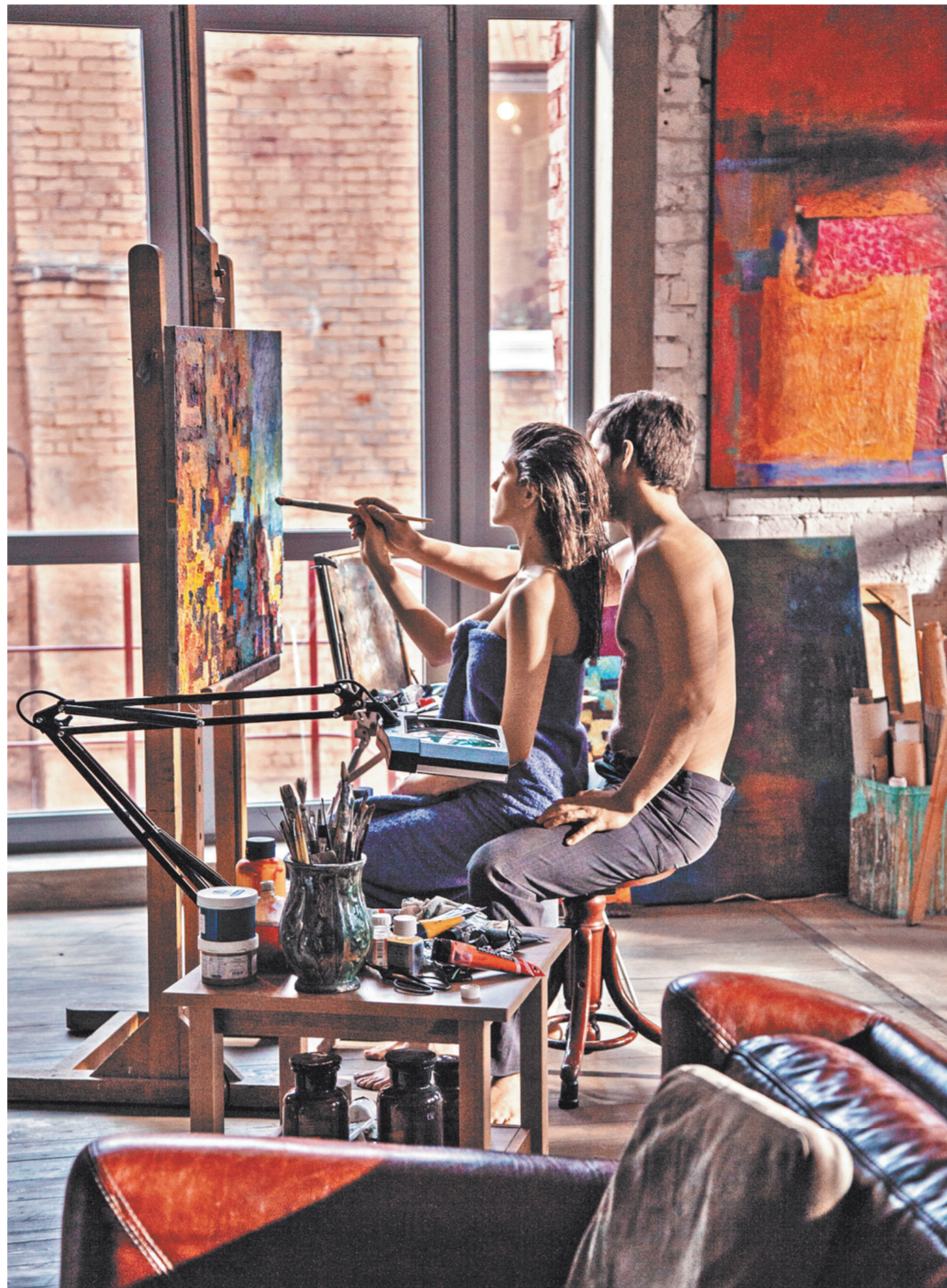
Жанр картины выглядит довольно интригующе—это триллер о махинациях в сферах искусства.

Нужно признать, что режиссерская ипостась Давлетьярова к пятой картине прокачалась до вполне кондиционного уровня—«Чистому искусству» не откажешь ни в логике повествования,