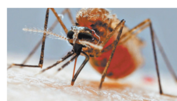
Как комар сосет кровь? Сложный процесс сняли на видео www.rg.ru/art/1268685

Отдельно говорится, что сами бортпроводники могут проводить обработку без средств индивидуальной защиты. «Эти инструкции разработаны на основе международных рекомендаций Всемирной организации здравоохранения», — уточнила Светлана Рославцева.