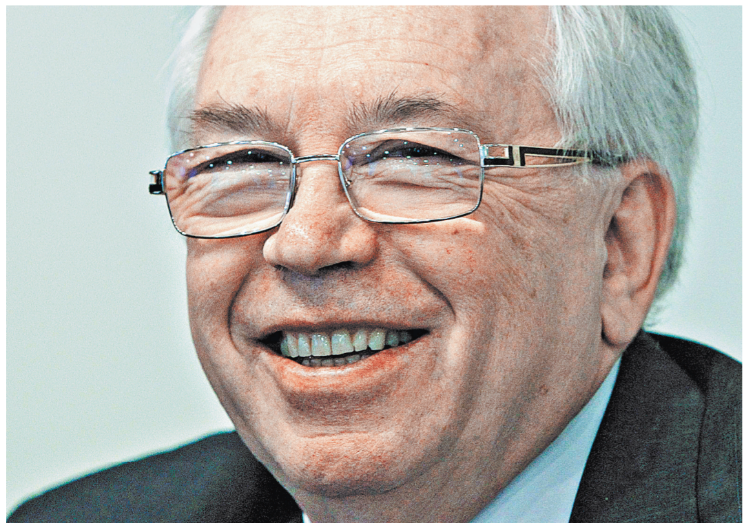
Владимир Лукин при его согласии представлять регион в Совфеде должен баллотироваться на выборах в связи с кандидатом в губернаторы.

Фоторепортаж на сайте www.rg.ru/sujet/1560