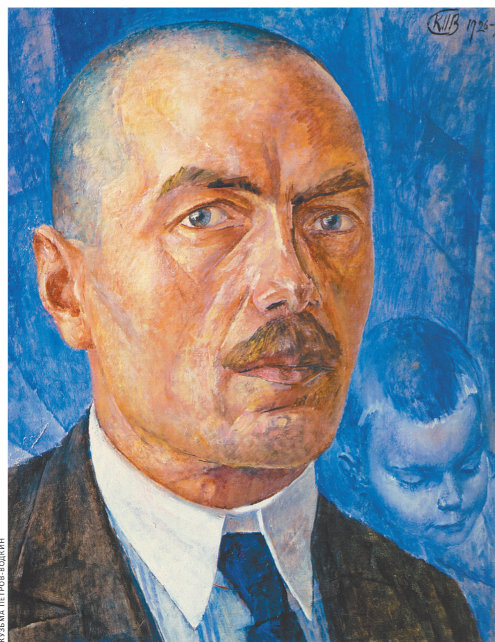
Кузьма Петров-Водкин. Автопортрет. 1926—1927 гг.

Собранные из семи художественных музеев России и десятка частных коллекций, произведения эти воссоздают целый пласт несправедливо забытого искусства.