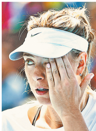
Мария Шарапова намерена обжаловать сроки дисквалификации в Спортивном арбитражном суде.

В заявлении на официальном сайте Международной федерации тенниса (ИТФ) говорится, что Шарапову признали виновной в нарушении антидопинговых правил и дисквалифицировали на два года, начиная с 26 января 2016-го.