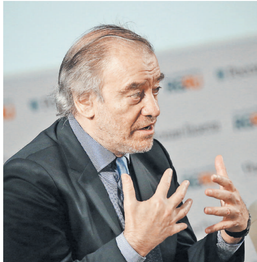
Валерий Гергиев: Мы будем работать с оркестром фестиваля в Вербье столько, сколько будем находить это занятие взаимно интересным. И я думаю, это будет замечательный опыт.