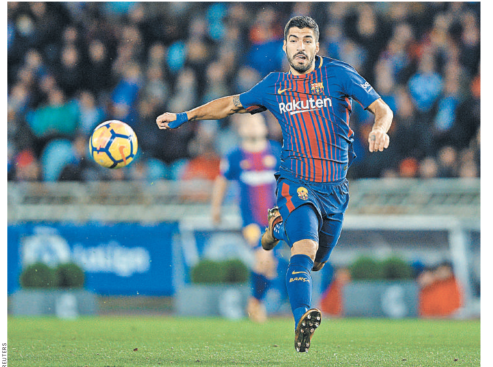
Форвард «Барселоны» и сборной Уругвая Луис Суарес прославился на весь мир своими укусами. Впрочем, от дурных привычек уругваец давно избавился, а вот забывать меньше не стал.