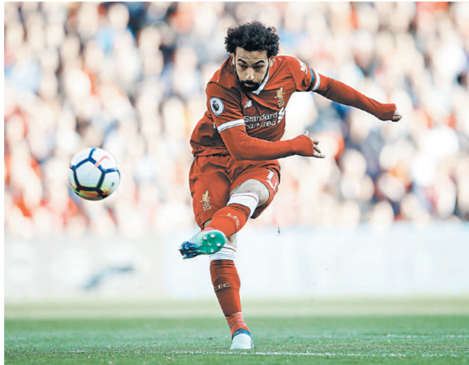
Египтянин Мохамед Салах провел фантастический сезон за «Ливерпуль», забив 44 мяча во всех турнирах, и в Россию приехал в статусе одной из главных звезд ЧМ-2018.