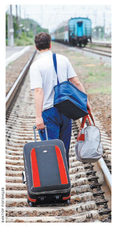
Такая беспечность оборачивается трагедией и сбоями в расписании.

Серьезно влияют на график движения поездов и автомобилисты, которые не соблюдают правила переезда через пути. Только за пять месяцев 2018 года число погибших в результате ДТП на переездах увеличилось к уровню прошлого года на 11 процентов, хотя количество пострадавших в столкновениях уменьшилось на 20 процентов. Возможно, их станет еще меньше. Законопроект о повышении штрафа с 500 до 5000 рублей за проезд на запрещающий сигнал светофора через пути уже внесен в Госдуму. Но в РЖД полагают, что только штрафами вопрос не решить, и предлагают лишить автомобилиста прав на два года за повторное нарушение правил переезда.