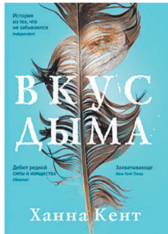
В 1829 году, к которому привязано действие этого как бы детектива, в Исландии было все то же самое — разве что без Бьорк.

—Разве, госпожа Маргрет? Мне казалось, что их называют «бессердечие».