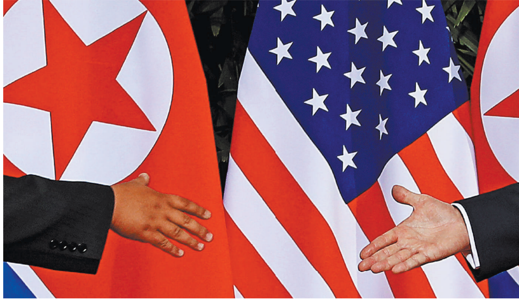
Американская политическая элита рукоплещать Трампу не спешит, поставив под сомнение продуктивность избранной им переговорной стратегии в отношении КНДР.

Президент США Дональд Трамп, вернувшись в Вашингтон из Сингапура, где он встретился с северокорейским лидером Ким Чен Ыном, триумфально заявил, что «ядерной угрозы КНДР более не существует». Но американская политическая элита рукоплещать своему лидеру не спешит, напротив, поставив под сомнение продуктивность избранной Трампом переговорной стратегии. Наибольший резонанс вызвали заявления президента США о намерении прекратить совместные военные учения с Республикой Корея (РК), что комментаторы единогласно называют большой уступкой Пхеньяну. На пресс-конференции в Сингапуре хозяин Белого дома назвал учения «провокационной ситуацией». По сути он опроверг позицию собственных военных, которые десятилетиями называли маневры исключительно оборонительными и не представляющими никакой угрозы для КНДР. В довершение Трампа в своем стиле пожаловался на то, что РК недостаточно вкладывается в учения, которые «влетают в копеечку» американским налогоплательщикам, а потому их отмена позволит сэкономить много средств. В довершение он дал понять, что в будущем собирается «вернуть домой» контингент из около 28,5 тысячи американских солдат, дислоцированных в Южной Корее, хотя сейчас говорить об этом преждевременно.