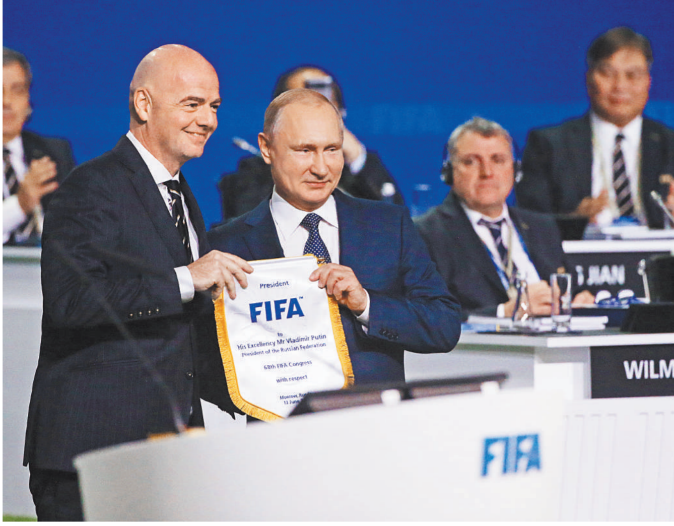
Джани Инфантино вручил президенту России вымпел с символикой ФИФА.