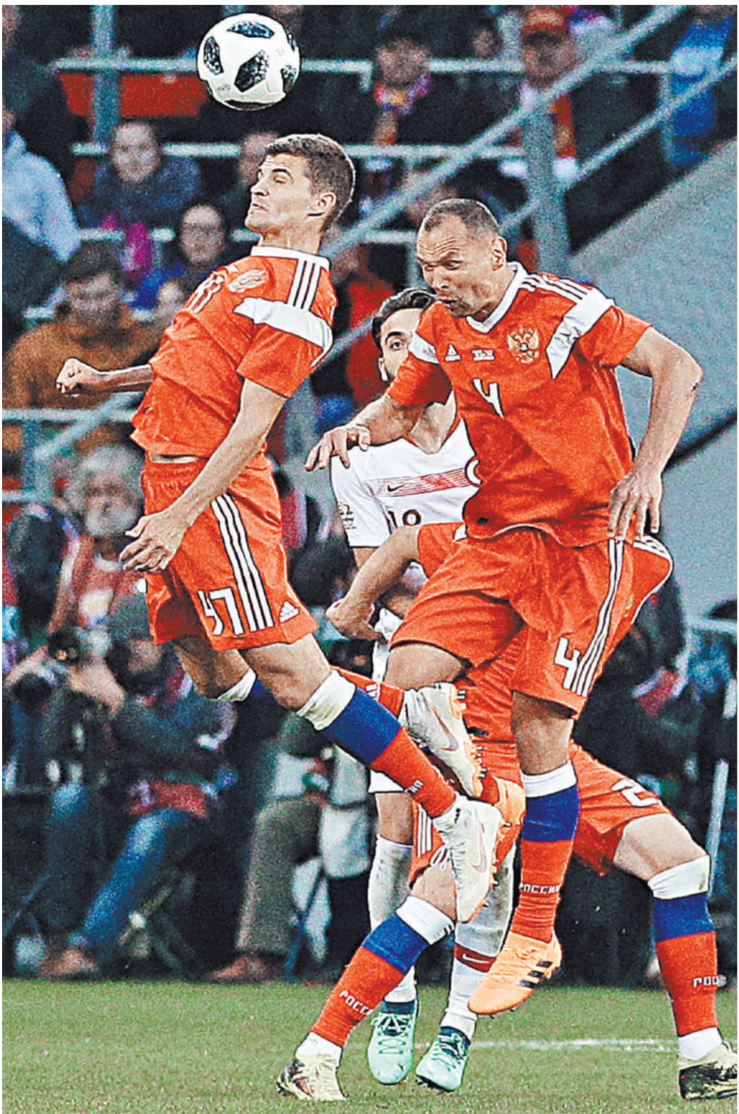
Сергей Игнашевич (справа) — самый возрастной игрок в истории сборной нашей страны.

9 > СТАНИСЛАВ ЧЕРЧЕСОВ: Он учитывается. Но мы же не комсомольская организация, чтобы партсобрания устраивать, еще что-то. Играть на таком уровне, ты понимаешь, что такое футбол, что у него внутри, какие мысли. Это помогает. Да и футболист знает, что его тренер сам играл на таком уровне, а не прочитал об этом где-то в газете. Уже есть контакт, доверие. Играть там, ты знаешь, что ждет. Определенный опыт игроцкий помогает. Но это не значит, что без тренерских знаний он что-то дает.