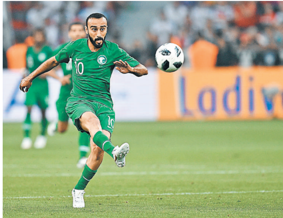
Этой весной 31-летний форвард сборной Саудовской Аравии Мухаммед аль-Сахлави на протяжении трех недель тренировался вместе с игроками «Манчестер Юнайтед».