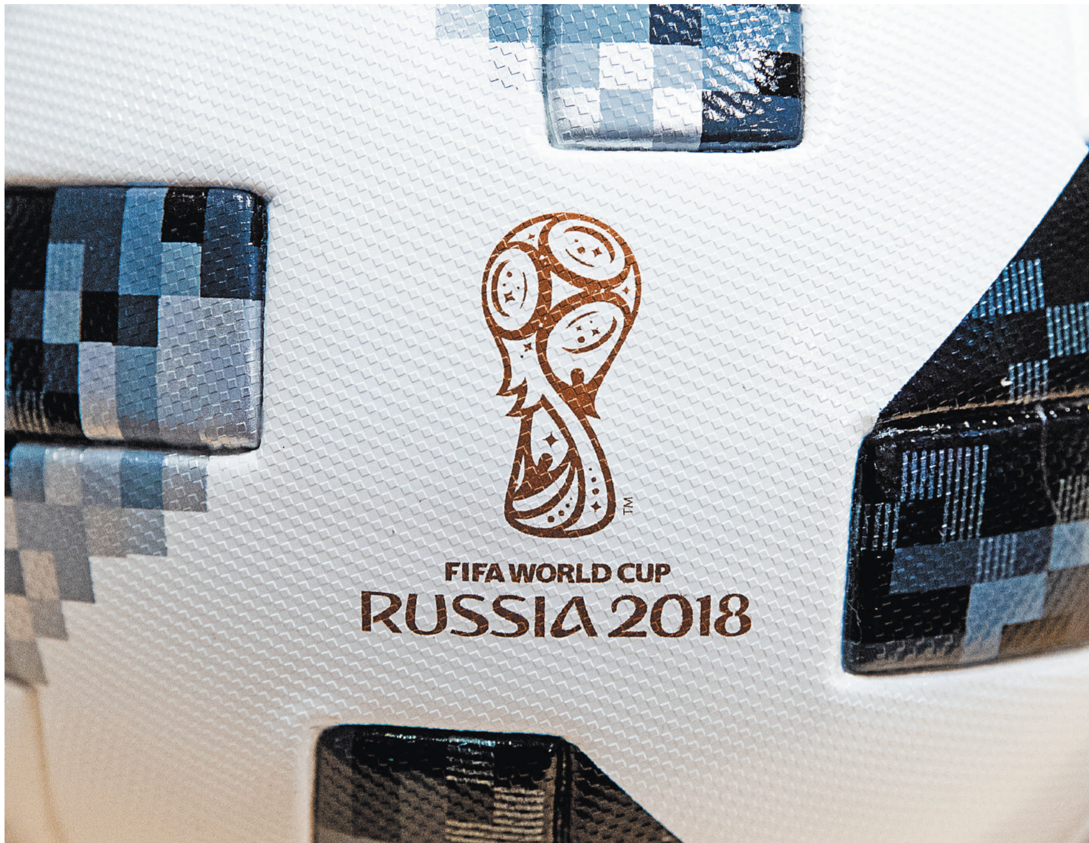
FIFA WORLD CUP RUSSIA 2018

1 → Может, увидев, что у нас и как, поверят очень активные в жизни и передвижениях по свету зарубежные фанаты в доброту России. Сотрутся в их памяти весь злобный поток антироссийских страшилок, на них неустанно выливаемый. Увидят, осмыслят и никакие разоблачители а-ля хайо эспельтг всерьез восприниматься не будут. Самостоятельно сделанная на месте фотография врать не может.