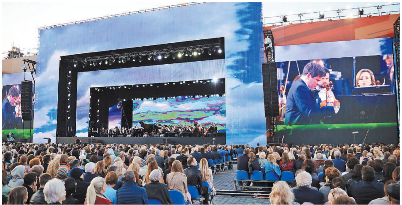
В среду вечером на Красной площади состоялся гала-концерт звезд мировой оперной сцены, приуроченный к началу чемпионата мира.

«Наша страна готова принять у себя чемпионат мира ФИФА, обеспечить всем, кто придет в Россию, максимум комфорта и максимум позитивных эмоций...»