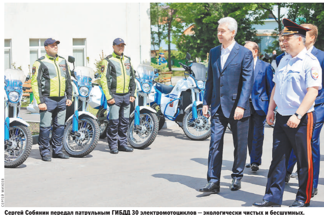
Сергей Собянин передал патрульным ГИБДД 30 электромотоциклов — экологически чистых и бесшумных.