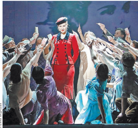
Свердловский театр музыкальной комедии впервые на русском поставил «Эвиту» Уэббера — историю актрисы, ставшей первой леди Аргентины и предметом поклонения толпы.