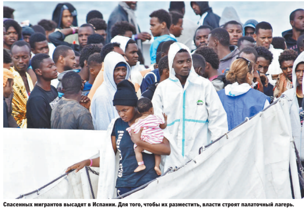
Спасенных мигрантов высажат в Испании. Для того, чтобы их разместить, власти строят палаточный лагерь.

Решение Сальвини закрыть итальянские порты для приема