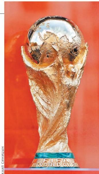
Кубок мира ФИФА впервые вручили на чемпионате мира 1974 года. Он изготовлен из золота 18 карат на малахитовом основании, на призе, который достанется победителю ЧМ-2018, изображены две человеческие фигуры, подпирающие Землю.

Турниры 1998 и 2014 годов пока рекордные по общему числу забитых мячей — по 171 голу в 64 матчах (в среднем 2,67 за игру). Чтобы превзойти этот результат, в России командам-соперникам нужно придерживаться нормы 8 голов за три матча плюс в какой-то из встреч забить 3 мяча. Тогда прежний рекорд будет побит.