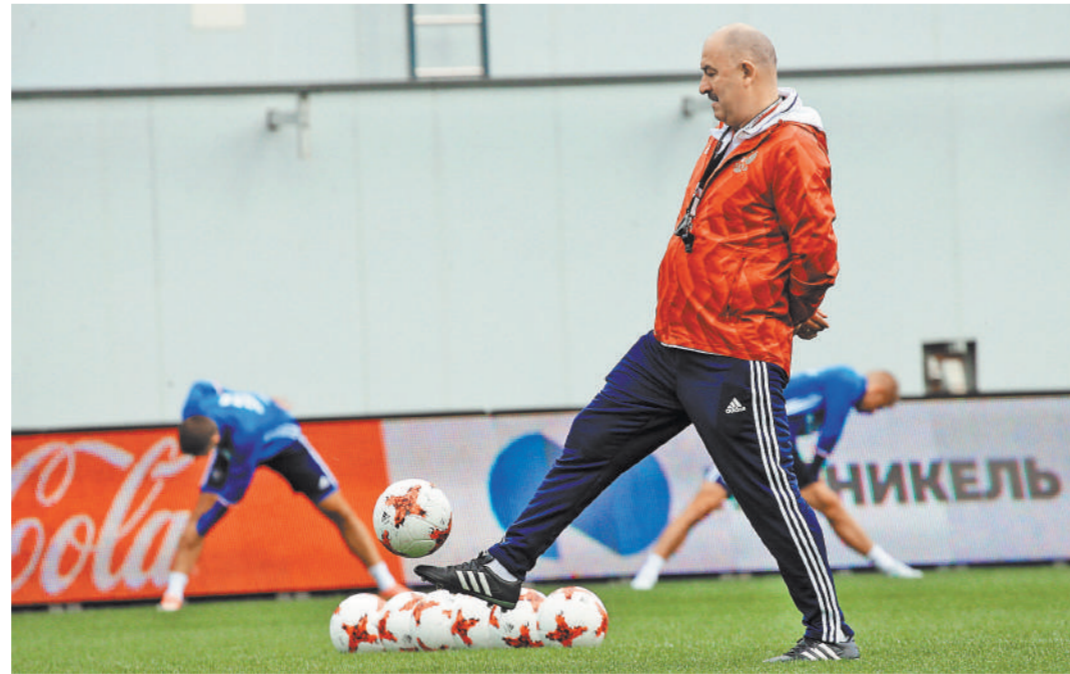
Станислав Черчесов подошел к старту чемпионата мира уверенным в себе и своей команде.

Станислав Черчесов: Это нас сильно расстроило, честно вам говорю. Мы нацеливались на большее. Потому что видели, как команда работает. С одной стороны, это приобретенный опыт, который в том числе влияет на направленные подготовки к чемпионату мира. С другой — 8–9 человек из того состава отсутствуют. Значит, надо опять что-то менять. Нет центральных защитников, которых мы все время наигрывали. Бразилия и Франция были правильными соперниками, чтобы другие связки проверить. В какой-то степени это удалось. С листа сыграть с такими командами не так-то просто. Будем думать, как это все решить. И людей зацепить своей энергетикой, иг-