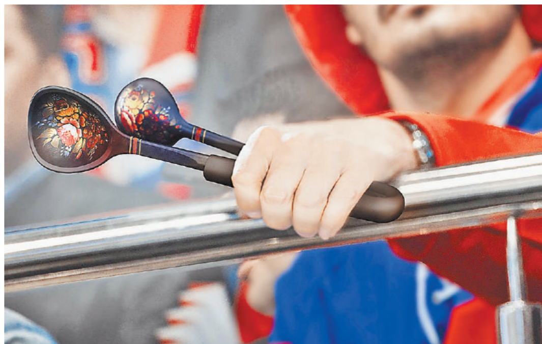
Начиная с ЧМ-2018 в арсенале наших болельщиков появится новый музыкальный инструмент — «ложки победы».

Перед чемпионатом мира-2018 в России под жесткий запрет для