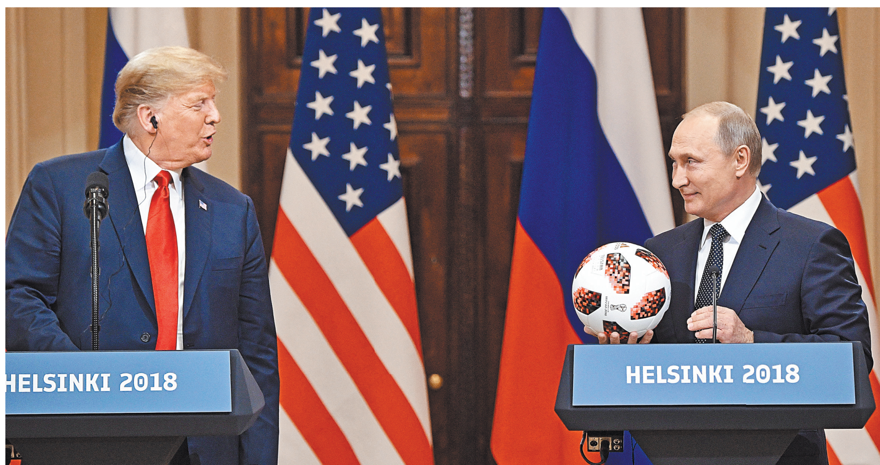
Мяч по урегулированию в Сирии на стороне США, заявил Владимир Путин и передал Дональду Трампу футбольный мяч.