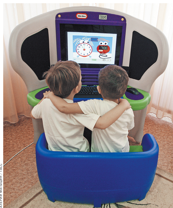
STEM-программа включает не только знакомство с техникой и технологиями, но и творчество.

Аббревиатура STEM становится в российской образовательной среде все популярнее. Расшифровать ее можно так: Science—Наука, Technology—Технология, Engineering—Инженерное дело, Math—Математика. Программы, созданные в рамках этой концепции, уже прочно прописались в вузах, школах и центрах дополнительного образования. А теперь в нее погружаются и детские сады.