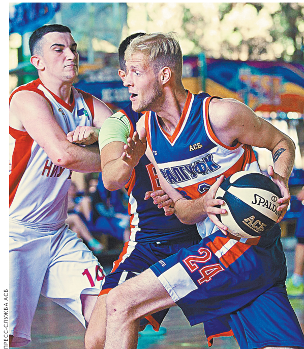
В течение десяти дней игроки лучших студенческих команд страны в Крыму смогут и пообщаться, и посоревноваться.

Из лучших игроков АСБ с недавних пор формируются студенческие сборные страны для участия во Всемирных университетах и других международных соревнованиях. К примеру, победители Лиги Белова мужская команда МГУ и девушки из Санкт-Петербургского политеха сейчас выступают на Европейских университетских Играх в португальском городе Коимбра. А в начале августа мужская сборная отправится в Южную Корею на Asia-Pacific University Basketball Challenge.