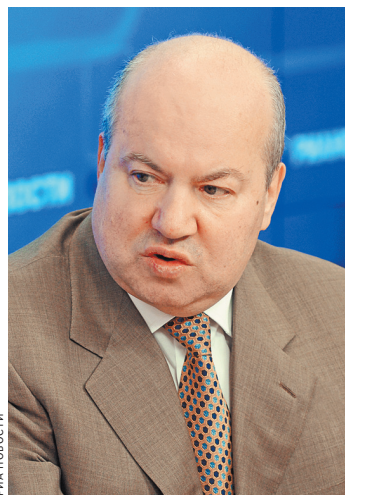
Василий Лихачев: Укрепление и развитие сложности российской дипломатии — предмет разговора в ходе «посольского сбора».

Полный текст читайте на сайте rg.ru/art/1568214