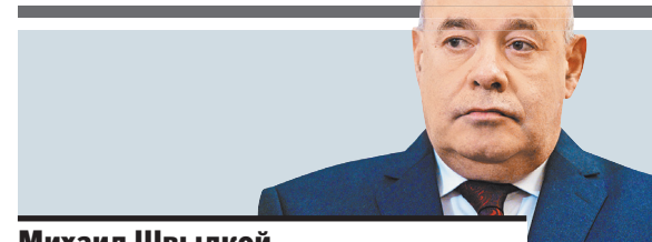
Михаил Швидкой доктор искусствоведения