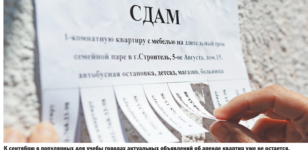
К сентябрю в популярных для учебы городах актуальных объявлений об аренде квартир уже не остается.