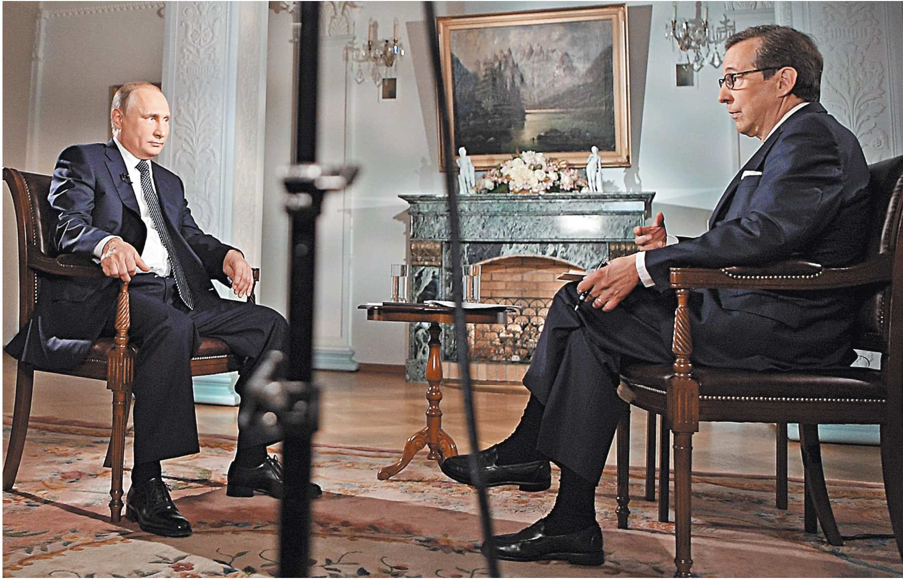
Владимир Путин и журналист телеканала Fox News Крис Уоллес в ходе интервью.

«Поэтому мы смогли затронуть все основные проблемы, которые нас интересуют в двустороннем формате, и по некоторым вопросам... мы договорились», — продолжил президент России. — В частности, по некоторым вопросам урегулирования в Сирии, в частности, в южной зоне деэскалации, в районе Голанских высот, с учетом интересов Израиля — мы об этом говорили ранее и с нашими иранскими партнерами — в целом, мне кажется, мы на правильном пути с точки зрения урегулирования ситуации в более широком смысле, а не только чисто сирийской проблемы».