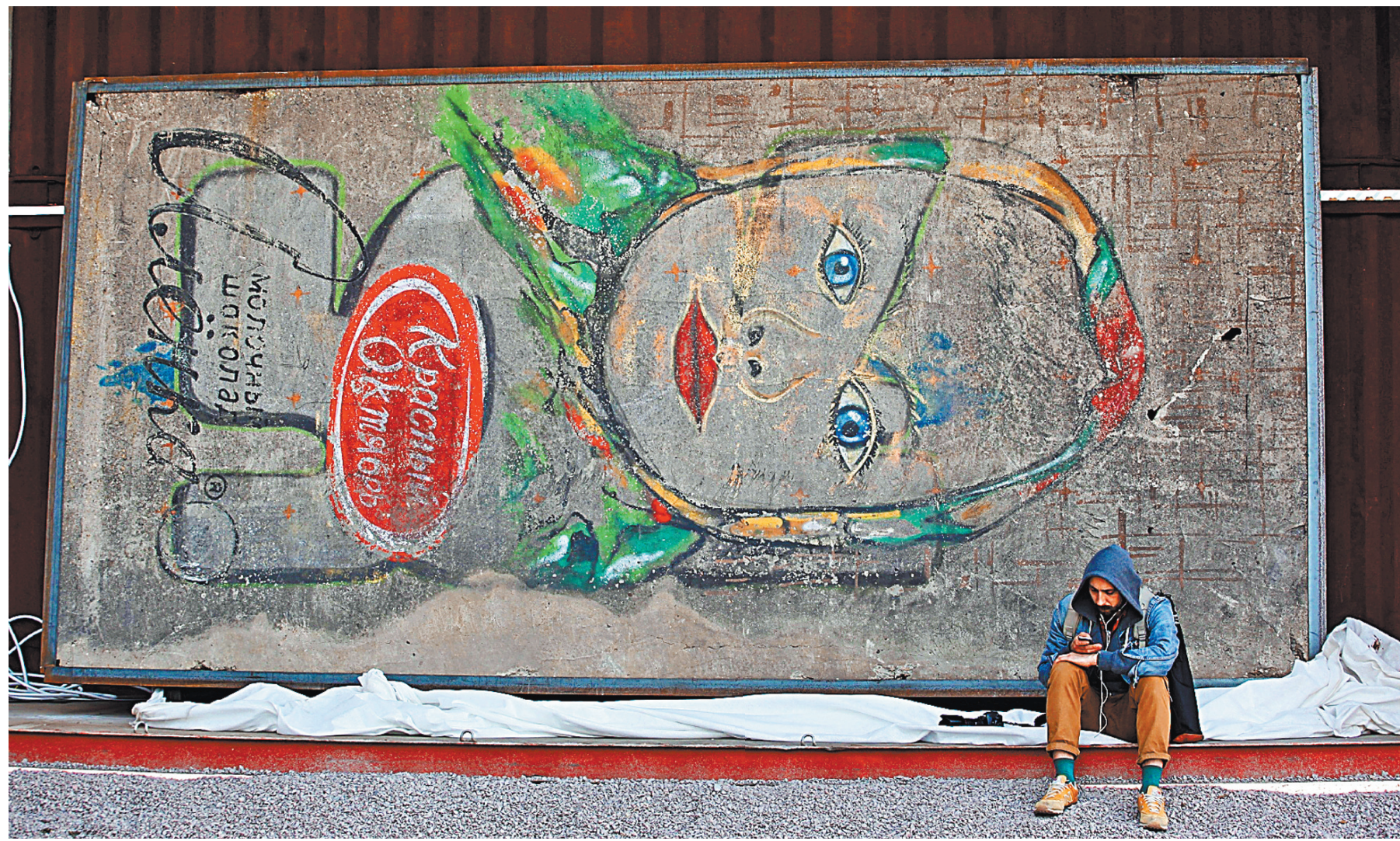
Российский шоколад стал любимым лакомством в Казахстане, Белоруссии и Китае.

По мнению эксперта, в этой работе бизнесу могли бы помочь не только профильные ведомства, но и посольства, торгпредства. Было бы неплохо вообще со-