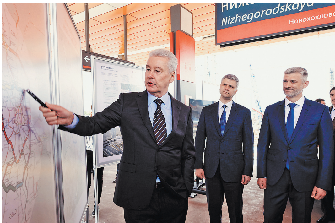
Москва может победить пробки на дорогах, уверен Сергей Собянин. С этой целью она строит в таких масштабах новые дороги, развивает метро и железные дороги в черте города, обновляет общественный транспорт.