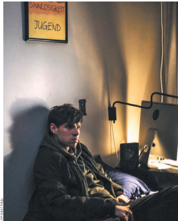
Хаотичные метания главных героев фильма — не что иное, как поиски человека, который заменил бы им отца.

нечего сказать. В фильме по-дурацки нарочита а от того довольно комична. Но тут, конечно, неплохо бы себя одернуть и вспомнить, что и авторам, и целевой аудитории «Кислоты»