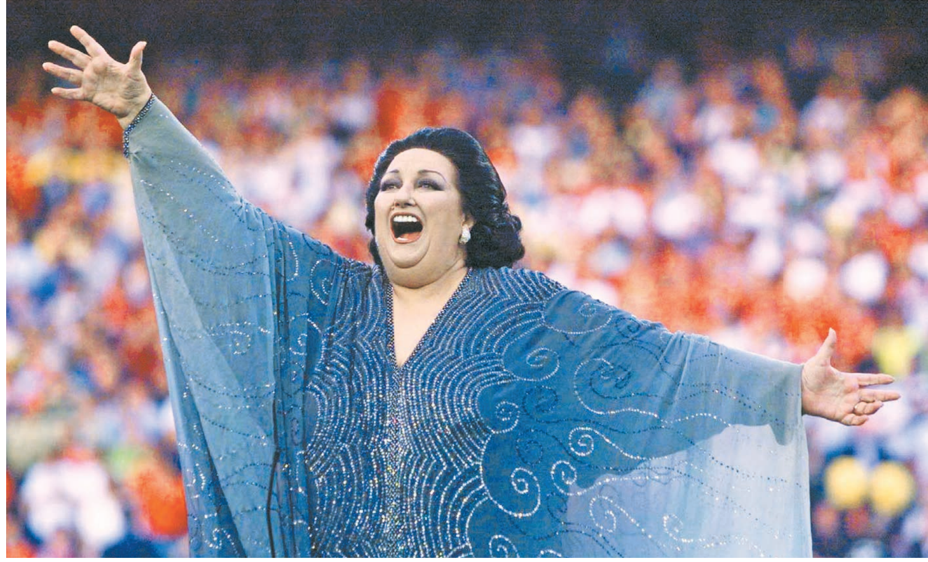
Именно такой: красивой, яркой и поющей будто для каждого из нас — мы и помним Кабалье.

Но безграничная популярность, когда Кабалье начали узнавать даже те, для кого «опера» — это полицейские, настигла в тот