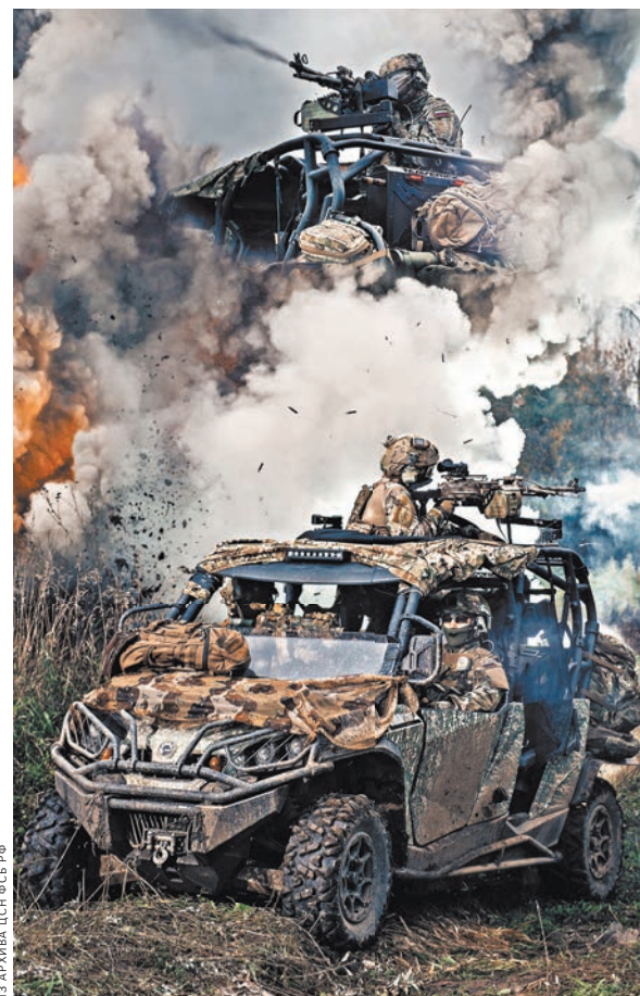
Багги используются для скоростного перемещения спецназа на пересеченной местности и в лесу.

Каждый сотрудник ЦСН — это универсальный мастер, который может решать самые сложные боевые задачи