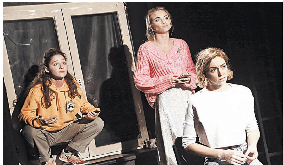
Эта обычная, но очень актуальная история словно перекочевала в театр из соцсетей и школьных коридоров.

Старшим зрителям будет интересно увидеть новое поколение рамтовцев, а подросткам — узнать рассказанную на их языке историю о том, как человеческие свойства — смелость, готовность испробовать ошибки, великодушие — важны в эпоху соцсетей, как и в любую другую.