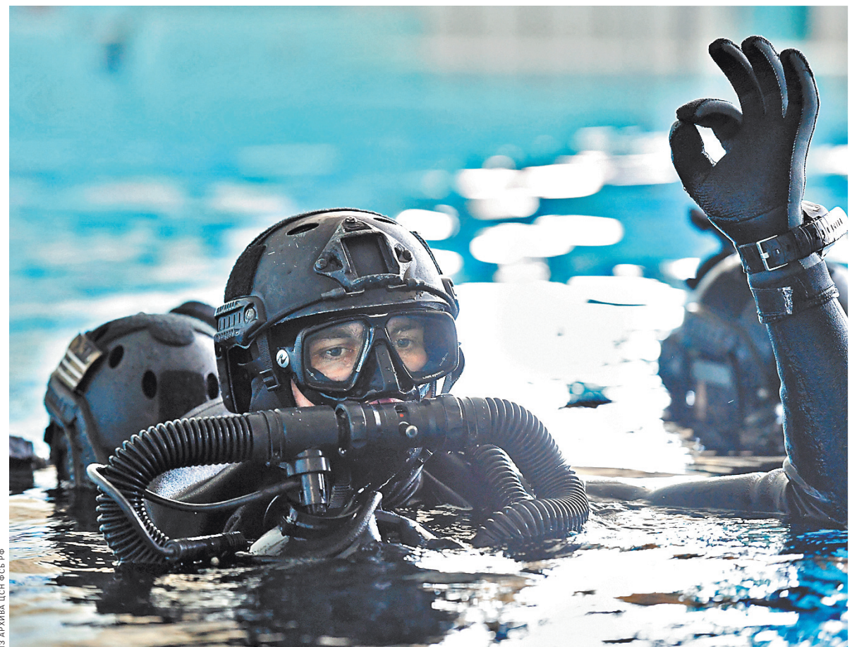
В Центре специального назначения действуют подразделения боевых пловцов, предназначенные для проведения оперативно-боевых действий в прибрежной полосе и на объектах водного транспорта.