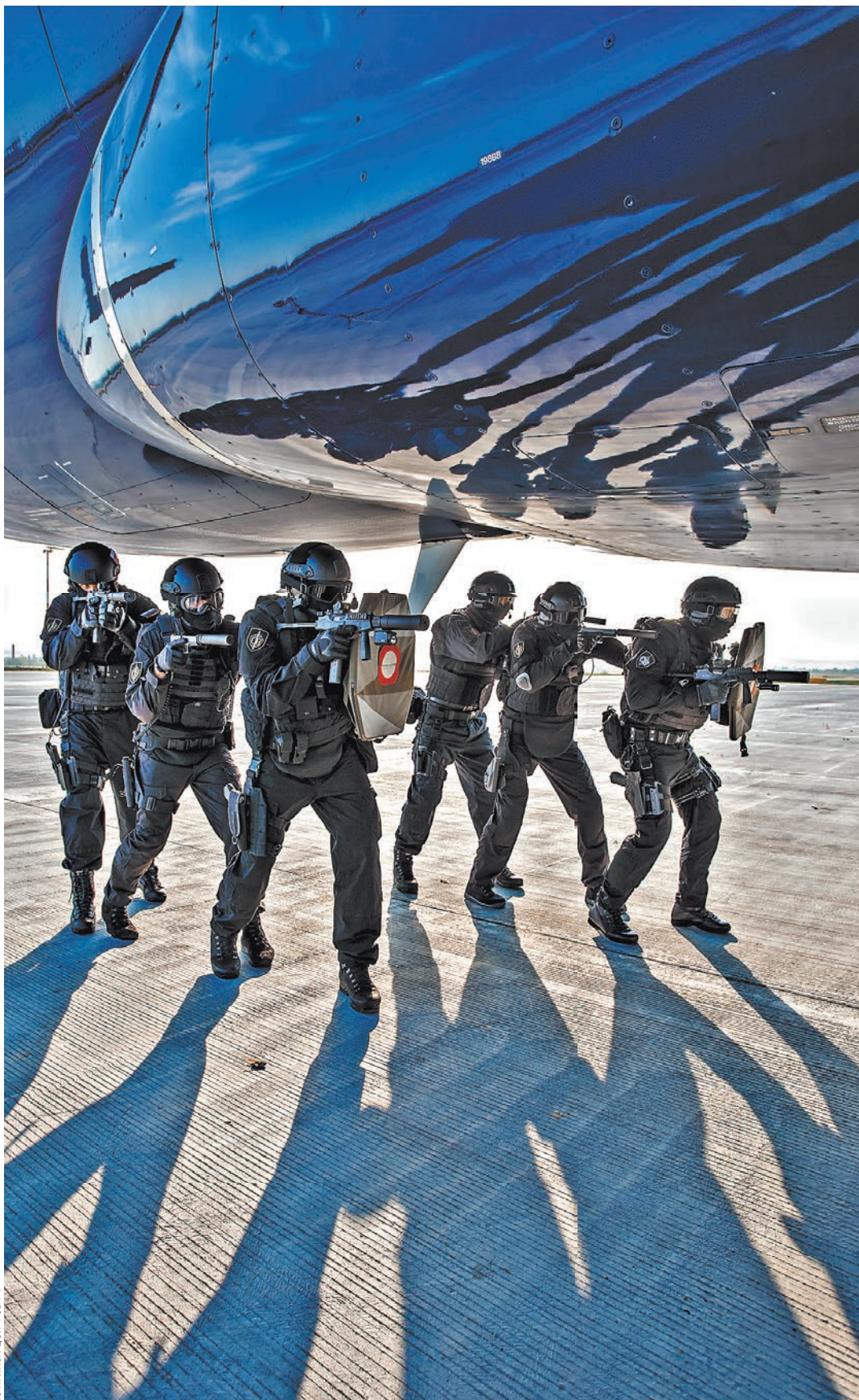
Тренировки по освобождению заложников и задержанию преступников происходят на реальных объектах: самолетах, вертолетах, железнодорожных вагонах, автобусах, автомобилях, в зданиях и сооружениях.

Помимо работы в горах сотрудники обучаются промышленному альпинизму. Один из тактических приемов, которыми они владеют, — «живая лестница», когда в считанные минуты боевая группа без страховки может взобраться на крышу многоэтажного здания. В Центре действуют подразделения боевых пловцов, предназначенные для проведения оперативно-боевых действий в прибрежной полосе и на объектах водного транспорта. Воздушно-десантная