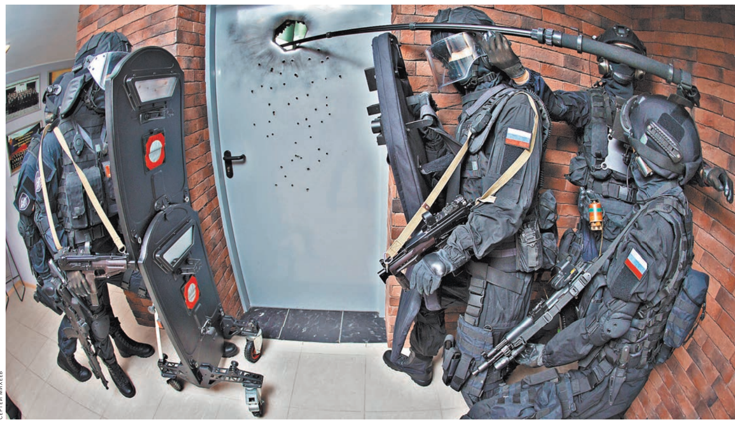
В музее ЦСН смоделирован реальный эпизод боевой работы подразделения спецназа. Перед штурмом глухого помещения в железной двери путем подрыва небольшого заряда проделывают отверстие, после чего помещение осматривают камерой на телескопической штанге.