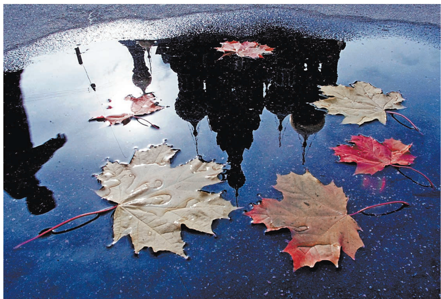
Митрополит Онуфрий: Использование Церкви ради удовлетворения собственных корыстных целей является настоящим цинизмом.