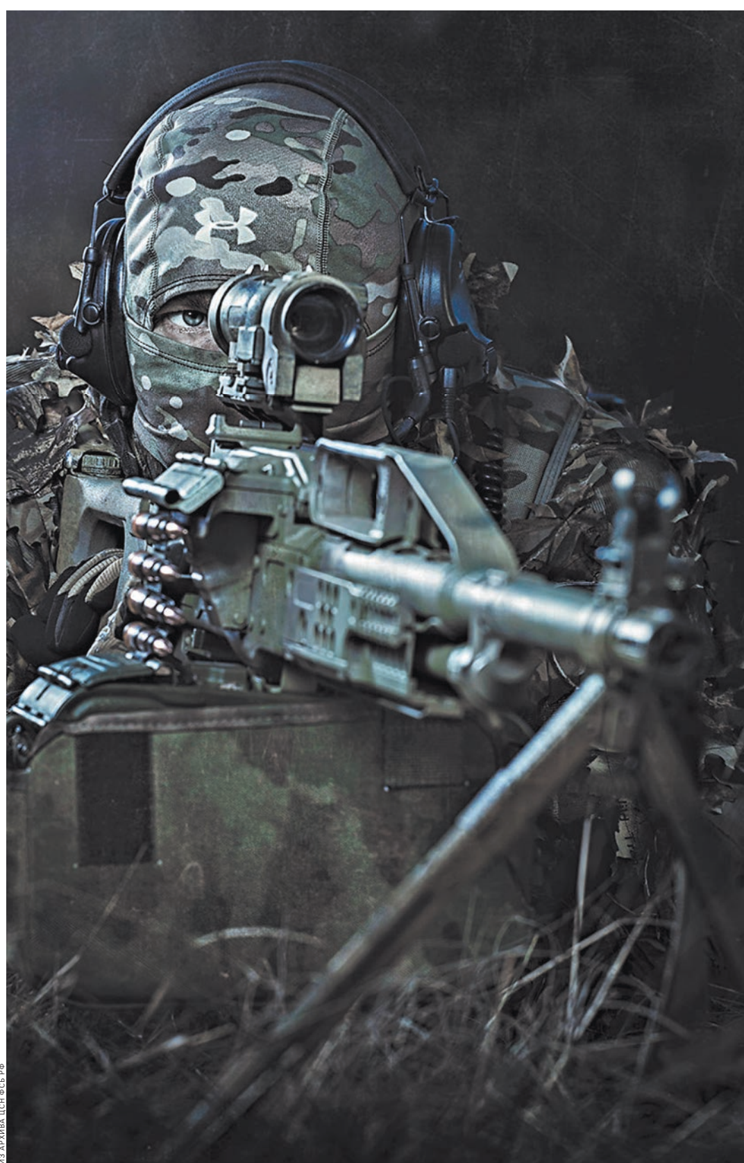
Решение о создании ЦСН было продиктовано фактически развернутой против России террористической войной.

О подробностях их службы не знают даже близкие, а для всех окружающих — их муж, сын или папа просто военнослужащий.