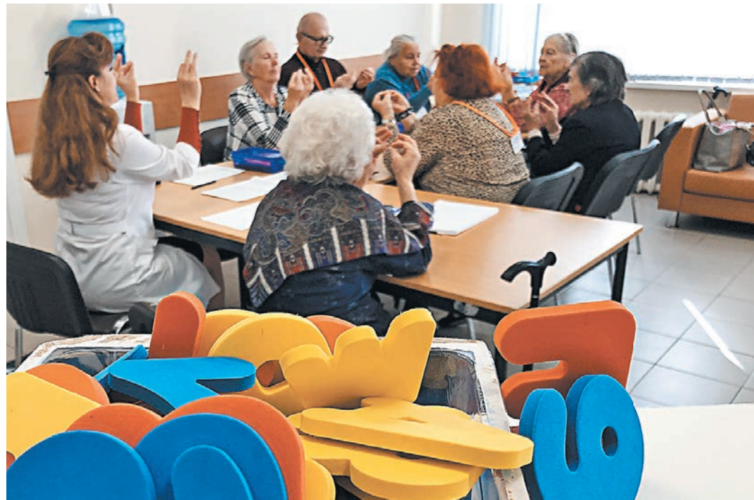
Курс реабилитации длится шесть недель. Все это время с пациентами занимаются опытные специалисты.

Начинались занятия ежедневно в 9.30 утра с лечебной физкультурой, затем с 10.00 до 13.00 тренинги, после обеда, получив домашнее задание, пациенты прощались до завтра. Врачей восхищала дисциплинированность и ответственность, с какой пациенты подходили к своему обучению. Научились пациенты не просто лучше планировать свою жизнь, но и справляться с поставленными целями. Повторно пройти курс — такое желание высказали многие, они смогут через полгода. Скоро к занятиям приступят новые пациенты — теперь не две группы по восемь человек, а четыре.