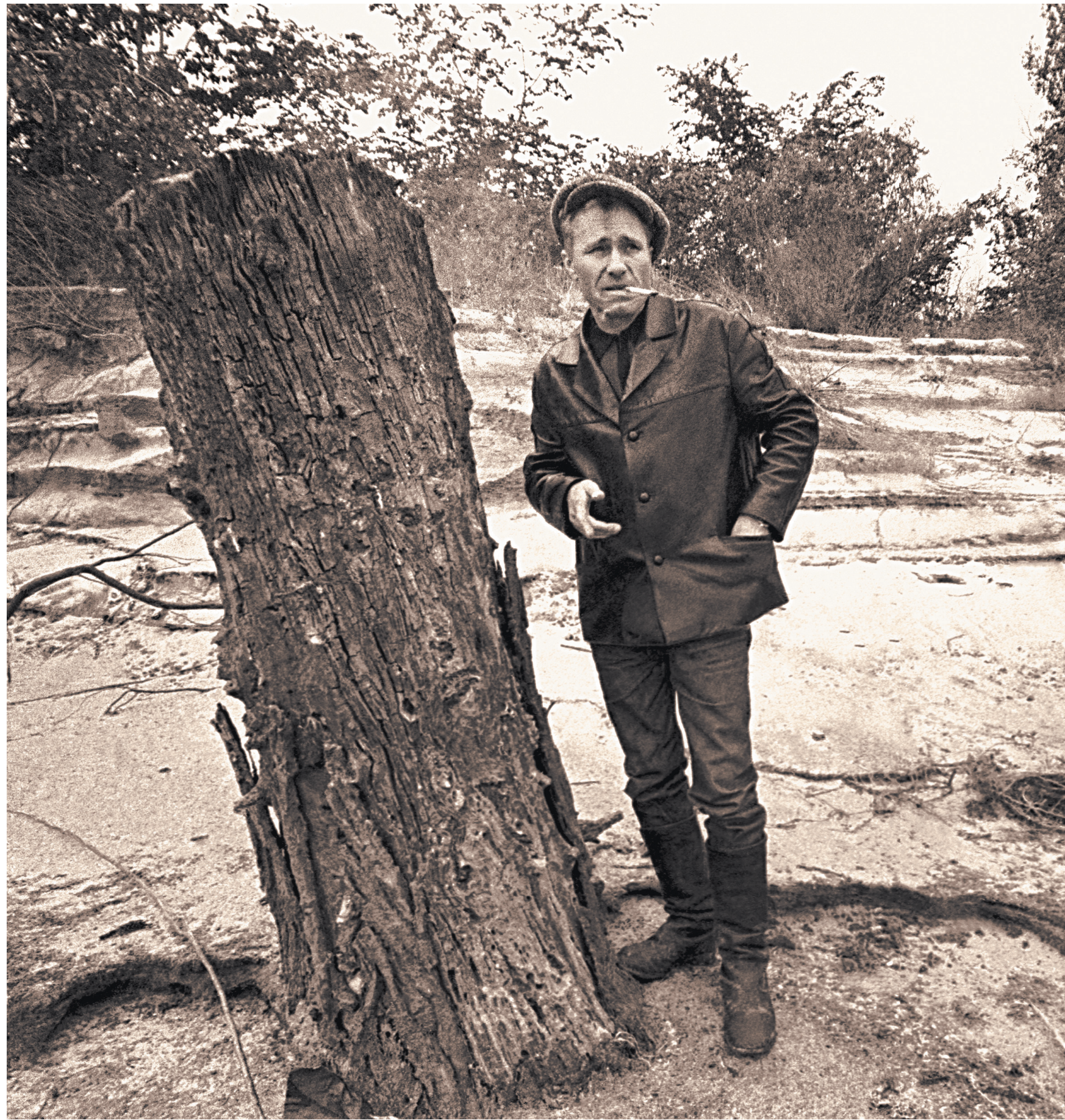
АНАТОЛИЙ КОВТЕН / ТАСС