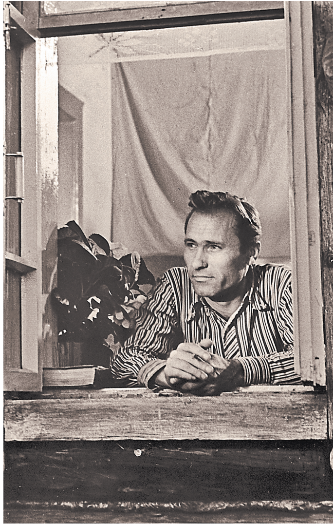
Василию Макаровичу Шукшину исполнилось бы сегодня 90 лет.

Наряду со старыми домскими рождаются и свежие. Один из них с рекламно-призывным уклоном: Шукшин был певцом красот и просторов Алтай. Как, вы еще здесь не были? Приезжайте, убедитесь воочию — у нас рай для туристов!