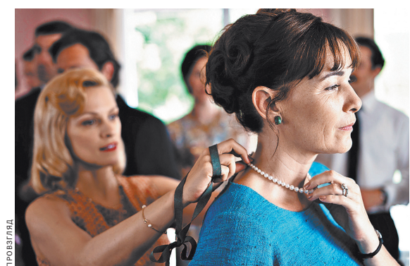
Кадр из фильма «Материнский инстинкт». Оливье Массе-Депасс умудрился снять триллер, где движущая сила — только женщины.

Потом один из малышей — Максим — погибнет. И обе женщины будут мучиться чувством вины, тем более болезненным, чем в нелепой случайности никто не виноват. И начнется подобие слияния парной, обуреваемой попеременно то одну, то другую героиню. Она, как нам кажется, вне логики и трезвых расчетов. Идут парадоксальные обмены ролями (сын теряет отца, а в безумие впадает другая), игра смутных подозрений, незримое фехтование (в оригинале фильм называется «Дуэли»), и мы до самого конца не будем знать, кому больше сочувствовать и кого больше опасаться. Надо сказать, перед нами довольно