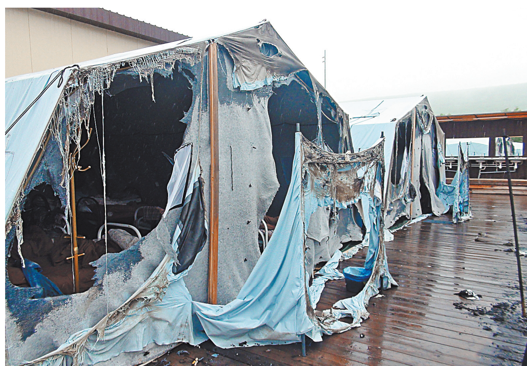
Палатки стали огненной ловушкой для детей, хотя по документам отвечали требованиям пожарной безопасности.

О ЧЕМ ГОВОРЯТ Житель Северодвинска попытался дать взятку, чтобы стать призывником