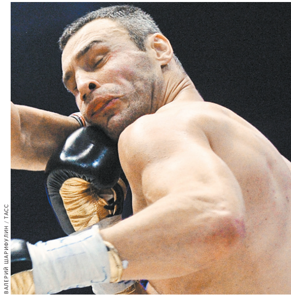
Кличко вновь досталось — на этот раз от президента Украины.

В окружении действующего премьера Владимира Гройсмана пока не спешат комментировать дальнейшую судьбу Кличко, однако в «команде Зе» уже назвали возможного нового главу КГГА. Им должен стать главный медиаменеджер Коломойского, гендиректор телеканала «1+1» и уже три дня как депутат Верховной рады Александр Ткаченко — человек, приложивший немало усилий не только для победы Зеленского на выборах, но также к разжиганию гражданской войны на Украине. ●