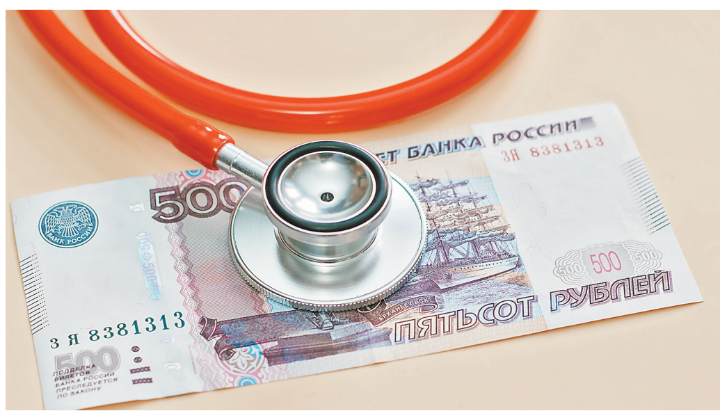
По мнению врачей, местные власти попытались их зарплаты соотнести со среднестатистическим доходом по области.

Но это тоже «средняя температура по больнице». Вероятно, достигнув «валовых» показателей повышения зарплат, власти и решили сэкономить на стимулирующих выплатах. Наднях Челябинский областной суд пришел к выводу, что «приказ об исключении выплаты за выслугу лет из перечня выплат стимулирующего характера снижает уровень социальных гарантий работников, предусмотренных действующим законодательством РФ».