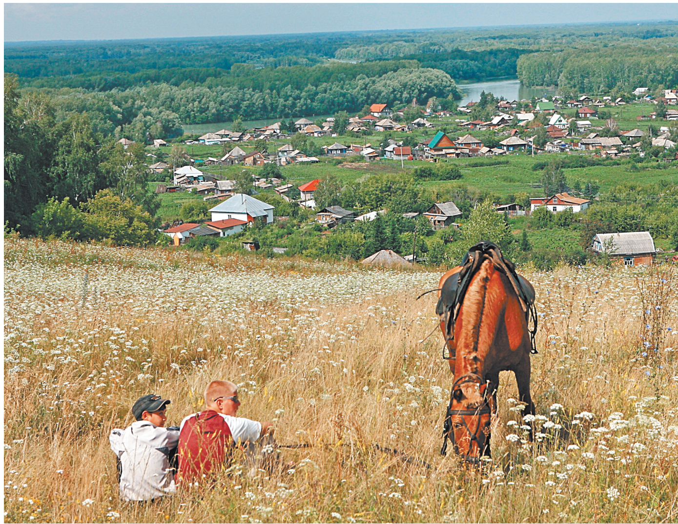
Русская деревня Шукшина оказалась близка и понятна всему миру.

Сергей Зюзин, «Российская газета», Барнаул