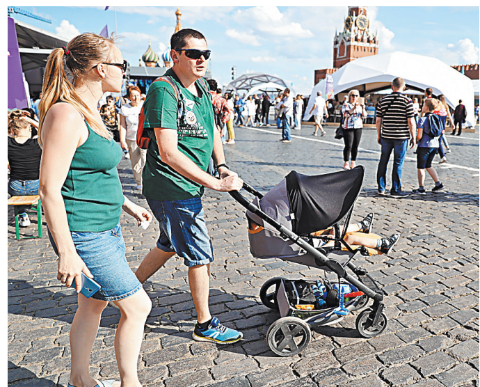
Число родителей, которые смогут получить «детские» выплаты, увеличится с 45,7 до 68 процентов.

— Узнайте больше о декретных и пособиях на ребенка на нашем сайте rg.ru/sujet/2002