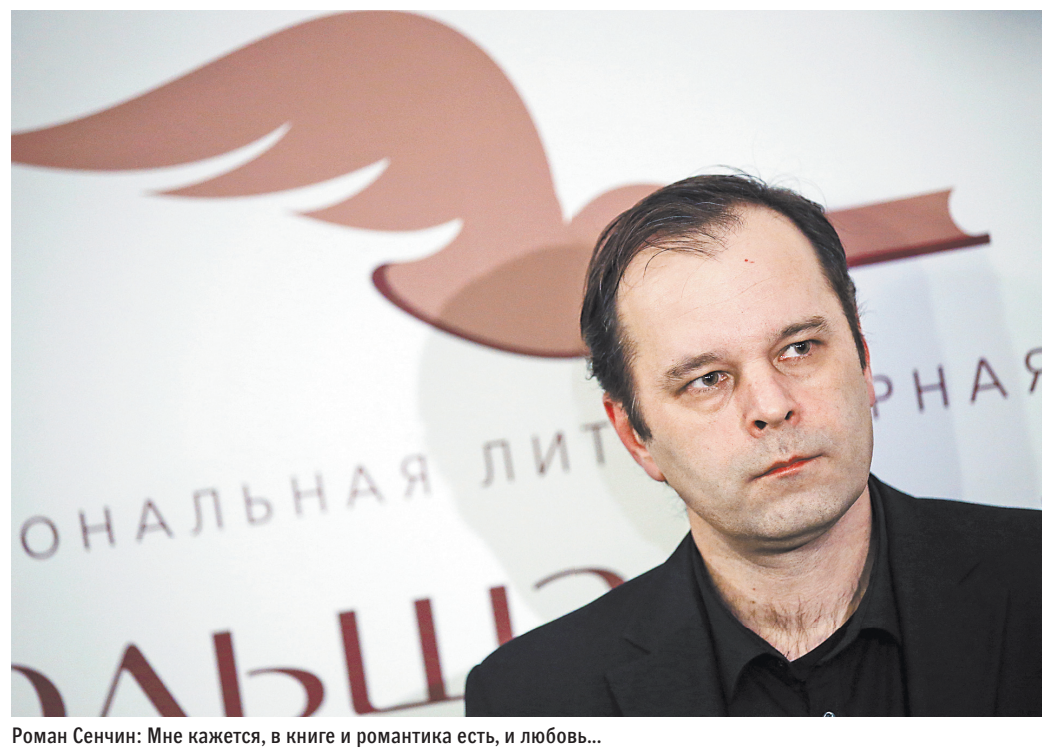
Роман Сенчин: Мне кажется, в книге и романтика есть, и любовь...

Писатель Роман Сенчин известен и как литературный критик, и даже как вокалист групп «Гаражная мелодика» и «Свободные радикалы». Родился в Кызыле, в семье служащих. В 1993 году Сенчини перебрались из Кызыла в Красноярский край, где занялись фермерским хозяйством. Роман Сенчин в начале 1990-х работал монтажным сценаристом в Минусинском драмтеатре, дворником, грузчиком. С середины 90-х публикует первые рассказы. Окончил Литинститут. Сенчин отмечен премиями «Ясная Поляна», журналов «Литературная Россия», «Знамя». В 2015 году роман «Зона затопления» получил третью премию «Большая книга». В 2017 году переехал из Москвы в Екатеринбург.