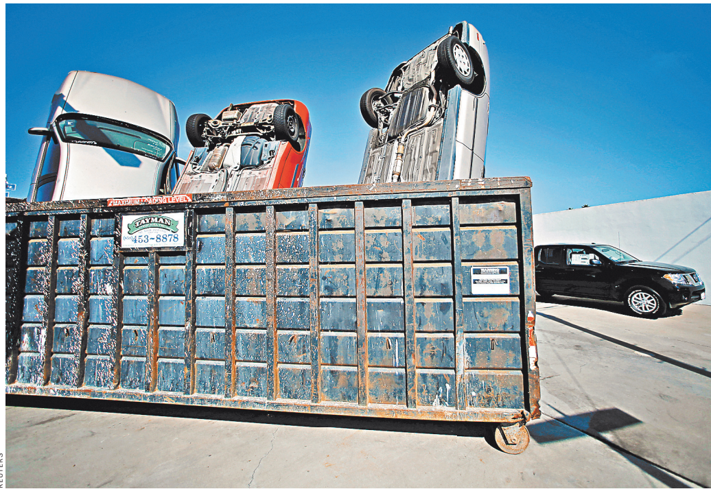
Трамп назвал машины из Европы угрозой нацбезопасности США и намерен повесить на них импортные пошлины.

Евросоюзу восприняли заявления Трампа именно в этом ключе и в долгу не остались. Комиссар ЕС по торговле Сесилия Мальмстрем назвала «абсурдными» тезисы об угрозе национальной безопасности США от произведенных в Старом Свете автомобилей, подчеркнув, что в Брюсселе не приемлют обещаний Белого дома квот и ограничений. Она сообщила, что руководство Евросоюза подготовило документ, в котором предусмотрены ответные меры на случай введения пошлин Соединенными Штатами. В этом случае Брюссель обложит пошлинами американские товары, объем импорта которых в страны сообщества составляет около 35 миллиардов евро (около 39 миллиардов долларов) в год.