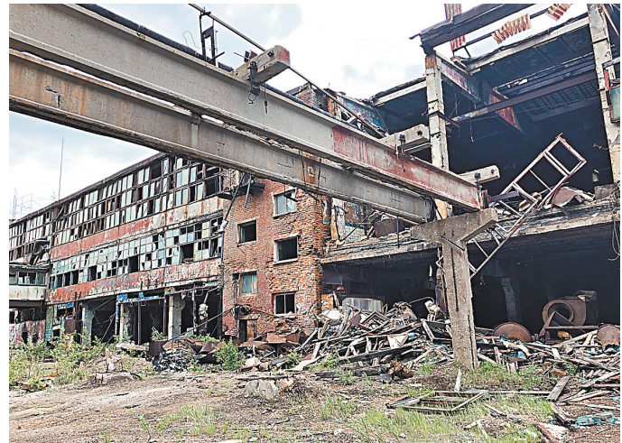
«Сталкерам» дорогу к опасным объектам перекрыли, осталось ликвидировать сами объекты.