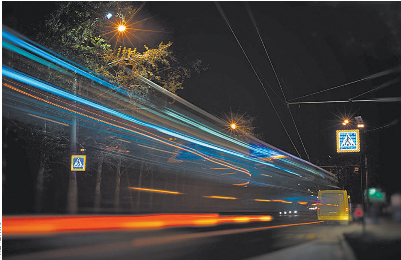
Дополнительная подсветка сделает заметным пешеходный переход в темноте.

Конечно, основное количество наездов происходит по вине водителей. В первом полугодии их зафиксировано немного более 10 тысяч. Но это на 23,1 процента меньше, чем в прошлом году. По вине водителей погибли 704 человека, что на 18,7 процента меньше, чем годом ранее. Надо заметить, что все-таки большинство наездов происходит вне пешеходных переходов. По оперативным данным, на пешеходных переходах под колеса за семь