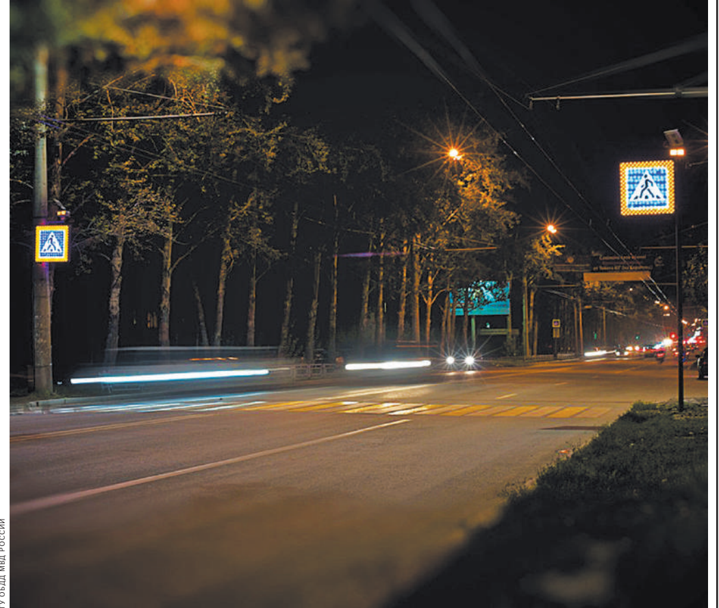
Когда на переходе окажется пешеход, включится дополнительная подсветка.

Гораздо важнее сконцентрировать внимание пешехода на дороге, заставить его посмотреть по сторонам перед тем, как ступить на проезжую часть. Что, собственно, и сделали в ряде российских регионов. Там в самом начале «зебры» наносят