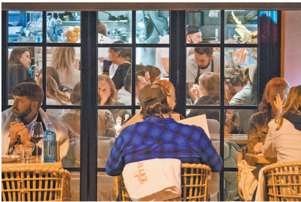
А так выглядят Патрики глазами рестораторов. В самом деле, зачем потребителям рома идти с пивком на пруд?

компания и затевают громкие беседы прямо под окнами жильцов. А если уж кто-то подвезет еще выпивох на машине — гарантированный «концерт» по заявкам алкоголиков обеспечен.