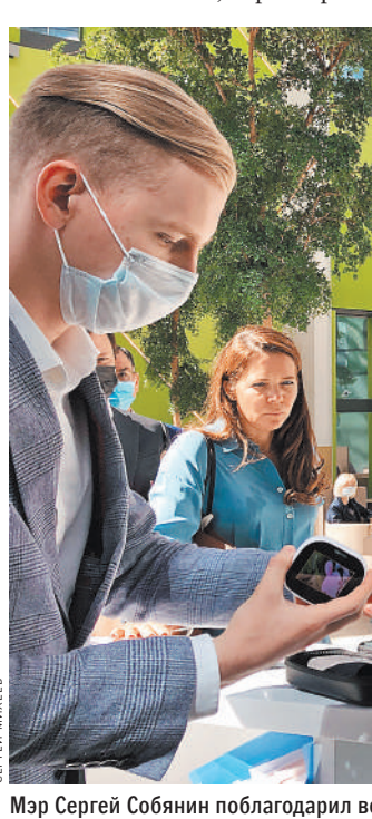
Мэр Сергей Собянин поблагодарил всех врачей за участие в борьбе с пандемией коронавируса.

Московский международный медицинский кластер «Сколково» продолжает развиваться. Вчера мэр Москвы осмотрел там строительство нового терапевтического корпуса старшей израильской клиники Hadassah.