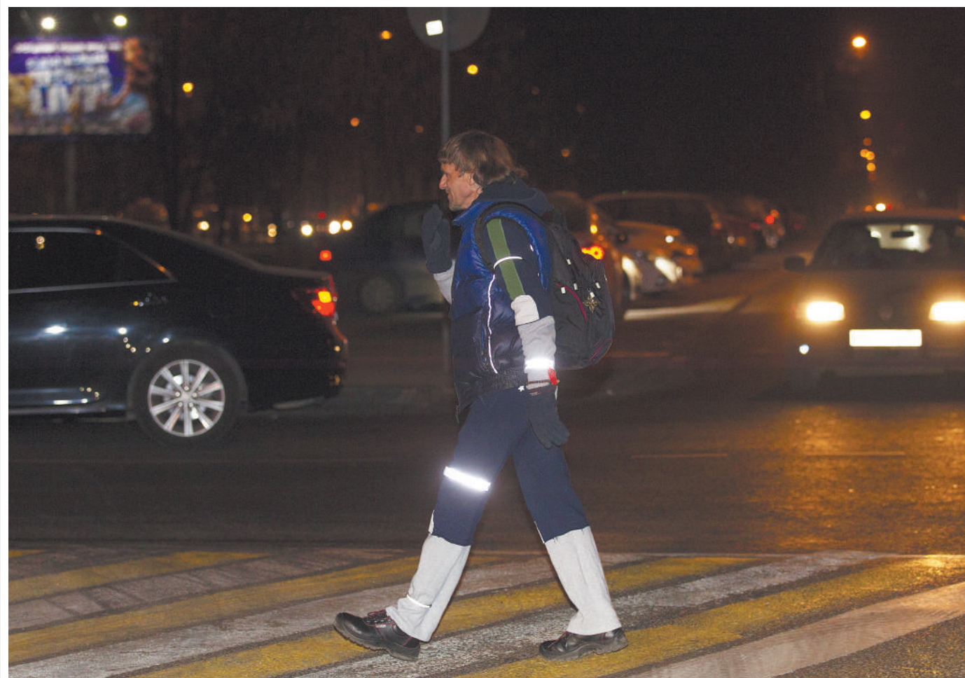
Сделаться заметнее на дороге может каждый, используя световозвращающие элементы на одежде.

По данным официальной статистики аварийности, каждый третий наезд на пешехода происходит в темное время суток. Но в прошлом полугодии расклад изменился. Если в целом число наездов и погибших в них людей значительно снизи-