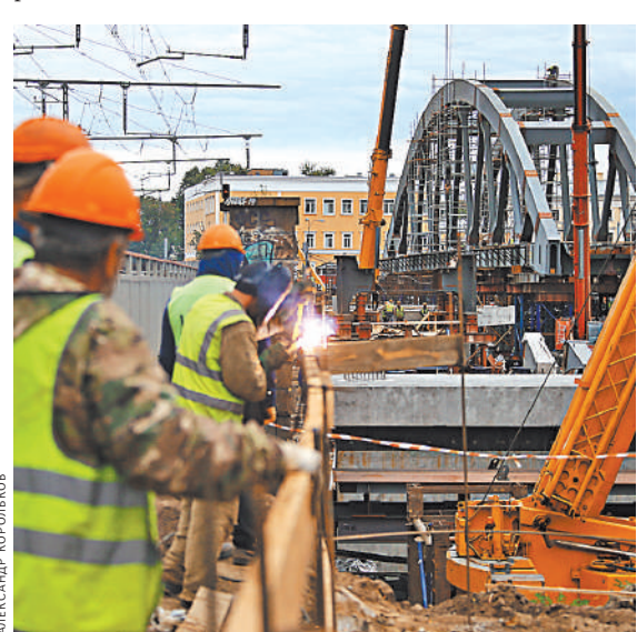
Реконструкция путей позволит сократить интервалы на втором диаметре и подготовит запуск МЦД-4.

Реконструкция в районе площади трех вокзалов, которая позволит сократить интервалы движения поездов на МЦД-2 и запустить МЦД-4, идет с начала этого года.