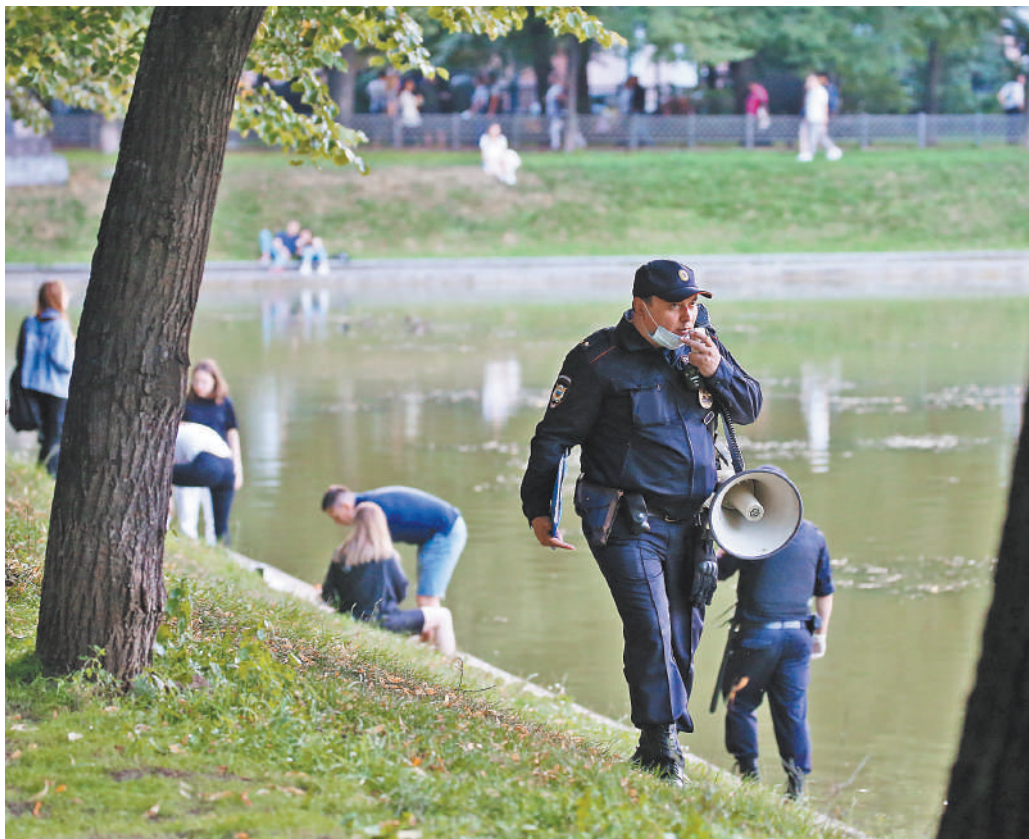
19.30. Гостей Патриарших какая-то воландовская сила тянет с лавочек к воде. Патруль проводит «зачистку».