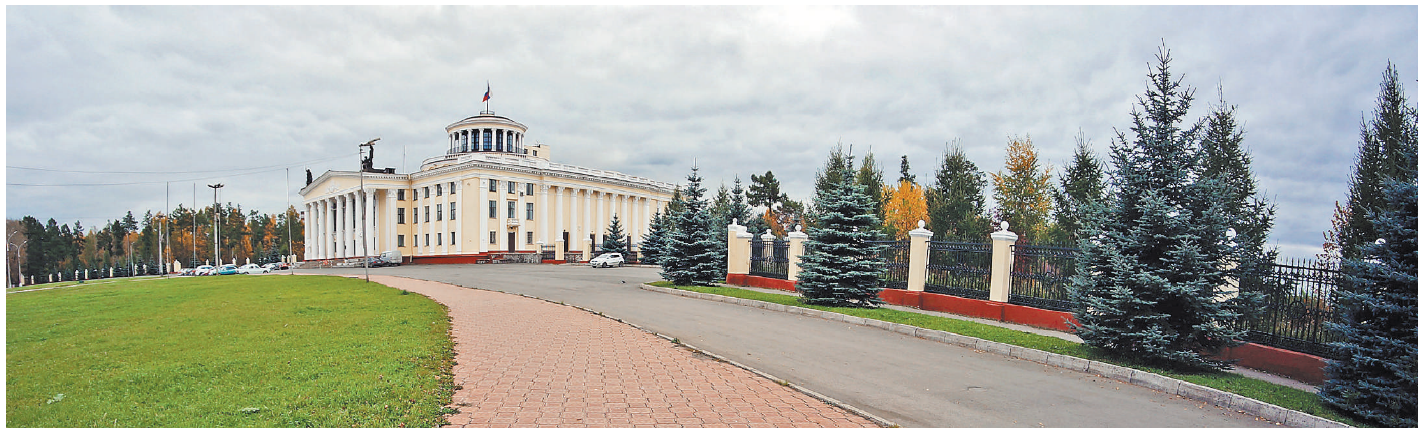
И Дворец культуры металлургов в Нижнем Тагиле тоже «придумал» Палладио.

лантливым хореографом. А я, помимо уроков вальса и мотива песни, хорошенько усвоил еще мотивы, по которым наши родители сражались с немцами на фронтах недавней войны. Удивительно, но там не было ничего ни про Родину, ни про Сталина. Там были куда более простые, обиденные и оттого убедительные и понятные слова: «Так что ж, друзья, коль наш черед, / Да будет сталь крепка! / Пусть наше сердце не замрет, / Не задрожит рука. / Настал черед, пришла пора, / Идем, друзья, идем. / За все, чем жили мы вчера, / За все, что завтра ждем». В сущности, они сражались за то, чтобы продолжать жить так, как они привыкли и как им хотелось. И если бы мне пришлось воевать с фашистами, то и я скорей всего воевал бы за наш дом, за маму с папой, за наш двор, за наши сказочные приключения во Дворце культуры, за вальс на паркете круглого зала, гениально придуманного далеким архитектором Андреа Палладио. ●