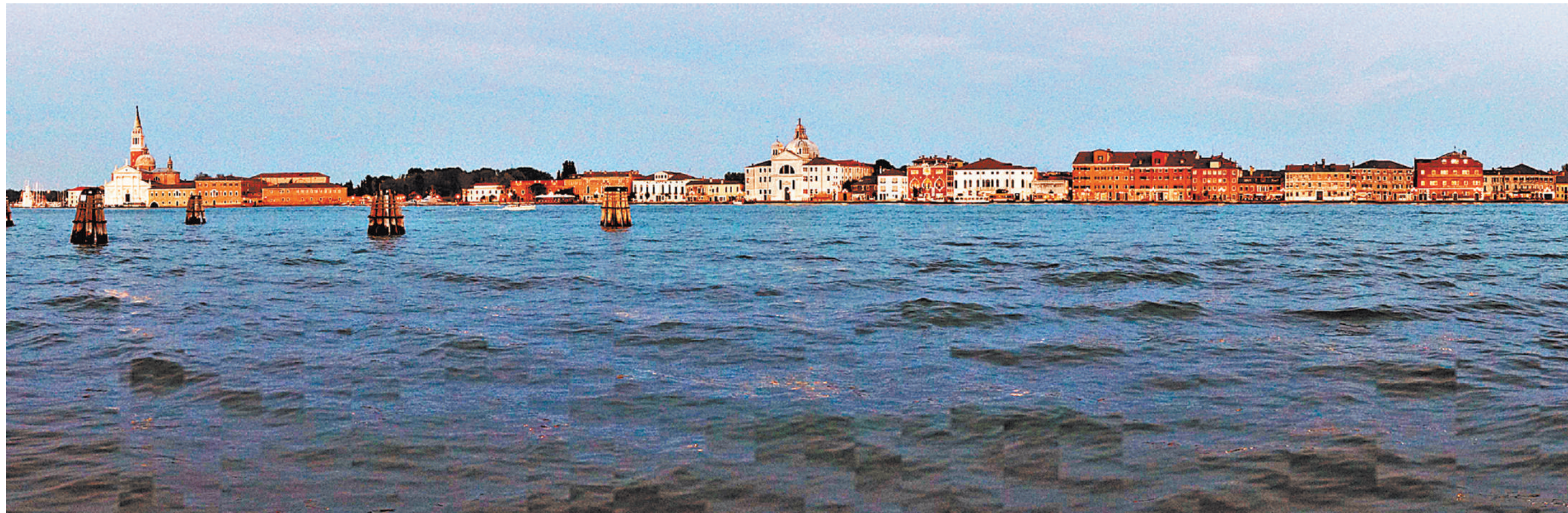
На венецианском проливе Джудекка сразу две церкви Палладио: Сан-Джорджо Маджоре и Реденторе.