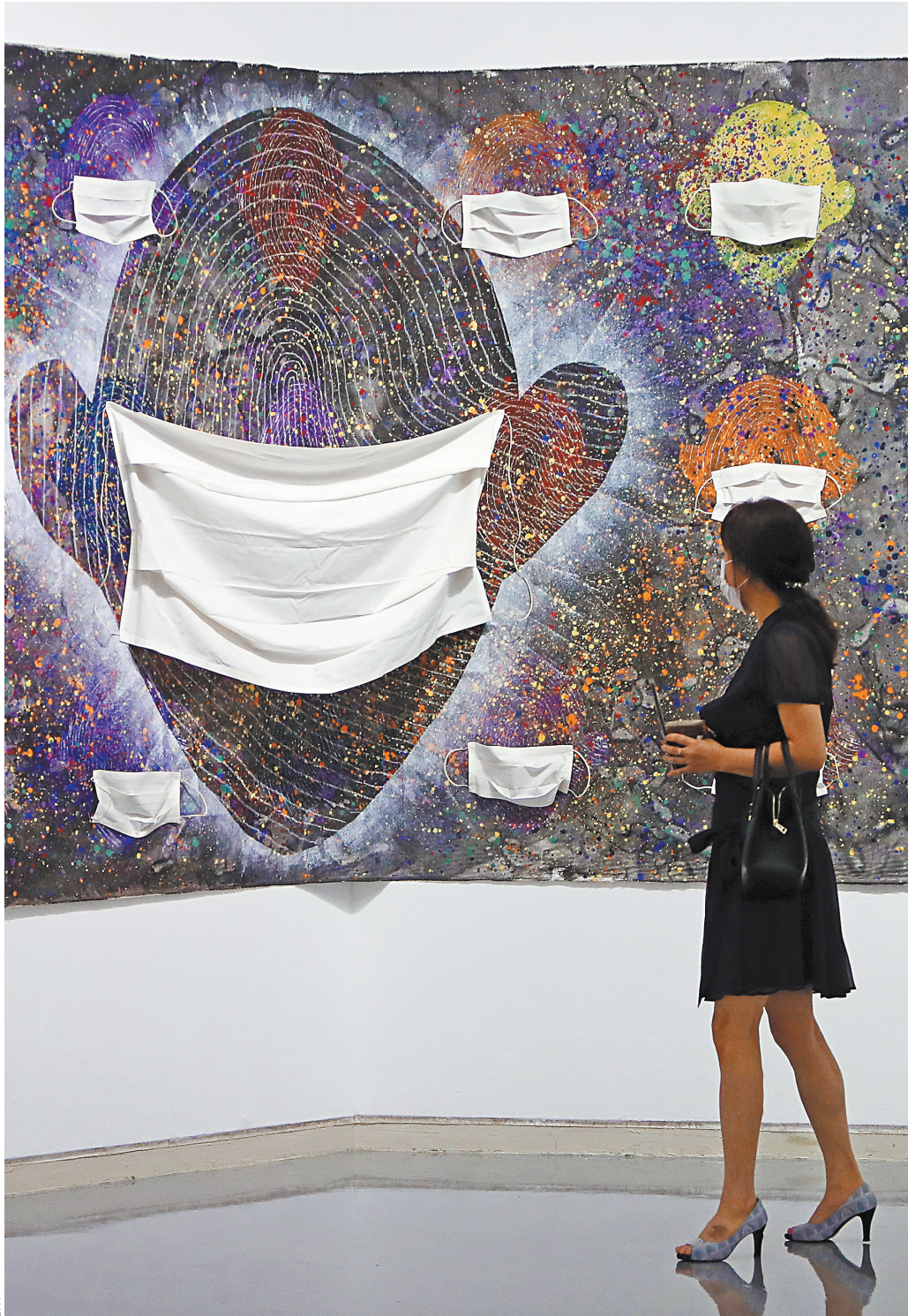
Маска превратилась в атрибут повседневности и арт-объект. На фото — выставка пандемии в Тагу, Южная Корея.