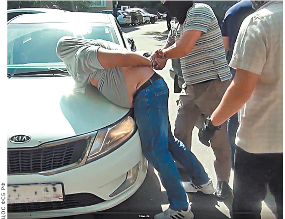
Гражданин России, подозреваемых в похищении ополченца, сотрудники ФСБ задержали на месте преступления.