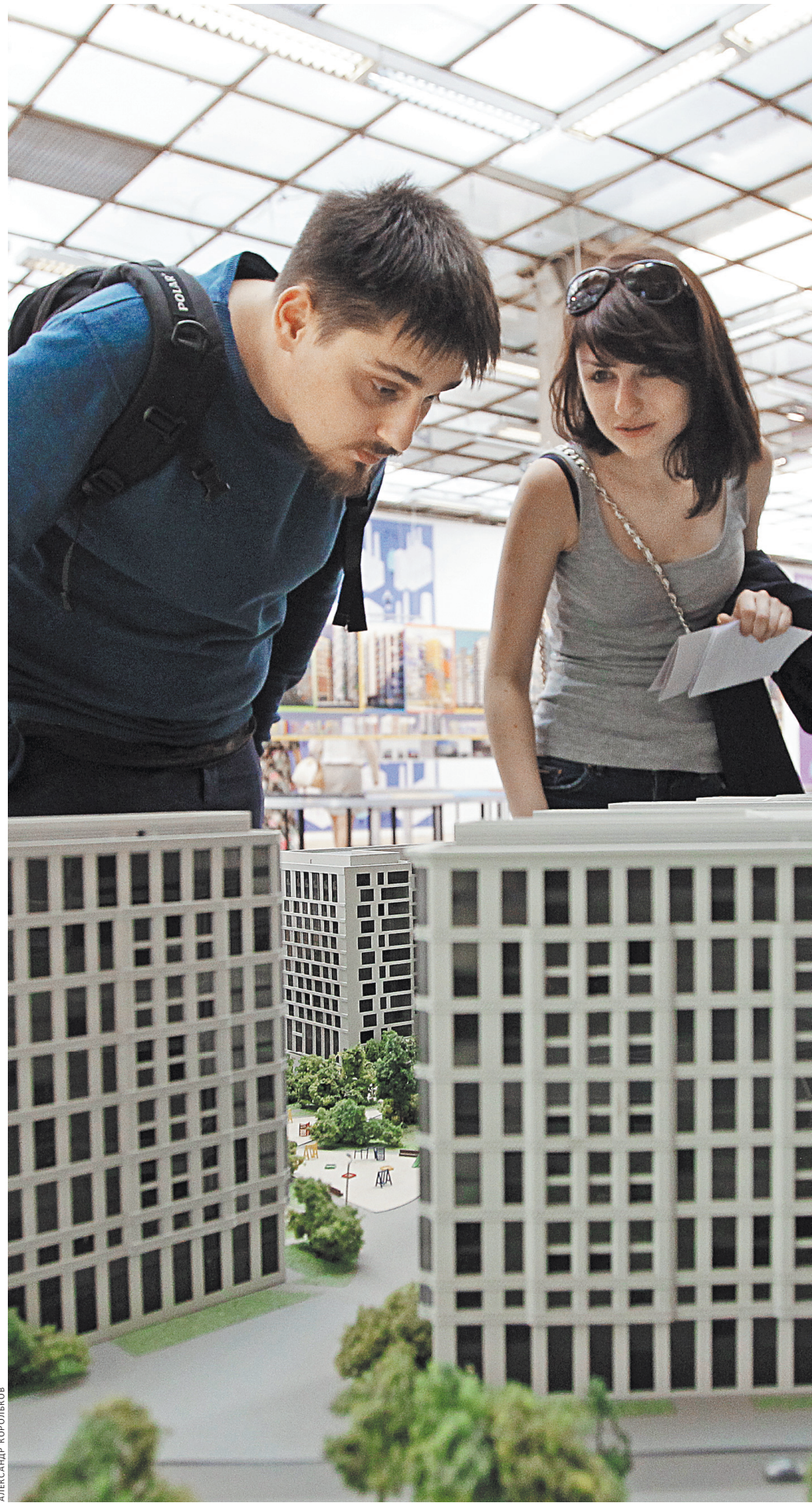
В России сдаются 9 процентов квартир, в развитых странах доходит и до 40 процентов.

лашников напомнил, что существует норма, по которой, если человек снимает жилье на 11 месяцев — то есть неполный год или меньше, то он не обязан об этом сообщать в налоговые органы. Большинство людей этим пользуются, заключают договор с арендатором на 11 месяцев и потом его перезаключают. «Никакие налоги при этом человек государству не платит, хотя сдает жилье годами и десятилетиями», — отмечает он. У «ДОМ.РФ» есть своя программа развития рынка арендного жилья. «Сегодня около 26 млн семей хотят улучшить свои жилищные условия. Из них около 6 млн готовы рассматривать аренду как инструмент решения жилищного вопроса. Для нас важно развивать цивилизованный рынок аренды, сделать правила более прозрачными. У