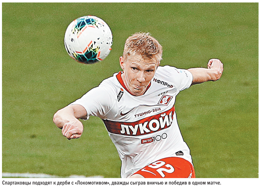
Спартакотцы подходят к дерби с «Локомотивом», дважды сыграв ничью и победив в одном матче.

Если же отвлечься от личных моментов, у России до сих пор было четыре чемпиона в Bellator. Заполучить пятого — весьма почетно. Но добыть пояс будет нелегко. Все-таки Бейдер — второй номер рейтинга в полутяжелом весе по версии авторитетнейшего статистического сайта Fightmatrix, и букмекеры предсказуемо считают его фаворитом боя. Однако у Немкова, пятого номера рейтинга, есть свои козыри. Один из них возраст со всеми вытекающими: россиянину всего 28 лет, в то время как Бейдеру солидные 37. ●