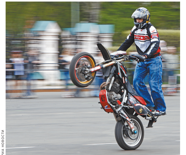
Даже высокие штрафы не заставят мотоциклистов не рычать под окнами. Все дело в воспитании.

Увеличить ответственность мотоциклистов за слишком шумный байк предложил зампред комитета нижней палаты парламента по экологии и охране окружающей среды Михаил Старшинов. Идея — увеличить штраф с сегодняшних 500 рублей до 5 тысяч. По его мнению, нынешняя санкция да еще с возможностью заплатить половину суммы неэффективна. «Купил гражданин себе Harley-Davidson за 30 тысяч долларов — он может себе позволить заплатить 250 рублей штрафа, он их и не чувствует. Ощутимо, когда ему инспектор выпишет штраф не 500 рублей, а 5 тысяч», — цитирует Михаил Старшинов РИА Новости. Действительно, некоторые недобросовестные мотоциклисты устанавливают на свою технику прямоточные глушители, которые двигатель не глушат вовсе. Но за такое усовершенствование можно полатиться не только штрафом за повышенную шумность, но и за внесение изменений в конструкцию. А это может грозить прекращением регистрации — довольно серьезное наказание.