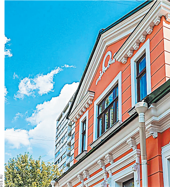
Усадьба Матвеевых, построенная в 1830 году, восстановлена по городской программе «Рубль за метр».

Всего по программе «Рубль за квадратный метр», действующей в столице с 2012 года, восстановлено 19 зданий, а еще в семи работы продолжают вестись. Инвесторы, вкладывающие средства в реставрацию, после восстановления разрушенных памятников, получают их в аренду на 49 лет. Но возродить их они должны не более чем за пять лет.