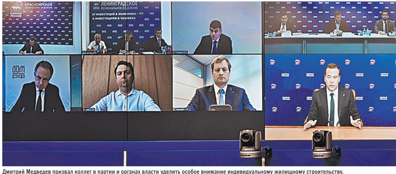
Дмитрий Медведев призвал коллег в партии и органах власти уделить особое внимание индивидуальному жилищному строительству.

может появиться до 30 млн кв. метров доступного арендного жилья. В ведомстве рассчитывают, что снять подобное жилье смогут 714 тысяч семей. Медведев призвал особое внимание уделить индивидуальному жилищному строительству. Это также помогло бы достичь целевых показателей по обеспечению граждан жильем. Он напомнил, что исходя из целей, поставленных президентом, в 2020–2030 годах должно быть построено около 1,1 млрд кв. м жилья. Председатель партии призвал при этом не допустить «гонки за квадратными метрами» в ущерб качеству жилья. Отдельно Медведев отметил, что строить частные дома необходимо, только обеспечив безопасность средств граждан. «Речь идет о различных льготных ипотечных программах, механизмах господдержки. По-