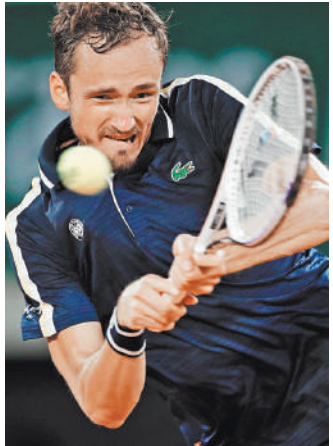
Даниил Медведеву удалось взять под контроль игру на грунтовых кортах. И это добавляет ему положительных эмоций.

— Было расстройство из-за самого себя. Сыграл один ужасный гейм на подаче, из-за этого проиграл сет, — цитирует Медведева Eurosport. — Но я уже все-таки опытный, знаю, что нужно продолжать играть. Я чувствовал, что по игре давлению на него, надо было просто чуть больше попадать с приема, чуть глубже играть. Это сразу получилось сделать во втором сете. Потом я держал матч под своим контролем, и это, естественно, добавляет хороших эмоций.