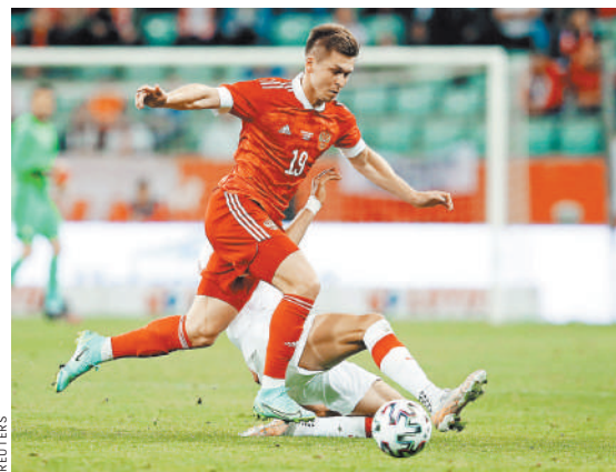
На неделе российская сборная провела контрольный поединок в гостях с Польшей, который завершился ничьей, 1:1.

МАГОМЕД ОЗДОЕВ: Нет, при Станиславе Саламовиче всегда все серьезно. Каждый игрок понимает, зачем он приехал и к чему готовится. ●