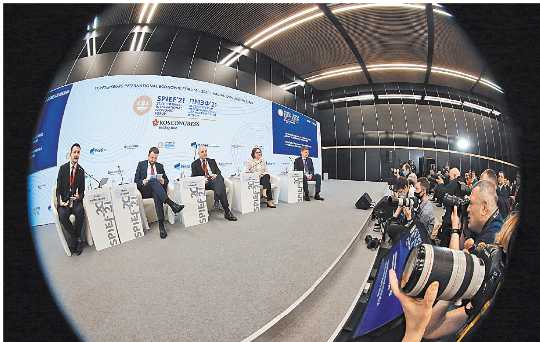
Антон Силуанов: «Мы с Эльвирой (Набиуллиной) ходим парой, можно так сказать... Успех выхода из таких сложных ситуаций — в тесной координации всех денежных властей. Минфин и Центральный банк прекрасно это понимают и синхронизируют детали свои действия в области монетарной и бюджетной политики».

При этом вся система контрольно-надзорной деятельности России будет базироваться на риск-ориентированном подходе. Согласно ему, будет введено шесть категорий риска возможного причинения вреда — от низкого до чрезвычайно высокого. И например, при категории низкого риска проверки того объекта могут не проводиться несколько лет. ●