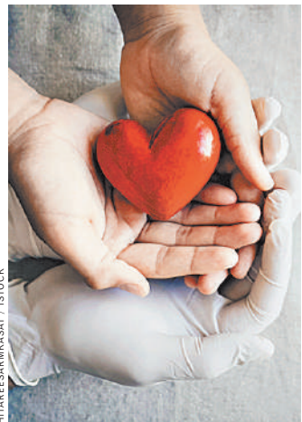
Искусственный левый желудочек, как мотор, помогает ритмичной работе сердца.