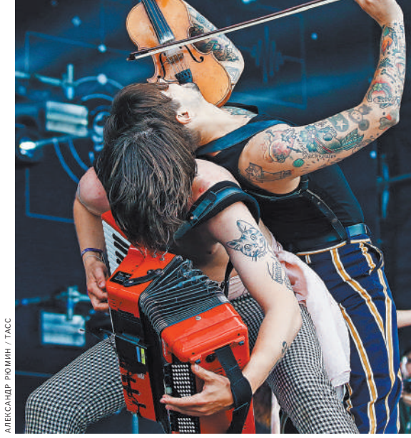
Концерты The Hatters — это и песни, и театр, и скороморшничество, и лихая акробатика.

В моем случае сейчас новых подвижек нет. Я участвую в старых постановках, которые были сделаны до успехов «Шляпников». Супруга моя, тем не менее, успела поставить свой моноспектакль Bathroom.