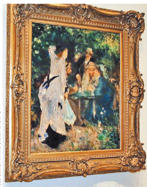
Около 200 произведений из коллекций братьев Морозовых заняли четыре этажа выставки в Булонском лесу в Париже.