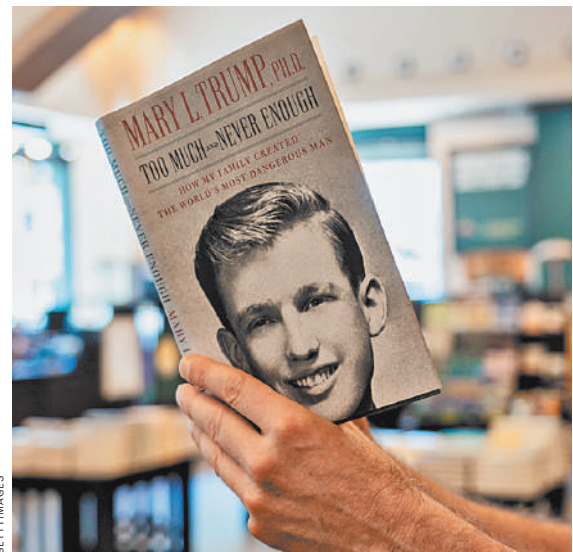
Разгромная книга Мэри Трамп о своем дяде Дональде — «самом опасном человеке в мире» — в 2020 году стала бестселлером.