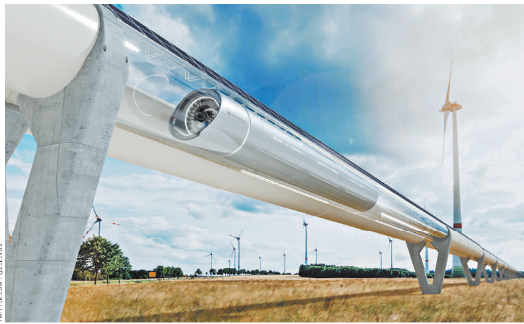
Так выглядит макет «железной дороги будущего» с поездом-капсулой Hyperloop, «левитирующим» над землей.