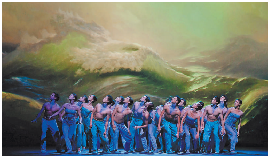
Первая после карантина премьера Большого театра — «Четыре персонажа в поисках сюжета», стала сенсацией в балетном мире. «Девятый вал» в постановке Брайана Арнаса из США.

Премьеры нового сезона: «Мадалена», «Испанский час» (29 октября), «Дон Жуан» (3 ноября), «Мастер и Маргарита» (мировая премьера, 1 декабря), «Лоэнгрин» (24 февраля), «Фальстаф, или Три шутки» (10 марта), «Искусство фуги» (мировая премьера, 7 апреля), «Линда ди Шамуни» (9 июня), «Хованщина» (22 июня), «Танцевания» (мировая премьера, 7 июля).