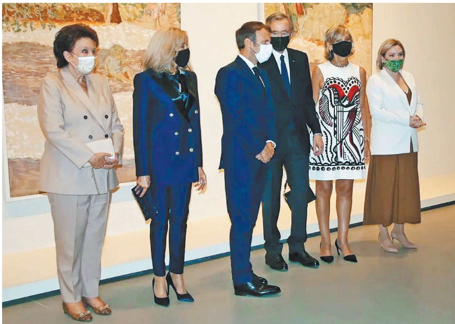
На открытии выставки в Фонде Louis Vuitton выступили президент Франции Эмманюэль Макрон, министр культуры России Ольга Любимова, глава группы компаний LVMH Бернар Арно.

Отчасти эту московскую удалую купеческую жилку демонстрирует история про покупку четырех картин Гогена.