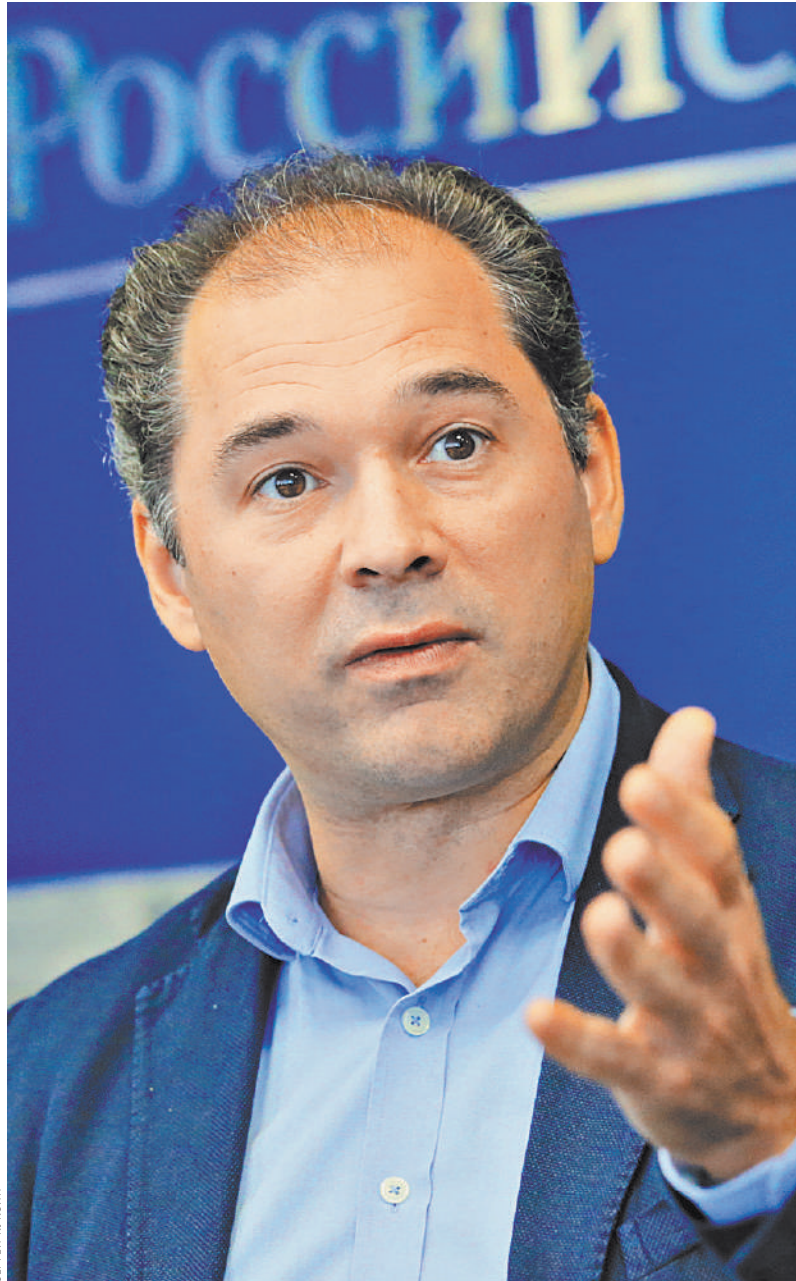
Туган Сохиев: Мы — театр, построивший свою историю на русской опере. Но сегодня у нас огромный мировой репертуар. Пытаемся сохранить баланс.