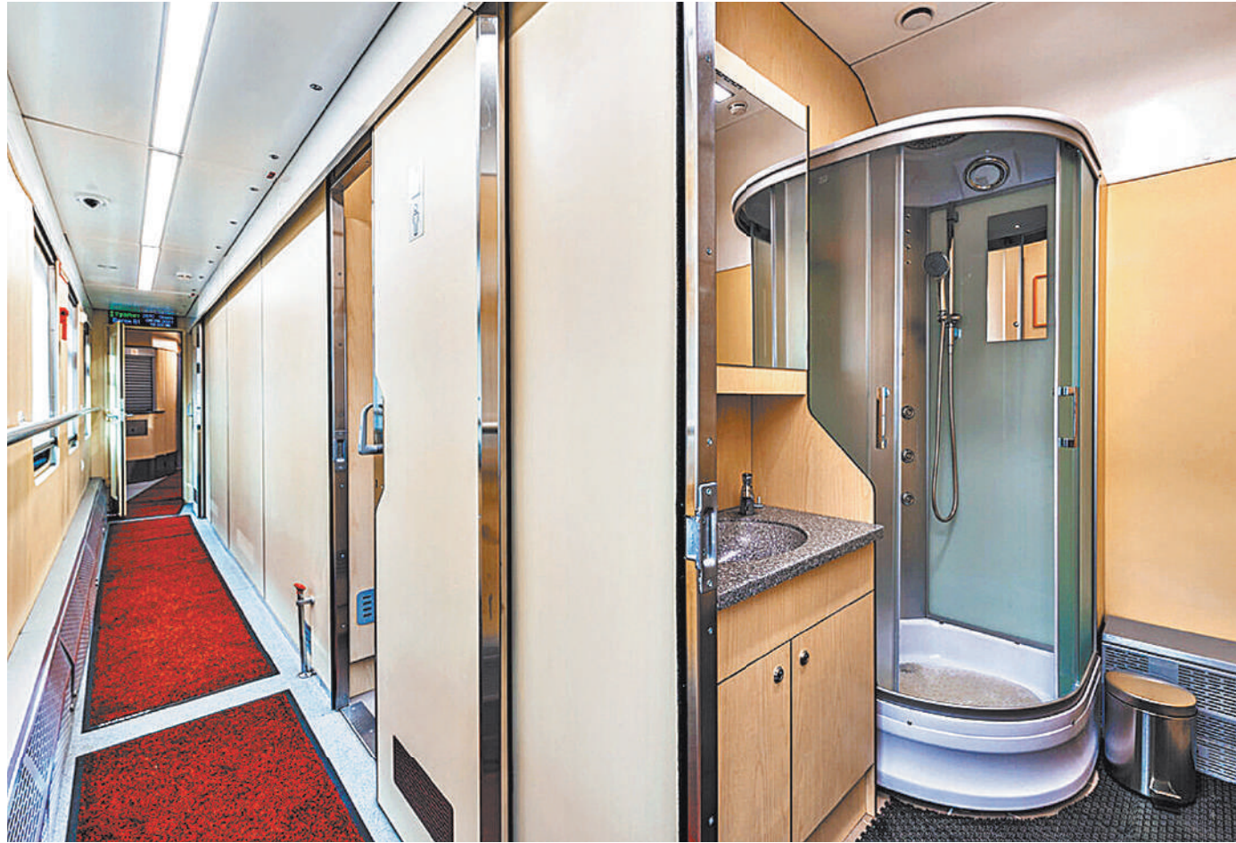
Путешествие для пассажиров дальних поездов становится комфортнее.

В Тамбове начали оснащать душевыми кабинками и обычные вагоны, но пока в небольших объемах. Да и представьте, сколько придется ждать своей очереди в единственный душ пассажиру, к примеру, плацкарта до Хабаровска. А школьный поезд «Большая перемена» помимо спа оборудован и конференц-залом на колесах. Один из вагонов, во всю длину которого установлен стол со стульями, предназначен для лекций, мастер-классов и общения. В других вагонах есть помещения для игр и творчества. ●