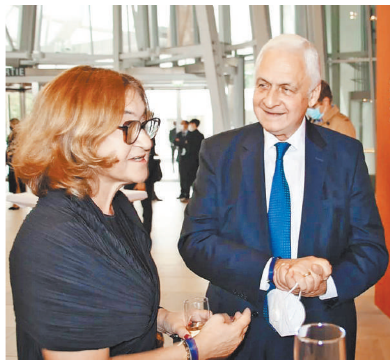
Третьяковская галерея привезла на выставку 34 произведения из коллекций братьев Морозовых.

Первым общим проектом Фонда Louis Vuitton с Эрмитажем и ГМИИ имени А.С. Пушкина был музейный блокбастер «Шедевры нового искусства. Коллекция Сергея Щукина» (2016). Он стал ярким событием европейской художественной жизни. Выставку посетили 1,3 млн человек. Куратором проекта, как и нынешней выставки, была Анна Балдессари. Успех проекта выглядел тем более невероятным, что французам привезли французское искусство. Из России. Отнюдь не в первый раз. Но впервые на первый план тогда была выдвинута фигура коллекционера — Сергея Ивановича Щукина. Второй проект, посвященный коллекциям братьев Михаила и Ивана Морозовых, должен был открыться в Фонде Louis Vuitton в 2020 году, вскоре после выставки в Эрмитаже. Та выставка 2019 года объединила 111 произведений из коллекции Эрмитажа и 30 картин из ГМИИ имени А.С. Пушкина. Коллекция Морозовых была поделена между Эрмитажем и ГМИИ им. А.С. Пушкина после уничтожения в 1948 году Государственного музея нового западного искусства (ГМНЗИ).