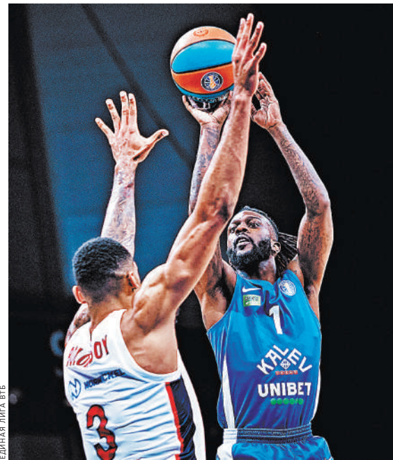
Баскетболисты «Калева» (справа) обыграли ЦСКА на своей площадке впервые за 30 лет.