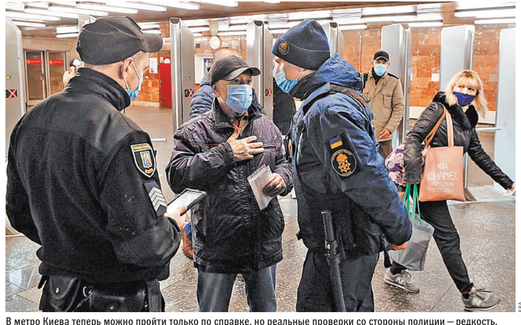
В метро Киева теперь можно пройти только по справке, но реальные проверки со стороны полиции — редкость.

В каждом случае причины ухода называются разные — неудовлетворительные результаты работы, коррупционные скандалы, личная конфликтность и даже недостаток публичности. Отставками Зеленский решает несколько задач: демонстрация власти, расстановка своих людей на стратегических направлениях, наказание не оправдавших надежд. В итоге все сводится к попытке остановить падение рейтинга переставкой министров.