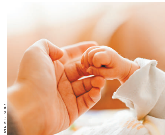
Ладошка ребенка в надежных руках мамы. Ничего важнее на свете нет...