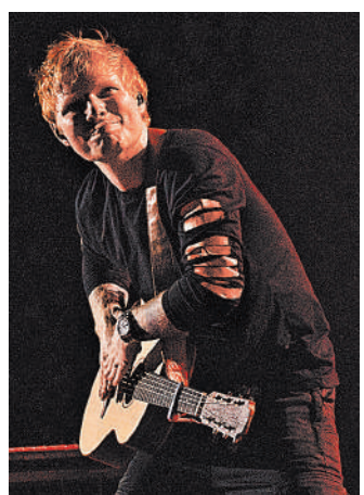
Главное в песнях Эда Ширана — жизнерадостность и душевность. В пандемию они особенно ценятся.

Поэтому премьера получилась очень разной: от привычных для Ширана баллад и голубозападного соула (принесших ему славу самого успешного в мире певца, гастроли которого продолжались по два года) до электронного new wave, по-прежнему в ностальгию 80-х. Именно танцевальные биты и атмосферные тембы, продолжающие идеи, эстетику, а порой и нарратикой Bronski Beat, Марка Алмонда и Visage в первую очередь и позволили диску