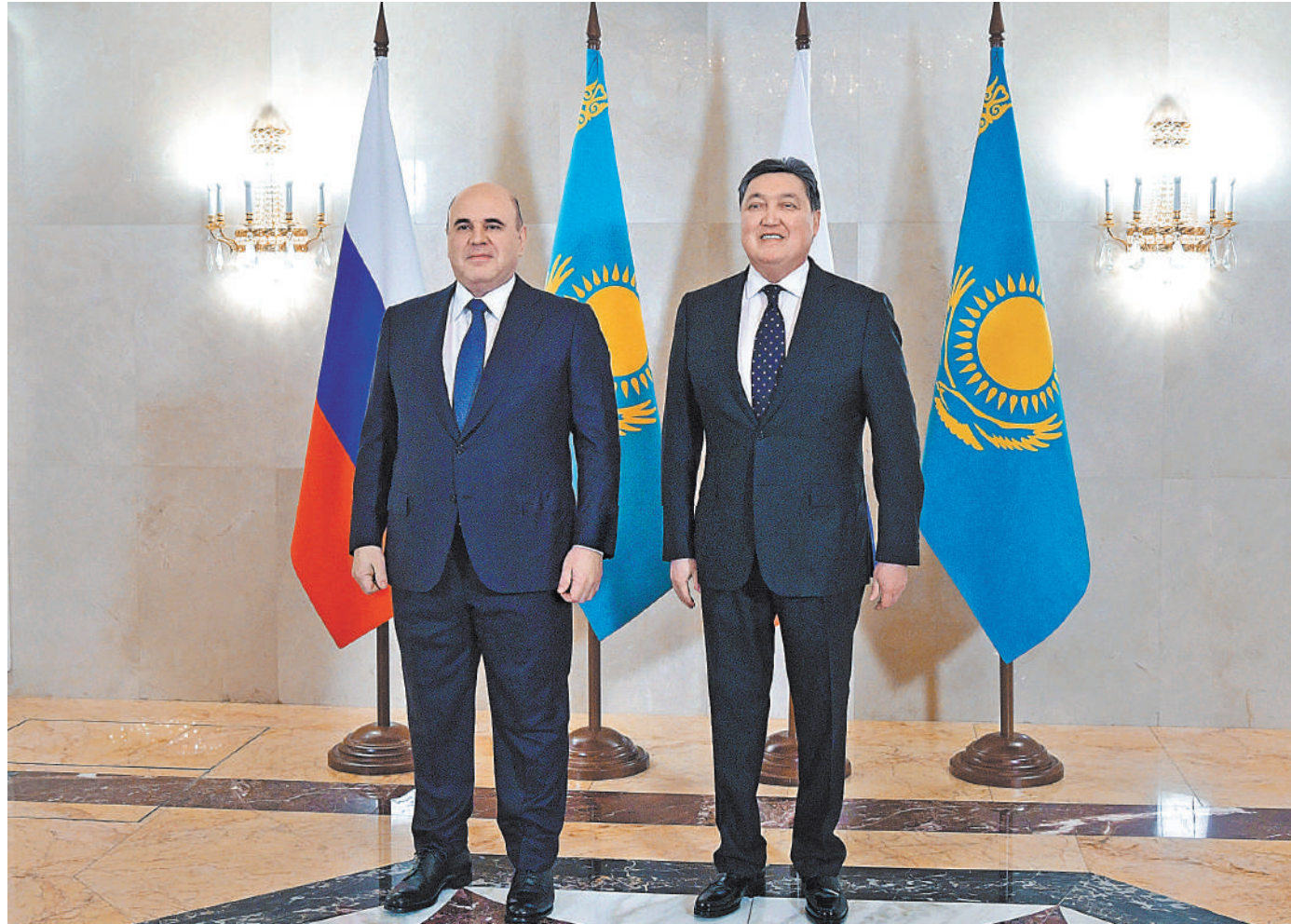
Михаил Мишустин и Аскар Мамин во время встречи в Доме правительства РФ.

«Мы искренне дорожим дружбой с братским казахстанским народом, нашими отношениями, партнерством, — заверил российский премьер своего коллегу. — Наши страны связывают особые, братские, дружественные многолетние отношения. Наша двусторонняя повестка очень содержательна, есть много возможностей для конструктивной работы, для продолжения новых проектов, новых идей, их реализации».