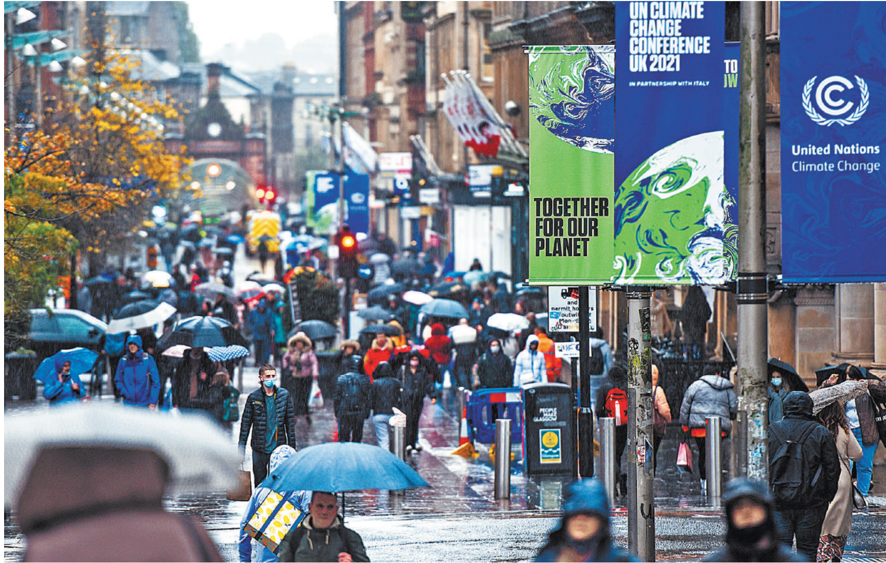
Хотя баннеры в Глазго по случаю конференции призывают работать «Вместе для нашей планеты», на деле под знаменами экологии нередко продвигаются конкретные интересы отдельных стран.

Несмотря на попытки Джонсона взбудоражить участников, президент США Джо Байден, видимо, заскучал и, как заметили американские СМИ, даже задремал прямо в зале заседаний. Когда слово, наконец, передали ему, Байден «зашел с козырей», пообещав серьезно сократить выбросы парниковых газов. Журналисты не упустили возможности отметить, что при этом Байден прибил на саммит с кортежем из нескольких десятков автомобилей, отнюдь не малолитражек. Обязательства сократить выбросы