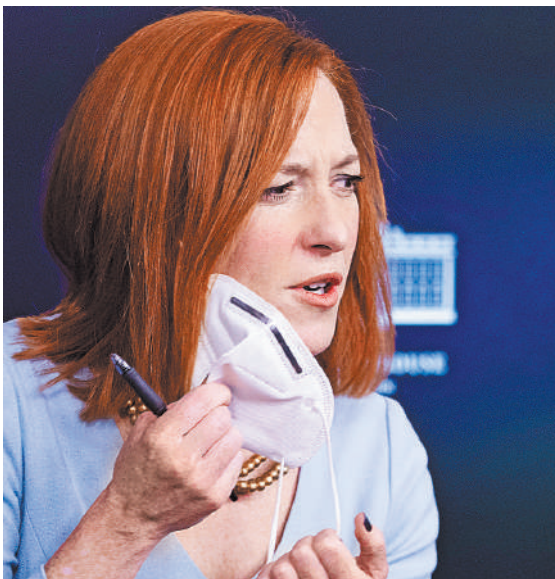
Пресс-секретарь президента США Джен Псаки подхватила ковид и временно уступил свой подиум в Белом доме.

Пресс-секретарь Белого дома Джен Псаки заразилась коронавирусом и по этой причине не полетела с президентом Джоозефом Байденом в Рим на саммит «Группы двадцати», состоявшийся в конце прошлой недели. Псаки, которая ранее привилась от ковида, рассказывает, что испытывает легкие симптомы COVID-19 и «работает из дома».