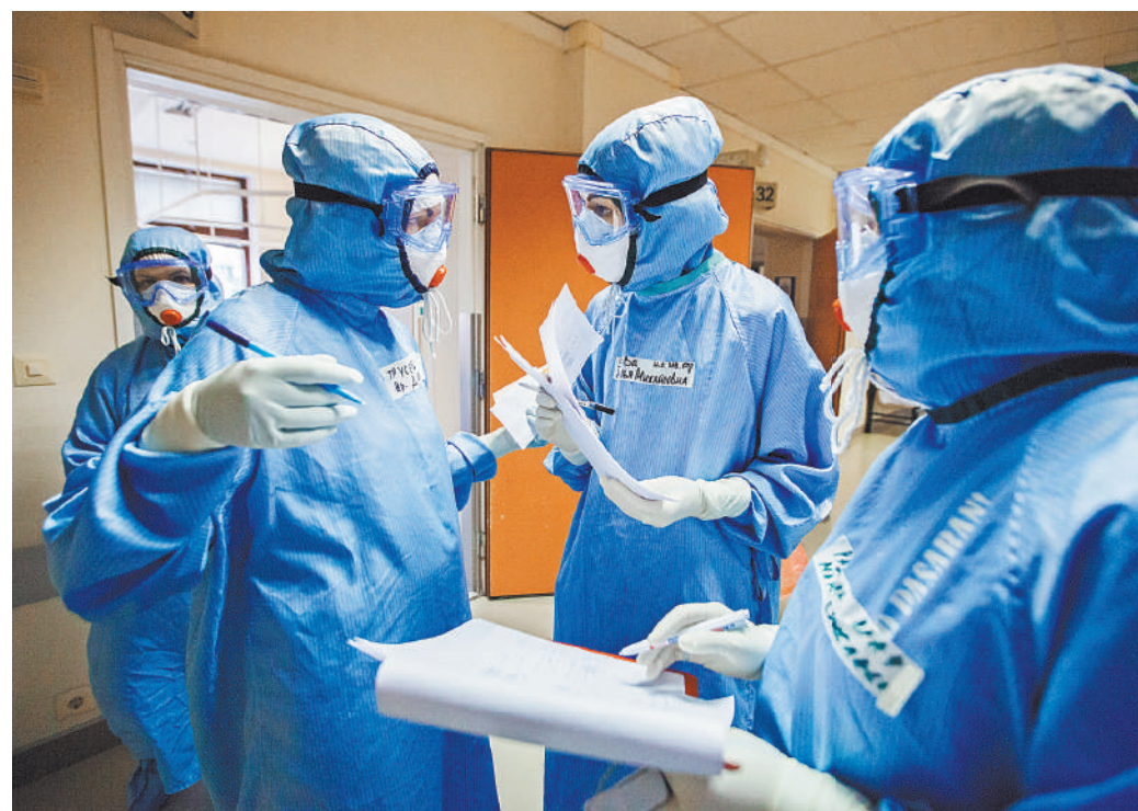
И в «красной зоне» необходим консилиум специалистов.

Будем надеяться, что наш пациент поправится, а наши читатели сделают для себя определенные выводы. ●