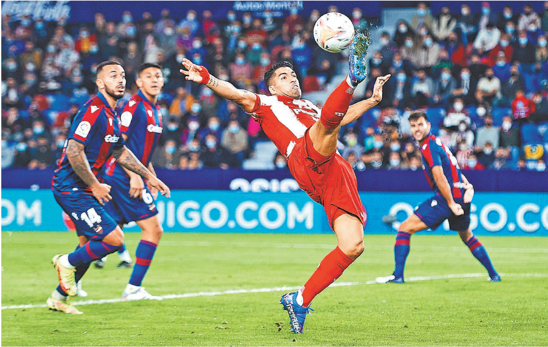
В первом матче «Атлетико» и «Ливерпуля» в Мадриде хозяева проиграли 2:3, пропустив третий мяч в меньшинстве.

В последних восьми матчах Суарес забил шесть мячей, причем в двух случаях голы уругвайца принесли «Атлетико» четыре очка: речь о дубле в ворота «Хетафе» (2:1) и «Реал Сосьедада» (2:2). Безусловно, встреча на «Энфилде» — особенная для Луиса. Именно на Туманном Альбионе он стал звездой мирового уровня, хоть и не завоевал с «Ливерпулем» (2011–2014) ни одного трофея. К слову, Суарес уже играл против «красных» в составе другой команды. Было это в полуфинале Лиги чемпионов сезона 2018/19, когда «Барселона» сначала разгромила дома «мерсисайдцев» 3:0, после чего оконфузилась в гостях, пропустив четыре безответных мяча (0:4), и осталась без финала главного еврокубка.