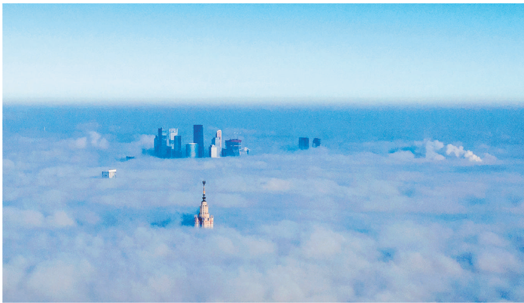
Плотный туман накрыл Москву в ночь на 2 ноября и парализовал воздушное движение.