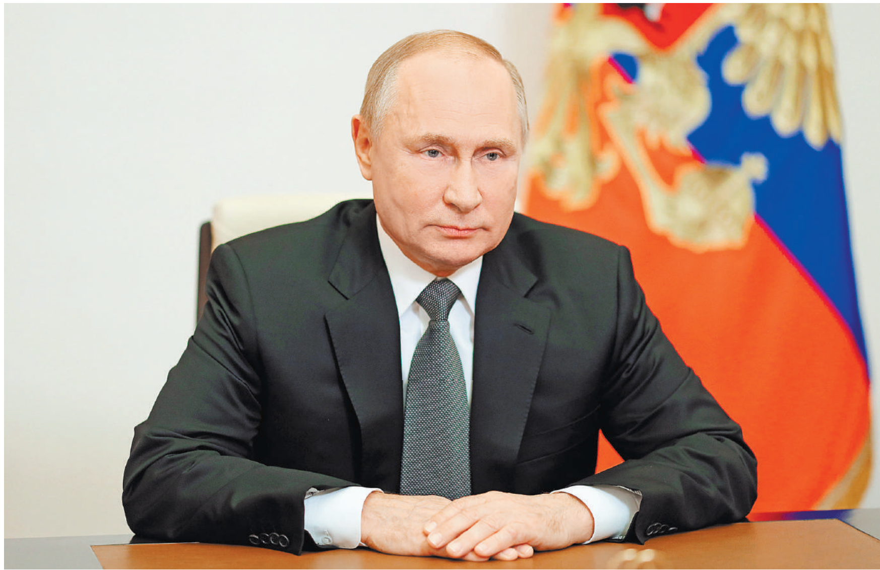
Владимир Путин: Россия поддерживает подготовленную к конференции в Глазго декларацию по лесам.