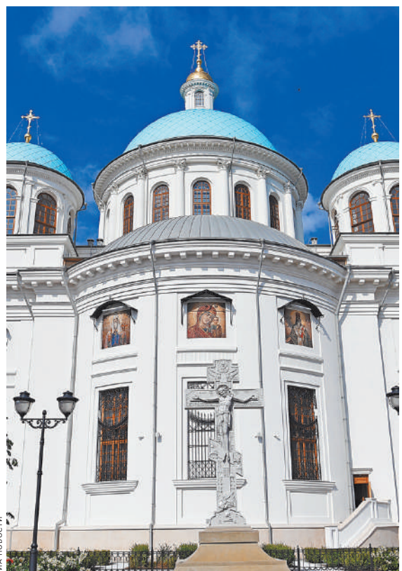
Воссозданный с уникальной достоверностью и освященный Патриархом в 2021 году собор Казанской иконы Божией Матери в Казани.

За семнадцать лет существования в нашем календаре Дня народного единства (4 ноября) мы слишком к нему привыкли и уже не задумываемся над тем, что праздник открывает нам не только глобальные законы развития общества, но и затрагивает болевые точки каждого из нас.