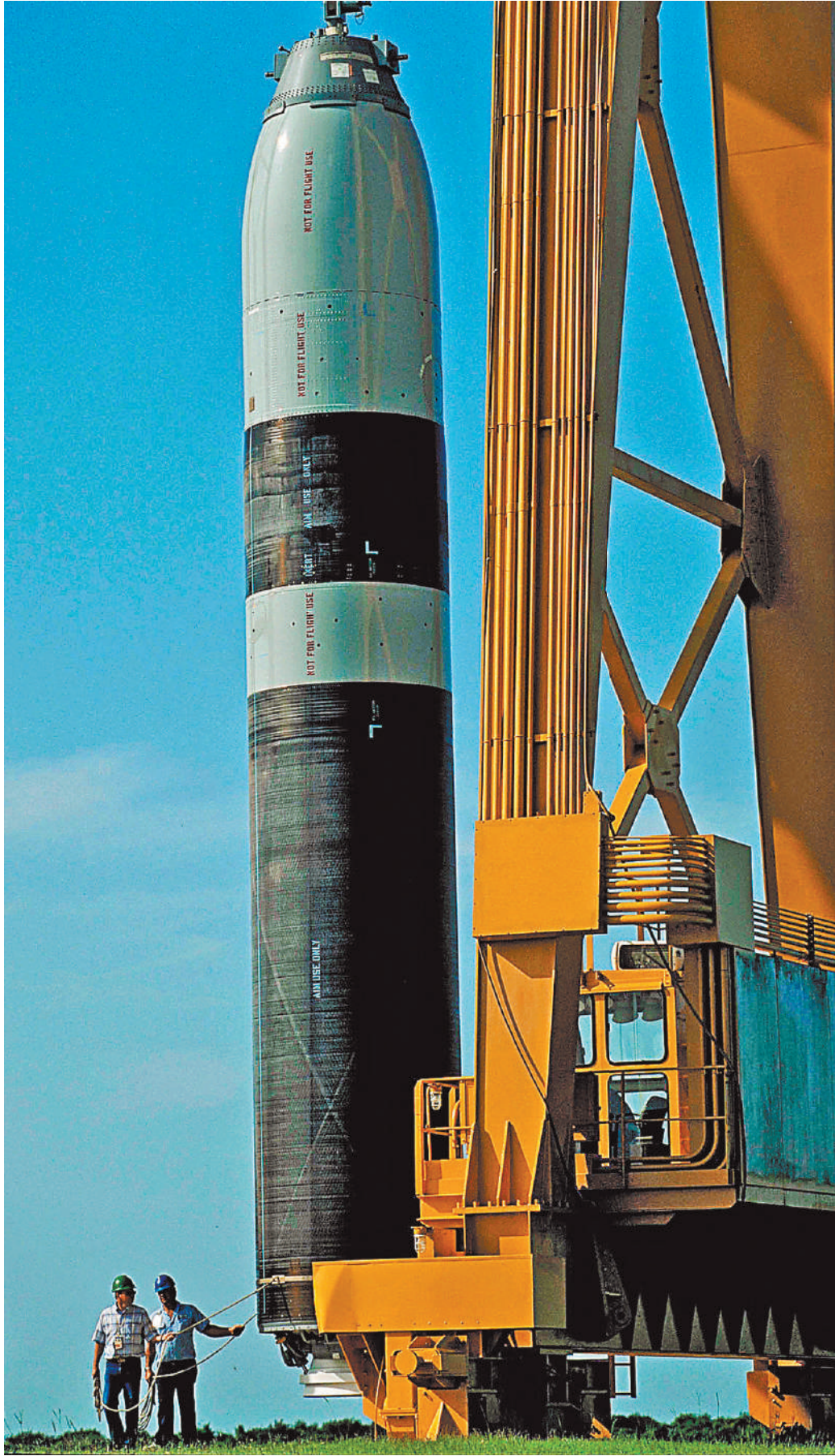
Эксперты считают, что модернизация боеголовок на этих баллистических ракетах подводных лодок «Трайдент II» должна увеличить их поражающую эффективность почти вдвое.

К этому, как сообщило на днях издание Financial Times, Вашингтон якобы призывает союзники США в Европе и на Тихом океане, которые, дескать, опасаются, что отказ Вашингтона от принципа упреждающего ядерного удара может «придать смелости» Москве и Пекину.