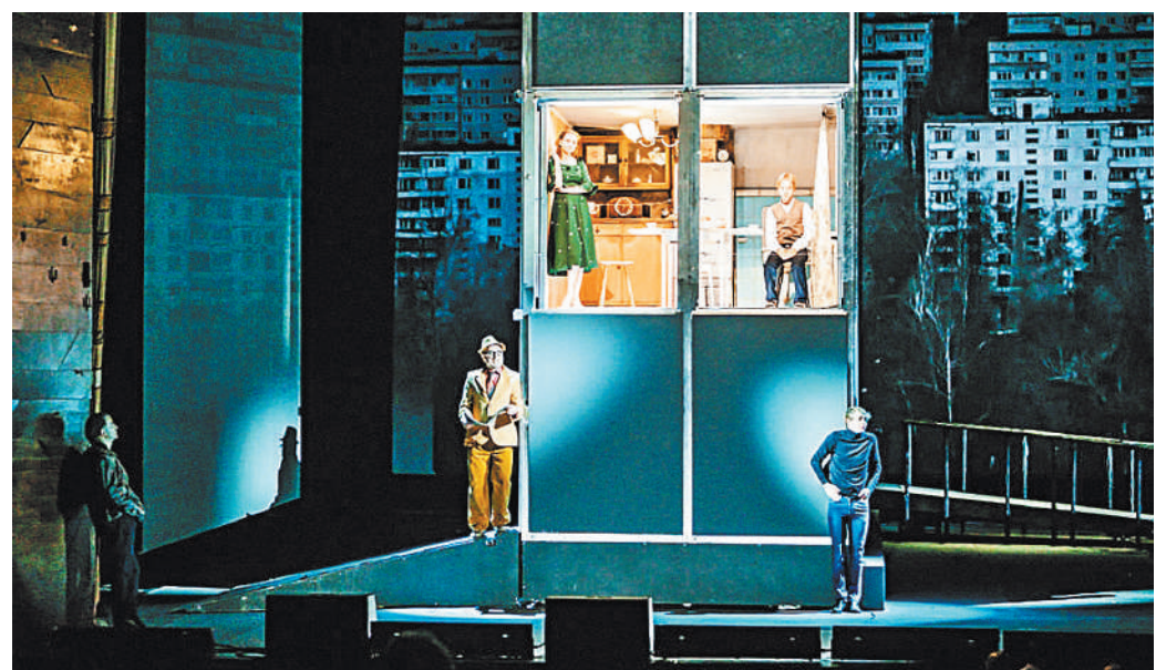
Останется ли при новом руководстве в репертуаре МХАТ им. Горького знаковый спектакль «Лавр»?

худрук театра «Школа современной пьесы»: — МХАТ прозябал несколько десятилетий под руководством выдающейся в прошлом актрисы Татьяны Васильевны Дорониной. Пришел Эдуард Бояков, человек неоднозначный, вызывающий споры и дискуссии, в том числе и творческого плана. Но он сделал театр живым, привлек к нему внимание, о МХАТе заговорили, туда стали отдавать свои пьесы замечательные драматурги и писатели — взять хотя бы Водолазкина, его «Лавр» закрывал прошлый сезон. Бояков умеет из разнородного делать целое.