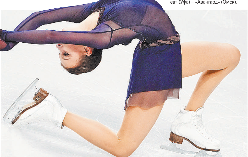
Наша действующая чемпионка мира Анна Щербакова — главный фаворит Гран-при Италии (5–6 ноября) в женском одиночном катании. Прямые трансляции — на Первом.

ХОККЕЙ Голкипер питерского СКА сыграл пять матчей на «ноль» в октябре