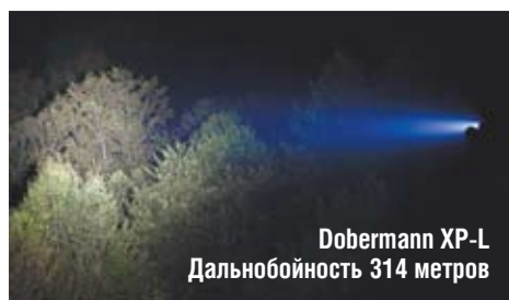
Dobermann XP-L Дальноточность 314 метров

Вживую разница впечатляет еще больше, причем яркость XPL HI диода меньше на 15-20%.