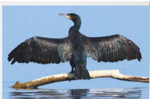
АСТРАХАНСКИЕ БУДНИ 4 стр.