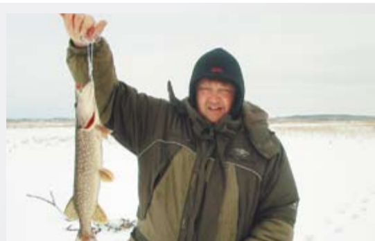
ВЕСТИ С ВОДОЁМОВ 7-8 стр.