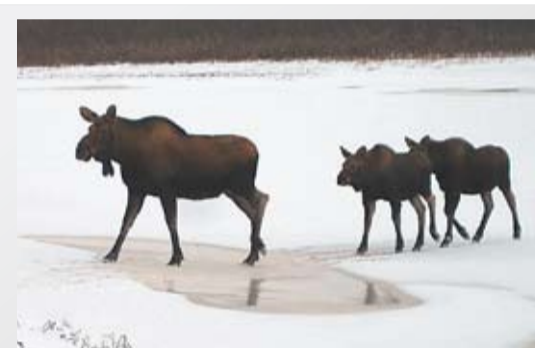
ЛОСИ- ЗАГОНЩИКИ 14 стр.