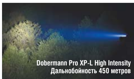
Dobermann Pro XP-L High Intensity Дальноточность 450 метров

К большому сожалению, такие дальноточники немного дороже обычных и найти их на рынке не так легко, как хотелось бы. Но хорошие вещи, к сожалению, всегда стоят недешево. Однако, несмотря на все это, Armytek успешно использует особый диод в серийном производстве. А теперь фонари дальнего действия со всеми фишками можно найти и у нас в России.