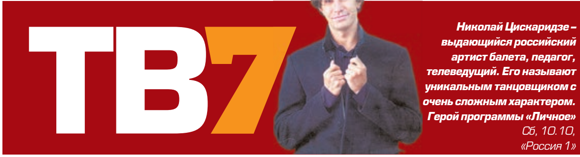
Николай Цискаридзе – выдающийся российский артист балета, педагог, телеведущий. Его называют уникальным танцовщиком с очень сложным характером. Герой программы «Личное» Сб, 10.10, «Россия 1»