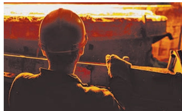
ФОТО ИЗ ОПЫТА РАБОТЫ РАБОТНИКОВ

Вот лишь несколько отрывков в ленте новостей за последние несколько дней. Цитирую. «Сегодня в нашей постоянной рубрике «Мы еще не совсем импотенты» – планетарная гидромурфта для самоходных путевых машин ПМГ для смазки клеммных и закладных болтов. Эти машины производят (о боже!!!) тоже российский завод – «Тихорец-