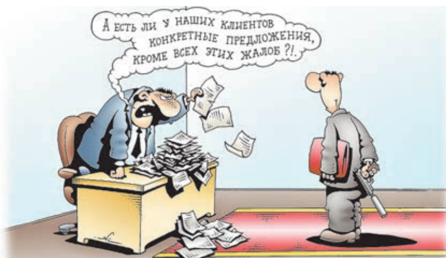
ИЛЛЮСТРАЦИЯ ИРИНЫ ИЮСАНОВИЧ

Вот, например, перевезла мне тут некая фирма «ГрузовичкоФ» из Москвы на дачу шкафа. Ну, как перевезла: машина опоздала на полтора часа, вместо водителя с грузчиком приехал один водитель, да и тот какой-то малахольный. Почему я так думаю? А просто вместо заказанного обертывания шкафа в защитную пленку он просто уложил его на пол «газели» и накрыл обрывками картона. Не все дороги у нас одинаково хороши. Поэтому по пути прилеглий шкаф немного поелозил по кузову, получил пару царапин, лишился одной дверцы – но доехал. Выпихивая его из машины, водитель протянул кусок (о, совсем небольшой) обличковки с сласковыми словами: «Возьмите – может, приклеить захотите». Всегда приятно иметь дело с человеком с юмором!