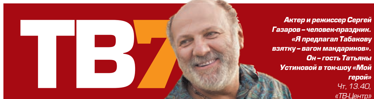
Актер и режиссер Сергей Газаров – человек-праздник. «Я предлагал Табакову взятку – вагон мандаринов». Он – гость Татьяны Устиновой в ток-шоу «Мой герой» Чт, 13.40, «ТВ-Центр»