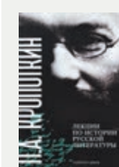
Петр Кропоткин «Лекции по истории русской литературы»

В сборнике литературных манифестов и стиховедческих эссе автор знаменитых «Нольмских рассказов» предстает с неожиданной стороны. Шаламов был активным участником литературных движений в 1920-х, включая самое авангардное объединение ЛЕФ (и потому заметен о нем из уст очевидца просто бесценны). Теории поэтической интонации и звуковых повторов пошли у него оттуда. «В искусстве существует закон «все или ничего». Есть стихи и не стихи», – поучает он начинающих поэтов с высоты своих 16 лагерных лет. Когда европейцы в лице Теодора Адорно заявили, что поэзия после Освенцима невозможна, он взялся за создание «новой, перенитой на документ прозы». В его ближнем круге Пастернак и Ахматова, критик-троцкист Александр Воронский и вдова убиенного поэта Надежда Мандельштам... Все они герои книги. Но самый интригующий сюжет – отношения с Солженицыным. Публикацию «Одного дня Ивана Денисовича» Шаламов воспринял с восторгом, но тут же ехидно написал автору: «Где этот чудный лагерь? Хоть бы с годком там посидеть в свое время».