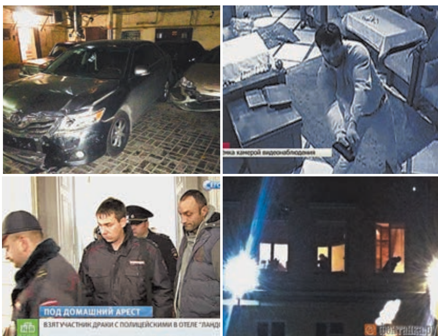
События в кафе были зафиксированы бесстрашной камерой.

Корреспондент «Труда» пыталась получить оценку этой странной истории у представителя пресс-службы Управления МВД по Петербургу Вячеслава Степченко. Он ответил с уже привычной в подобных случаях категоричностью: «Без комментариев!» Ничего не смогли добавить или убрать и в Управлении Следственного комитета РФ по Петербургу. Мой вопрос, а можно ли вообще подобное прощать, остался без ответа.