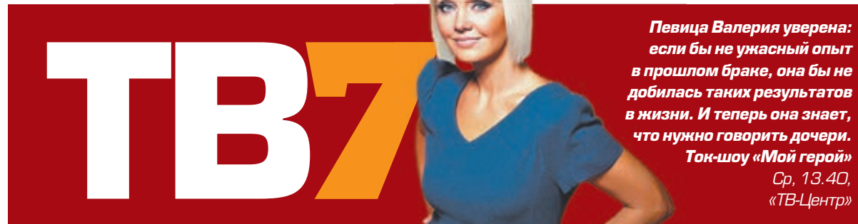
Певица Валерия уверена: если бы не ужасный опыт в прошлом браке, она бы не добилась таких результатов в жизни. И теперь она знает, что нужно говорить дочери. Ток-шоу «Мой герой» Ср. 13.40, «ТВ-Центр»