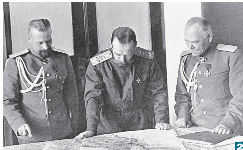
1 Николай II и генерал Брусилов. 2 Николай II, генералы Михаил Пустовойтенко (слева) и Михаил Алексеев (справа). 3 Николай II и царевич Алексей на смотре казачьего полка.