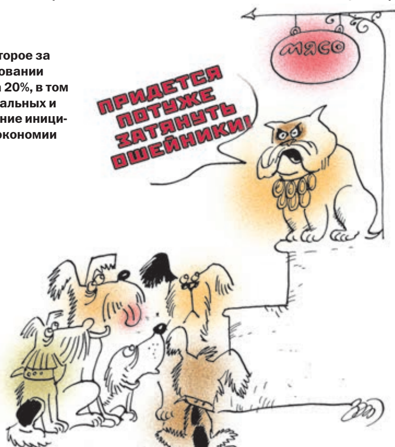
ИЛЛЮСТРАЦИЯ ТАТЬЯНА ЗЕЛЕНЧЕНКО/CARTOONBANK.RU

рублей планирует сэкономить Минфин при сокращении штата полицейских на 110 тысяч человек