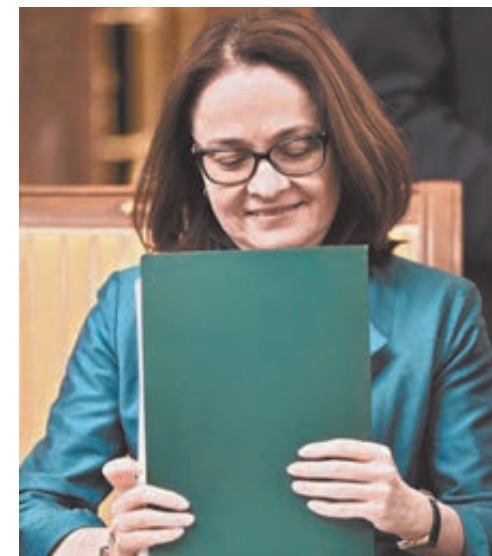
Глава Центробанка Эльвира Набиуллина удостоена опасной премии....

Алексей Кудрин отмечался трижды: в 2004 году лучшим министром финансов мира его назвал журнал The Banker.