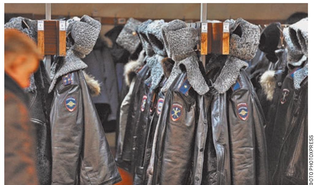
Многие из рядового состава МВД повесят форму на вешалку.

Перечень таких примеров можно продолжить. Показательна судьба «объектов культуры», в том числе федеральных музеев, которые уже с 1 ноября останутся без полицейской охраны — ее должны заменить ЧОПы. Любопытно, что в 2009 году музеи сами пытались начать переход на услуги частных охранных структур — из-за доро-