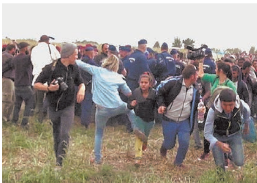
Пока венгры отбиваются от беженцев руками и ногами, всплыло откровенное жульничество прибалтов.

Дотошные немцы, замурившиеся от перспективы принять на своей территории до конца года миллион переселенцев, стали разбираться, почему латвийское правительство под нашим старшим братьев из ЕС согласилось на квоту аж в 250 (!) беженцев на два года, при этом в Риге перед зданием парламента прошли еще и манифестации протеста озабоченных граждан. И тут выяснилось, что уже давным-давно прибалтийские страны предъявляют в качестве контраргумента «мертвые души». Нет, сами души, слава богу, пока живые, но история очень смахивает на гого-