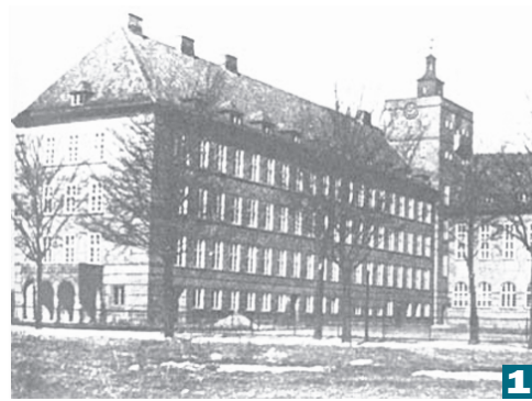
1 В здании нынешней гимназии №1 Калининграда была высшая реальная школа Бургшале. 2 Многие из первых учеников были участниками войны. 3 Будущий поэт Роберт Рождественский с мамой.

В числе первых ее учеников оказался 17-летний вчерашний