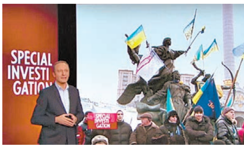
Поль Морейра взорвал документальную бомбу.

Перепалка идет необычайно долго для французских СМИ. На местном ТВ масса интригующих реалистично-шоу, которые приковывают к экранам миллионы глаз, но забываются сразу после выключения кнопки. Показанный в прайм-тайм по Canal+ фильм известного документалиста Поля Морейры произвел эффект взорвавшейся бомбы, потому что выламывается из общего ряда. Он в корне отличается от привычной обывателям благостной картинкой украинской революции, где добрые демократы Майдана свергли злого тирана Януковича. Между тем Морейра ничего не придумывал. Просто передал в жанре документального расследования то, что поразило его самого. Фашистствующие боевики из батальона «Азов», горящий Дом профсоюзов в Одессе, где хладнокровно спалили живьем 42 человека. Не забыл