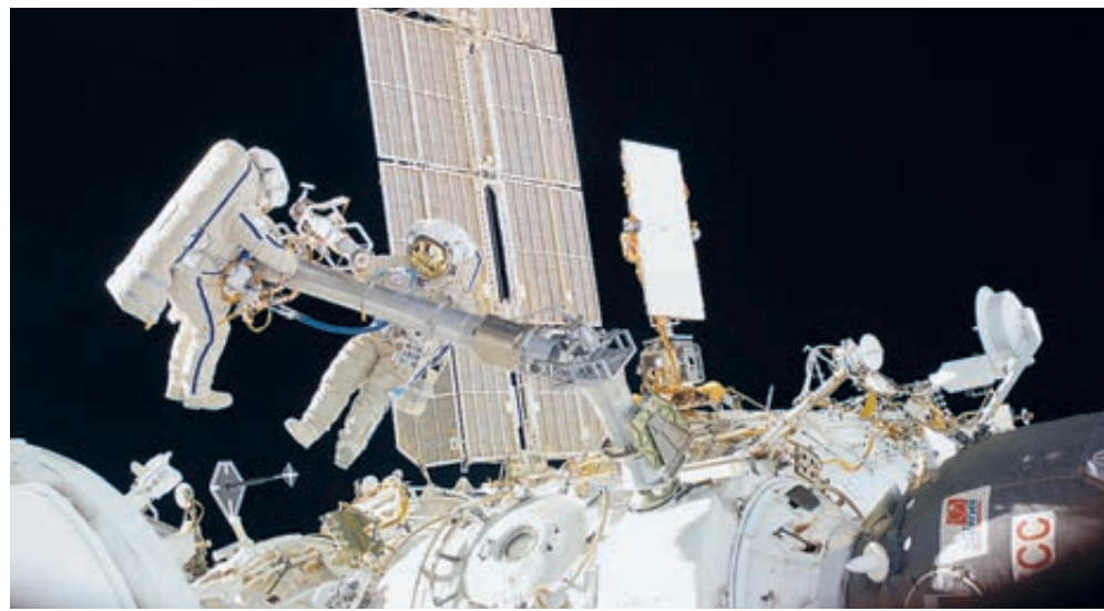
Работа россиянина Антона Шкаплерова в открытом космосе вызвала живой интерес во всем мире.

Так что же на самом деле нашли на обшивке МКС? За разъяснениями я обратился в Институт медико-биологических проблем Российской академии наук. И первым делом спросил, могут ли оказаться пришельцами из далеких миров те бактерии, которые поселились снаружи МКС? Ведь они должны выдерживать немислимые для живого организма