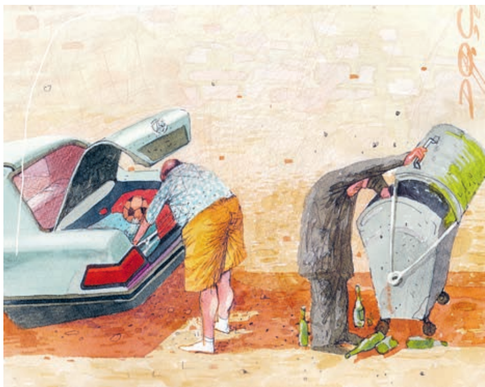
ИЛЛЮСТРАЦИЯ ОЛЕГА ДЕРГАЧЕВА, САНКТ-ПЕТЕРБУРГ

Но 117 рублей – лишь 1% от нынешнего МРОТ, а плановая инфляция в России составляет 4%. Входящем году, по заявлению Эльвиры Набиуллиной, цены вырастут на 5–6%. То есть прибавка самым низкооплачиваемым составит 117 рублей, а цены совокупно вырастут минимум на 500–600. И бедные станут еще беднее. А они и ныне перебиваются с хлеба на квас. Поставивший на себе смертельный опасный эксперимент саратовский депутат Николай Бондаренко, питаясь на продовольственную составляющую прожиточного минимума в 3500 рублей, за 31 день похудел на 7,6 кг. Доказал, что прожить на