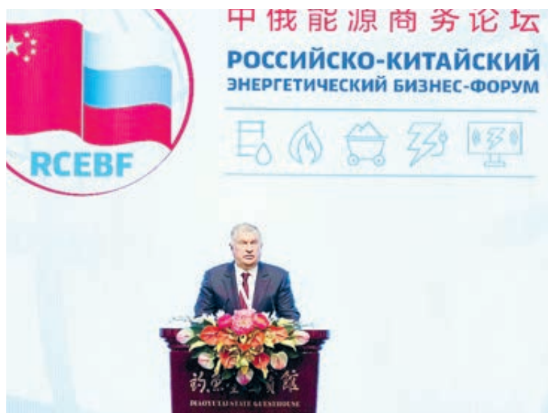
С приветственным словом к участникам форума выступил Игорь Сечин.