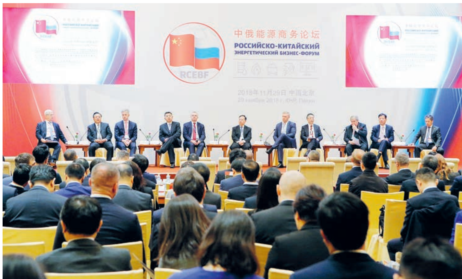
В рамках энергетического бизнес-форума состоялось свыше 50 деловых встреч и подписано около 20 взаимовыгодных соглашений.

В частности, «Россети» подписали соглашение с Государственной электросетевой корпорацией (ГЭК) Китая, в рамках которого партнеры займутся цифровизацией электросетевого комплекса и локализацией оборудования в России. С China Energy достигнута договоренность об осуществлении