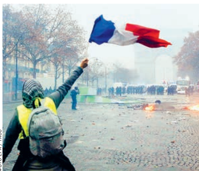
Успокоить этого француза теперь непросто...

Уже три недели подряд, с 17 ноября, все крупные города Франции становятся ареной жестоких столкновений полиции с участниками протестного движения «Желтые жилеты». Те готовы терроризировать власти, пока правительство не откажется от идеи экологического сбора. Пика массовые беспорядки достигли в минувшую субботу, в первый день зимы, когда в Париже вандалы громили дорогие магазины на Елисейских Полях, завалили ограду сада Тюильри, погасили Вечный огонь и разрисовали Триумфальную арку. Оторванная голова императора Наполеона, раскуроченные мостовые, разбитые витрины банков и сожженные автомобили — таковы нынче приметы «города, который всегда со мной». Все, кто не протестует, с замиранием сердца ждут новой черной субботы.