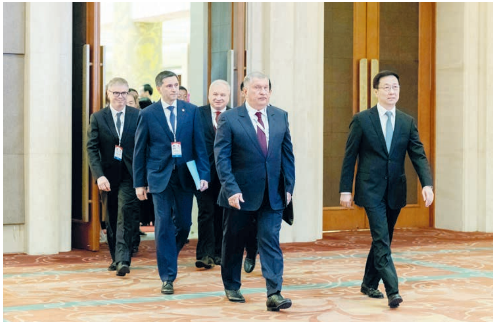
Форум собрал видных политиков и бизнесменов.

Мероприятие позволило собрать вместе руководителей крупнейших компаний отрасли и основных лиц, принимающих решение по развитию энергетики в России и Китае. В своем приветственном слове для участников форума Игорь Сечин отметил, что «в зале присутствуют руководители компаний, суммарная капитализация которых составляет около 2 трлн долларов». Таким образом, столь высокий уровень представительства стал наглядным подтверждением заинтересованности бизнеса двух стран в укреплении