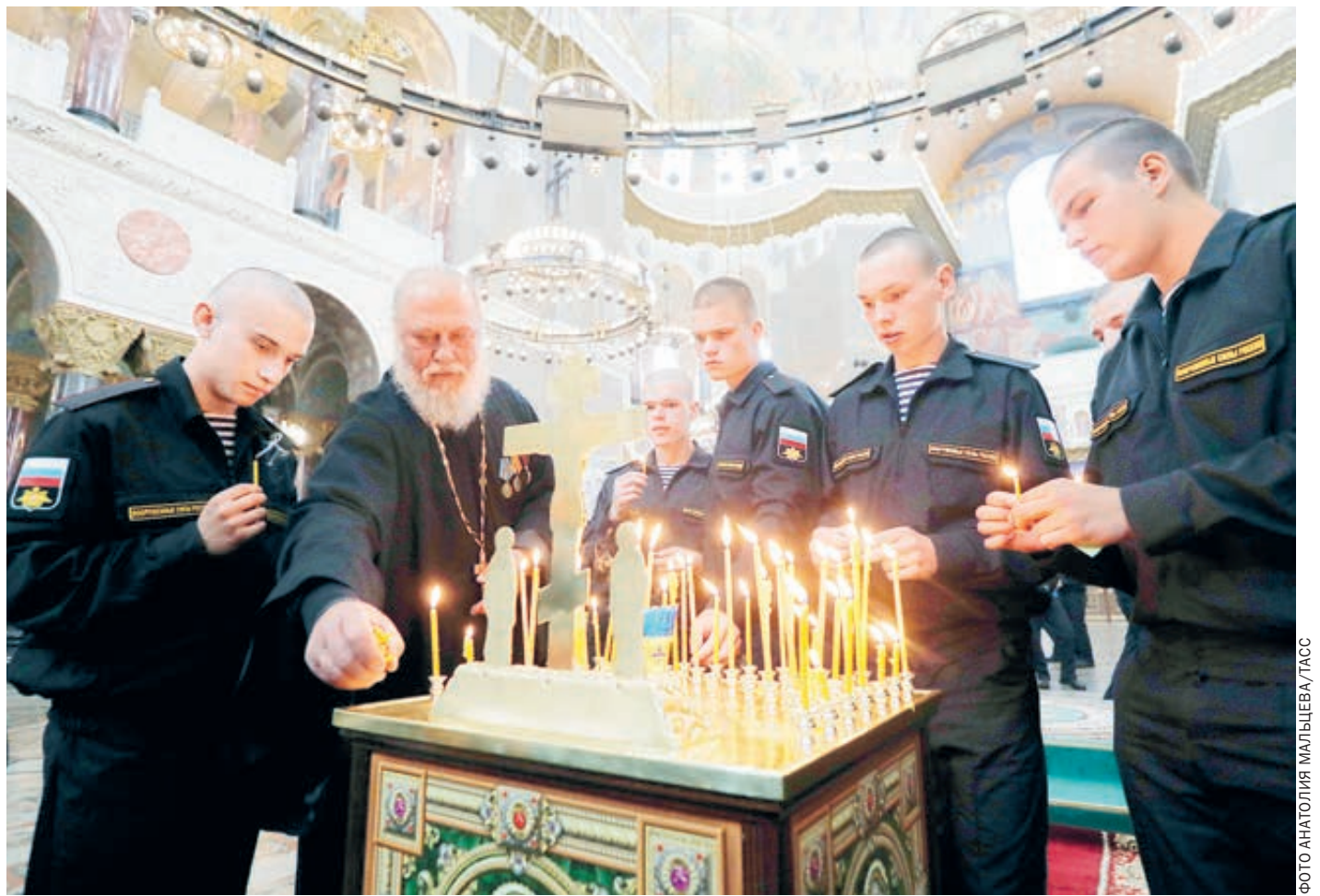
Погибших моряков поминуют в Морском соборе святителя Николая Чудотворца в Кронштадте.

«Лошарик» не несет оружия, зато оснащен манипулятором, ковшом с телекамерой, системой очистки породы, а также гидростатической трубкой. Именно этот внешне безобидный набор инструментов вызывает большие опасения на Западе. Так