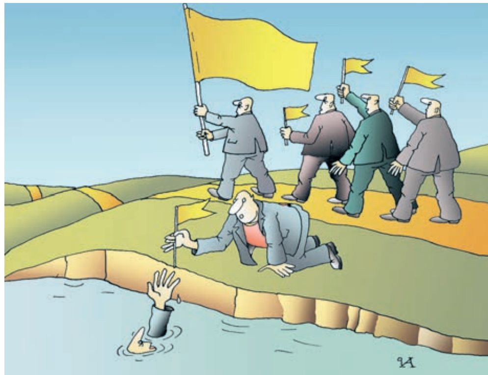
ИЛЛЮСТРАЦИЯ ИВАНА АННУКОВА/CARTOONBANK.RU

Даже в Москве, где горожане вроде бы довольны работой мест-