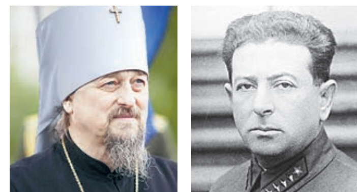
Митрополит Белгородский и Старооскольский Иоанн и зам. наркома обороны СССР Лев Мехлис. Между ними – эпохи, но мыслят они очень похоже.

Ответ: Нет, недостаточными, но большого я не мог ничего сделать, так как частей у меня не было.