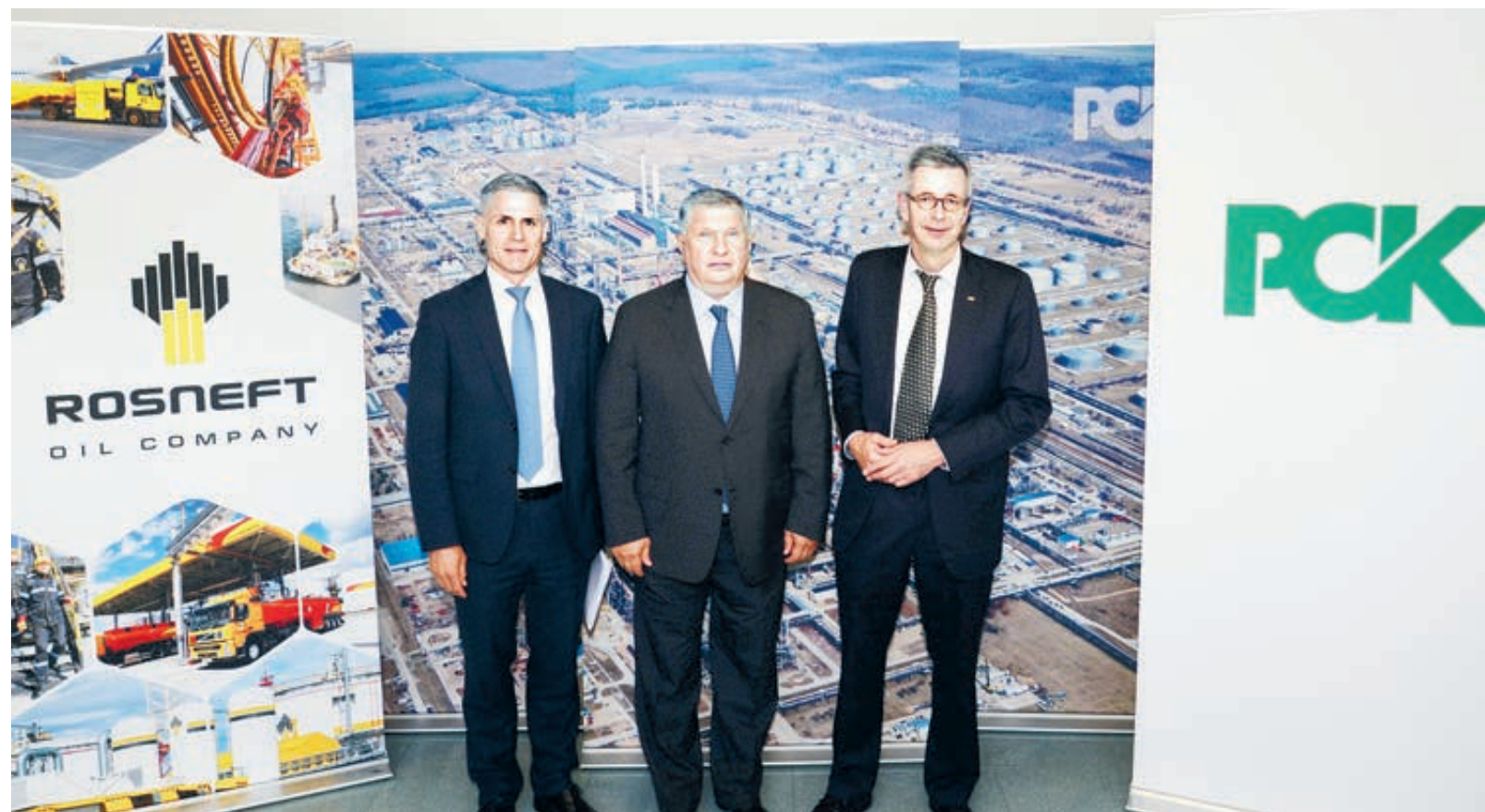
Глава «Роснефти» Игорь Сечин посетил с рабочим визитом НПЗ РСК, расположенный в городе Шведт.

Как сообщили немецкое издание World Economy со ссылкой на имеющиеся в его распоряжении документы и энергетики Германии за активные действия в решении проблем загрязнения трубопровода «Дружба».