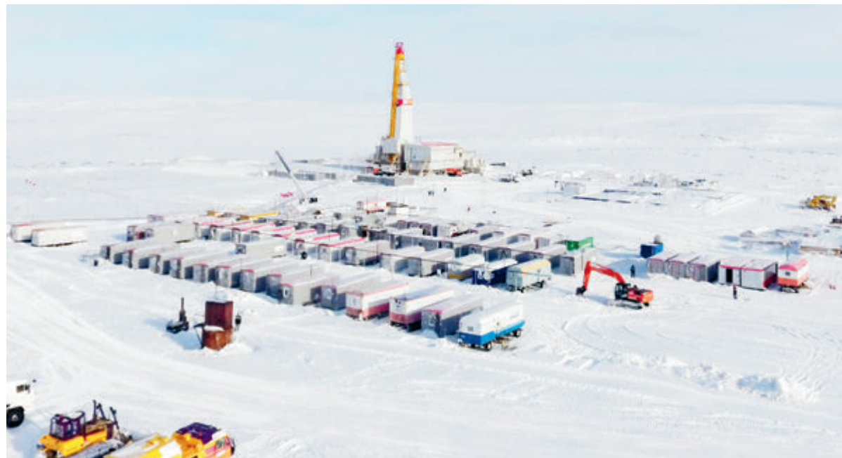
Проект «Восток Ойл» сегодня включает 52 лицензионных участка, в границах которых расположено 13 открытых месторождений углеводородов.

Решение оставить без изменений рейтинг «Роснефти» в S&P объяснили устойчивостью российской компании к рискам. «Денежные потоки НК «Роснефть» менее волатильны, чем у многих ее конкурентов. Кроме того, российская компания имеет одни из самых низких в отрасли удельные операционные затраты на добычу углеводородов (2,6 долл./барр. н. э.) на фоне больших объемов добычи». При