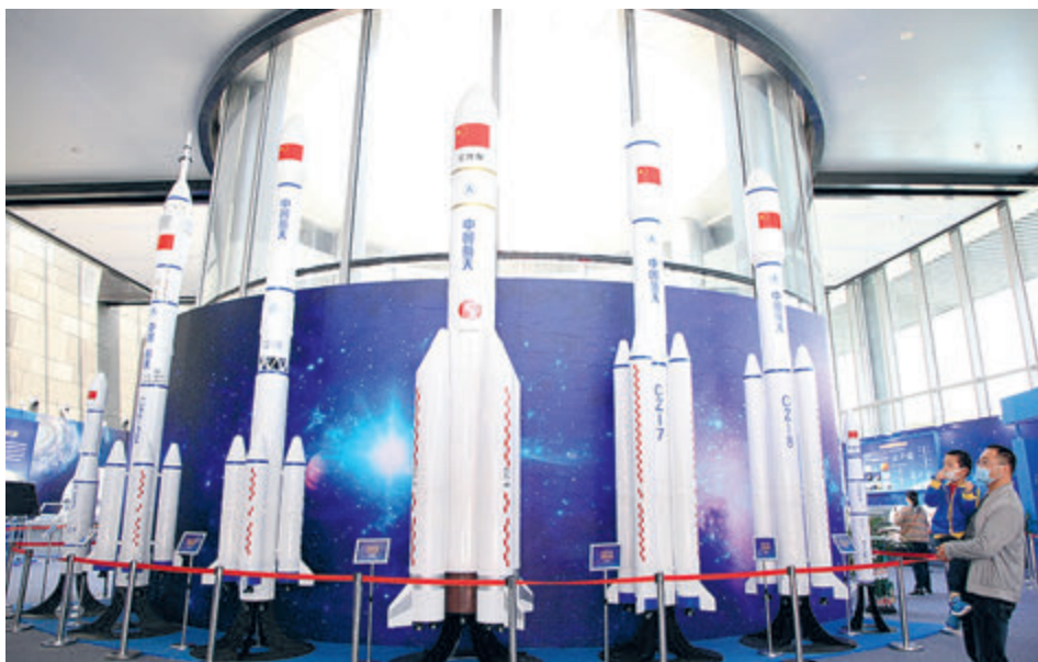
2 мая в городе Нанкин провинции Цзянсу прошла Китайская выставка достижений в области авиации и космонавтики.

С начала этого века человечество узнало о совершенно новых особенностях Луны, в частности в полярных районах были обнаружены признаки отложения водяного льда. Для будущих лунных станций лед – это важный источник воды и кислорода. Вместе с этим лед на Луне может содержать самые ранние материальные компоненты Солнечной системы, что поможет в изучении источников происхождения жизни на Земле. Такое открытие вызвало широкий интерес людей к Луне.