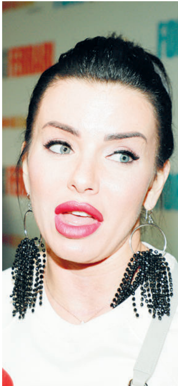
Юлия Волкова встретила о судьбах ивановских мужиков.

Ныне в эту сборную команду собирается влиться президент Федерации лыжных гонок России, тренер сборной Елена Вяльбе. Она в списке на праймериз, а «ЕР» такими людьми не бросается: сегодня в списке кандидатов, завтра — в Госдуме. Полу телеведущих в лице Петра Толстого и Сергея Ревенко может прибавиться: неистовый борец сврагами внешними и внутренними Евгений Попов готов дедантироваться на передний край без супруги Ольги Скабеевой.