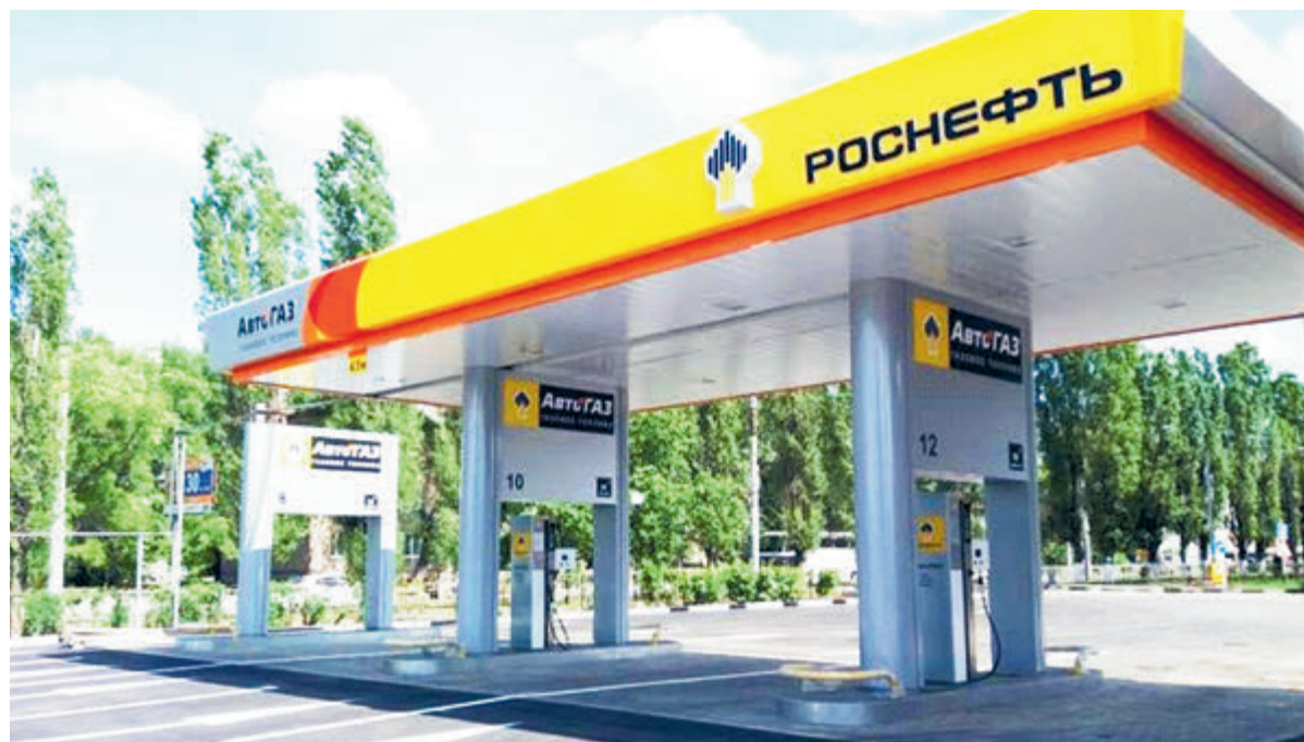
В рамках программы снижения выбросов «Роснефть» продолжает ввод АЗС с компримированным газом.

57,8 млн тонн н. э. – общая добыча углеводородов «Роснефти» в первом квартале. Это самый высокий показатель в мире среди публичных компаний «Несмотря на сокращение в 2020 году программы капитальных затрат, что является общерыночной тенденцией, «Роснефть» не стала откладывать запуск стратегически важных проектов, обеспечив себе значительное конкурентное преимущество в будущем, так как теперь у «Роснефти» отсутствуют