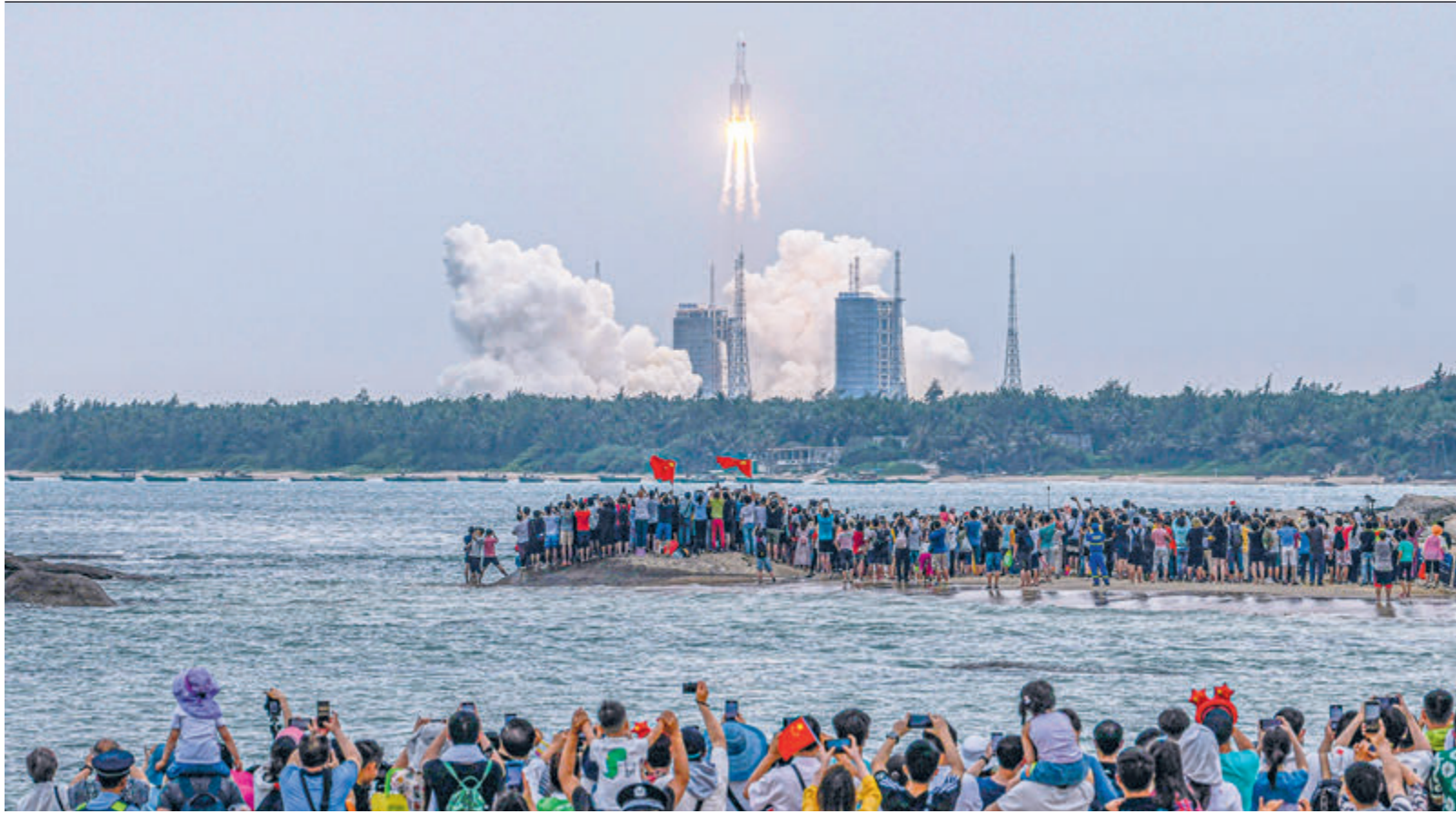
Пуск базового модуля «Тяньхэ» с космодрома Вэнчан в провинции Хайнань.

15 мая спускаемый аппарат китайской межпланетной миссии «Тяньвэнь-1» приземлился на Марсе. 22 мая по Марсу начнет двигаться шестиколесный марсоход «Чжужун». Помимо традиционных приборов для изучения Красной планеты на его борту радар, который исследует поверхность Марса на глубину 100 метров