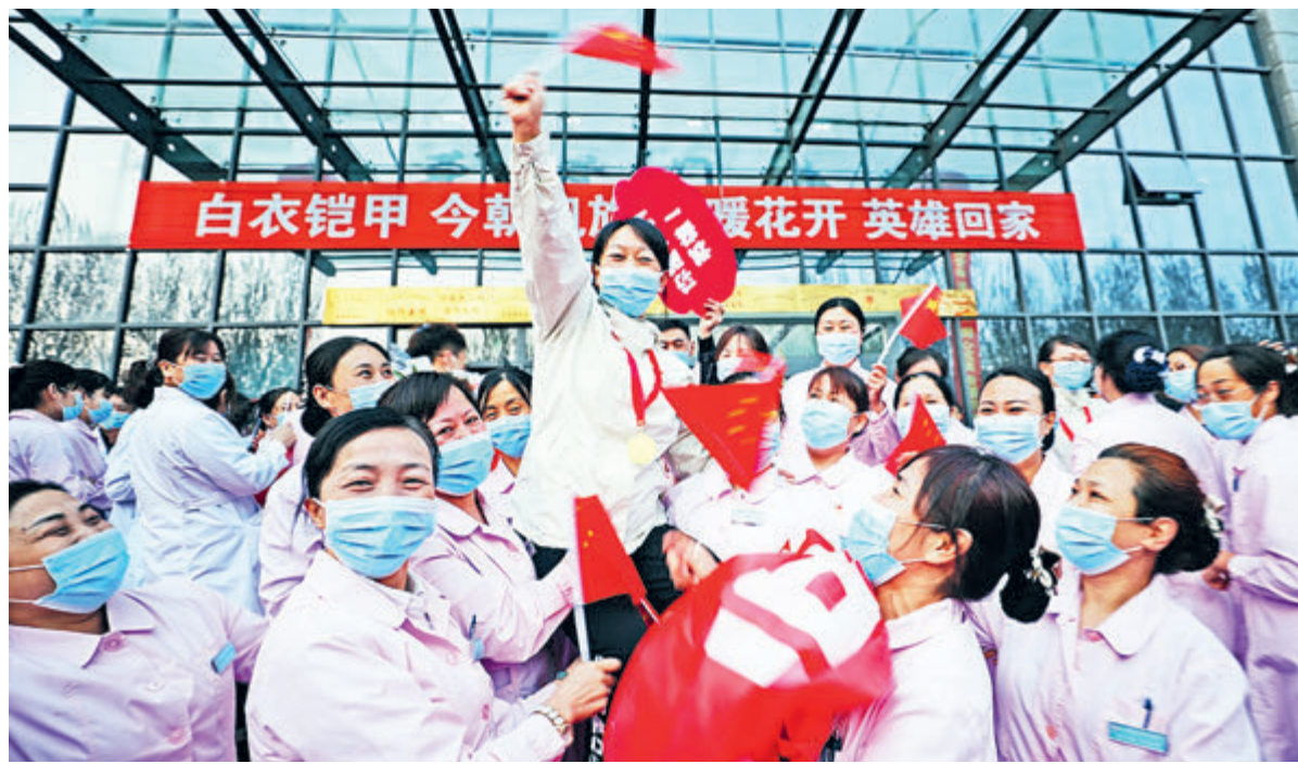
ЦК КПК взял на себя всю ответственность за борьбу с пандемией COVID-19, и Китай быстро с ней справился. На фото: медицинский персонал автономного района Внутренняя Монголия вернулся из Уханя домой.

С момента начала политики реформ и открытости в Китае в 1978 году строительство и развитие социализма с китайской спецификой стало основной темой всей теории и практики Коммунистической партии Китая. После более чем 40 лет непрерывного совершенствования и развития были сформулированы путь, теория, система и культура социализма с китайской спецификой, что создало новые исторические условия для великого возрождения китайской нации.