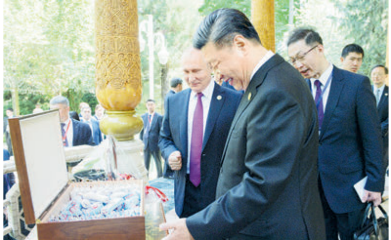
В Китае растет популярность продуктов из России, среди хитов – мороженое, шоколад и мед.