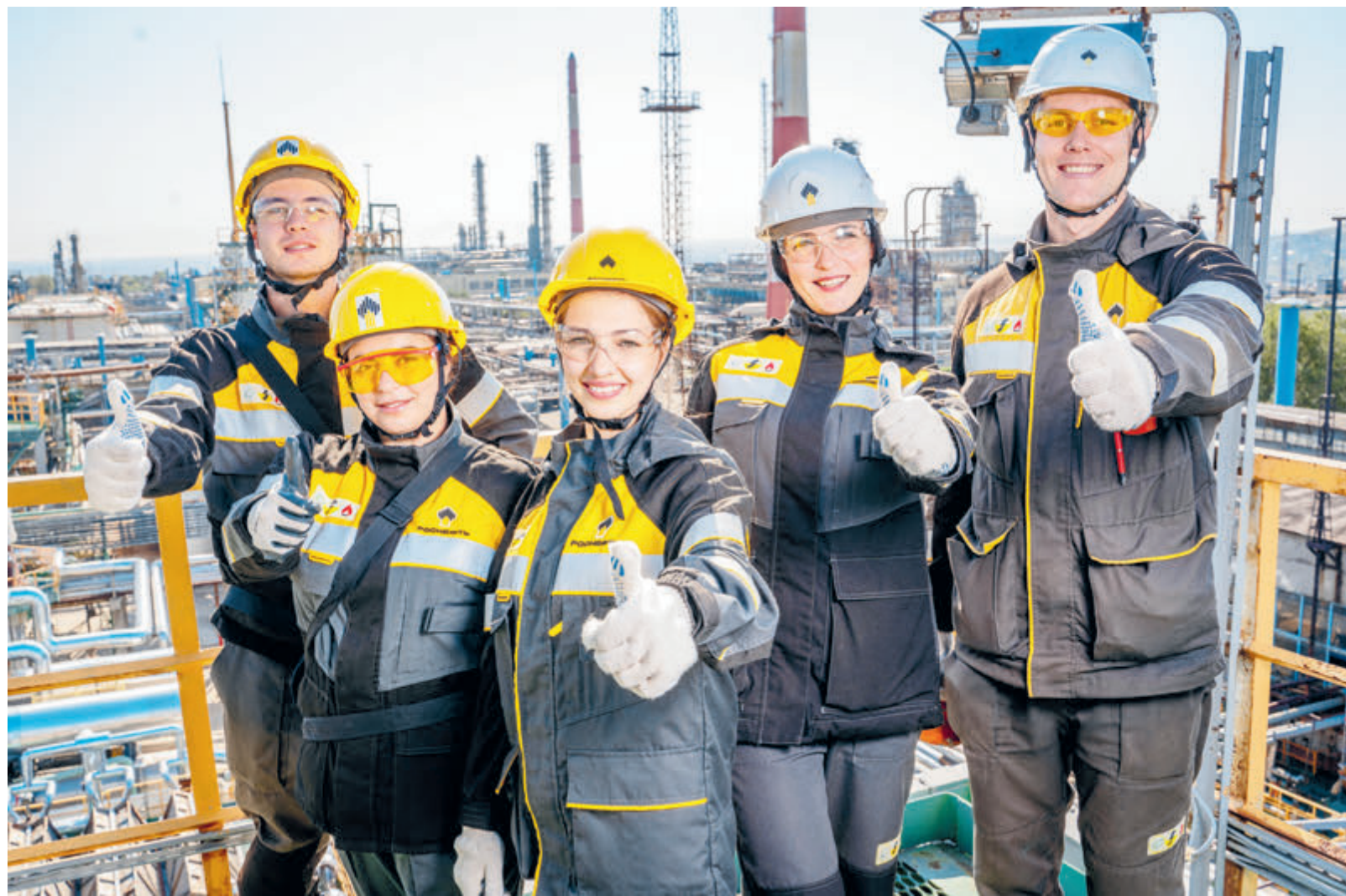
«Роснефть» разделяет и активно поддерживает международные и национальные цели в области борьбы с изменением климата.

«Роснефть» и BP объединяет не только многолетняя исто-