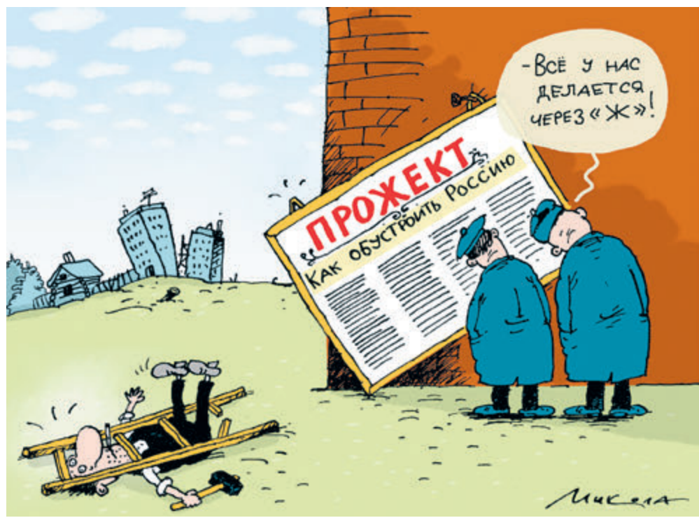
ИЛЛЮСТРАЦИЯ НИКОЛАЙ ВРОНЦОВ/CARTOONBANK.RU

В связи с чем ученые-экономисты РЭУ имени Плеханова напомнили: в России уже имеются более 54 тысяч документов стратегического планирования, как правило, не согласованных друг с другом, регулярно не вы-