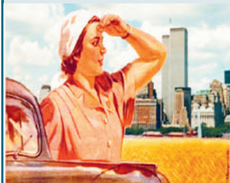
С КАЖДЫМ ДНЕМ ВСЕ РАДОСТНЕЕ ЖИТЬ!

Почему сейчас меньше стресса? Да потому что мы к нему привыкли, при постоянном чувстве тревоги он притупляется. В прошлом году коронавирус был в новинку. Но выяснилось, что болезнь не настолько страшна, как ее рисовали поначалу. К тому же в России нет отчаянной пропаганды опасности вируса. Да и к низким зарплатам и постоянному росту цен люди адаптировались. Застой? Он уже много лет, им не удивишь. Что же до меня, то я разделяю стрессы социальные и личные. В политике и экономике я только наблюдатель, чего зря тревожиться? На эмоции в СМИ и ТВ внимания не обращаю. Цифры экономистов и социологов, конечно, удручают. Но я прожил много лет и знаю: большие потрясения случаются крайне редко. Даже распад Союза оказался не смертельным. Стрессов по поводу карьеры у меня нет. Не тот возраст, когда трясутся о положении и деньгах. Но если возникают проблемы личные — да, здесь к стрессам не адаптируешься. Рецептов нет.