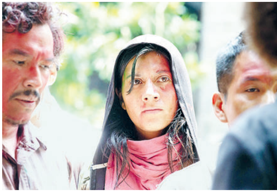
В этом фильме между стихией улицы и кованым сапогом диктатуры не оказалось золотой середины. В жизни тоже так бывает...

Итак, на роскошной вилле собираются отпраздновать свадьбу. Семья белых богачей выдает замуж 25-летнюю красавицу дочь Марианну (Найан Гонсалес Норвинд), выбравшую для церемонии