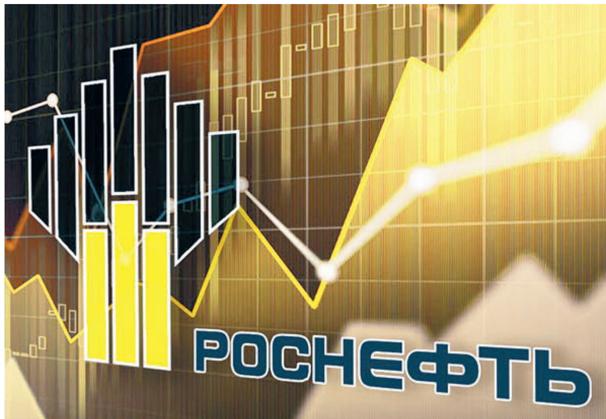
Рост акций «Роснефти» на Московской бирже составил свыше 30% в первом квартале.

Именно СДП является самым ярким свидетельством финансовой стабильности компании – он, несмотря на различные кризисы, потрясающие мировую экономику и нефтегазовый комплекс, остается положительным уже десятый год подряд.