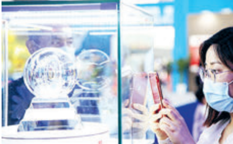
На Китайской выставке достижений в области авиации и космонавтики выставлены образцы лунного грунта.