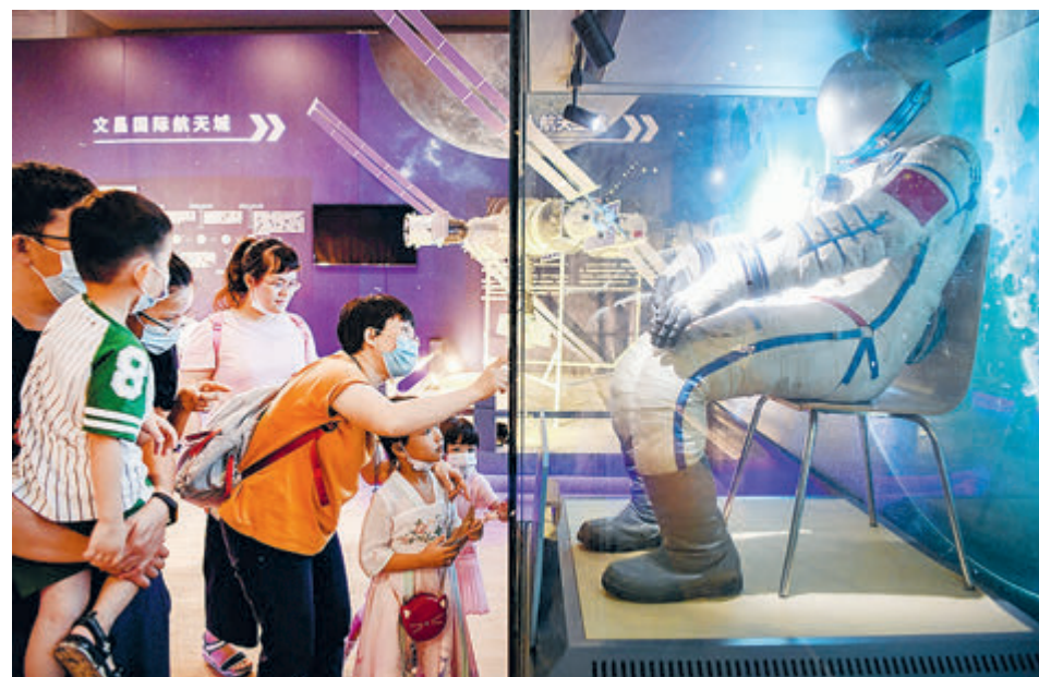
Посетители Китайской выставки достижений в области авиации и космонавтики разглядывают экипировку тэйконавта.

несколько точек на поверхности Луны, чтобы проанализировать как можно больше образцов лунного грунта. Невозможно полагаться на усилия лишь одной страны, нужно взаимодействие между страна-