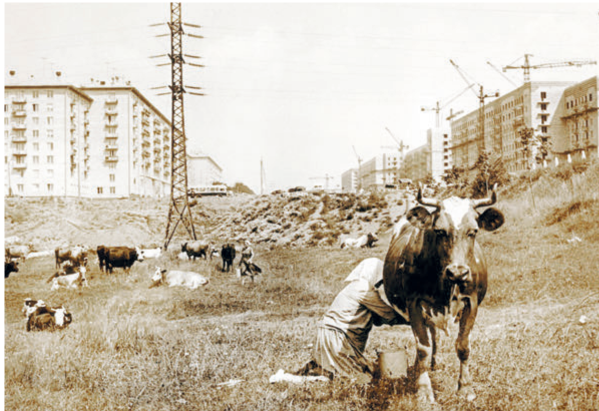
Москва, Ленинский проспект. 1954 год.

Эксперты Level Group подсчитали: в настоящее время спрос на жилье компактного формата даже в комфорт-классе превышает предложение втрое, а в бизнес-