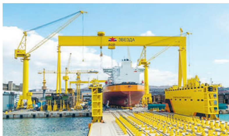
Сотрудничество с китайскими партнерами активно развивается в рамках масштабного проекта по созданию ССК «Звезда», который реализуется консорциумом компаний во главе с НК «Роснефть».

Сотрудничество «Роснефти» с китайскими партнерами в энерге-