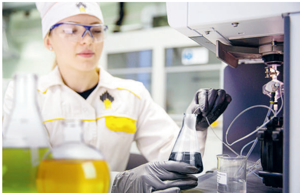
По итогам 2021 года «Роснефть» получила экономический эффект в размере 12 млрд рублей благодаря внедрению инновационных решений в операционную деятельность.

Особая гордость нефтяной компании – собственная линейка специализированных программных комплексов в области разведки и добычи, которая охватывает весь спектр бизнес-процессов. На текущий момент в России такого единого программного комплекса нет ни у одной компании. По словам представителей «Роснефти», спе-