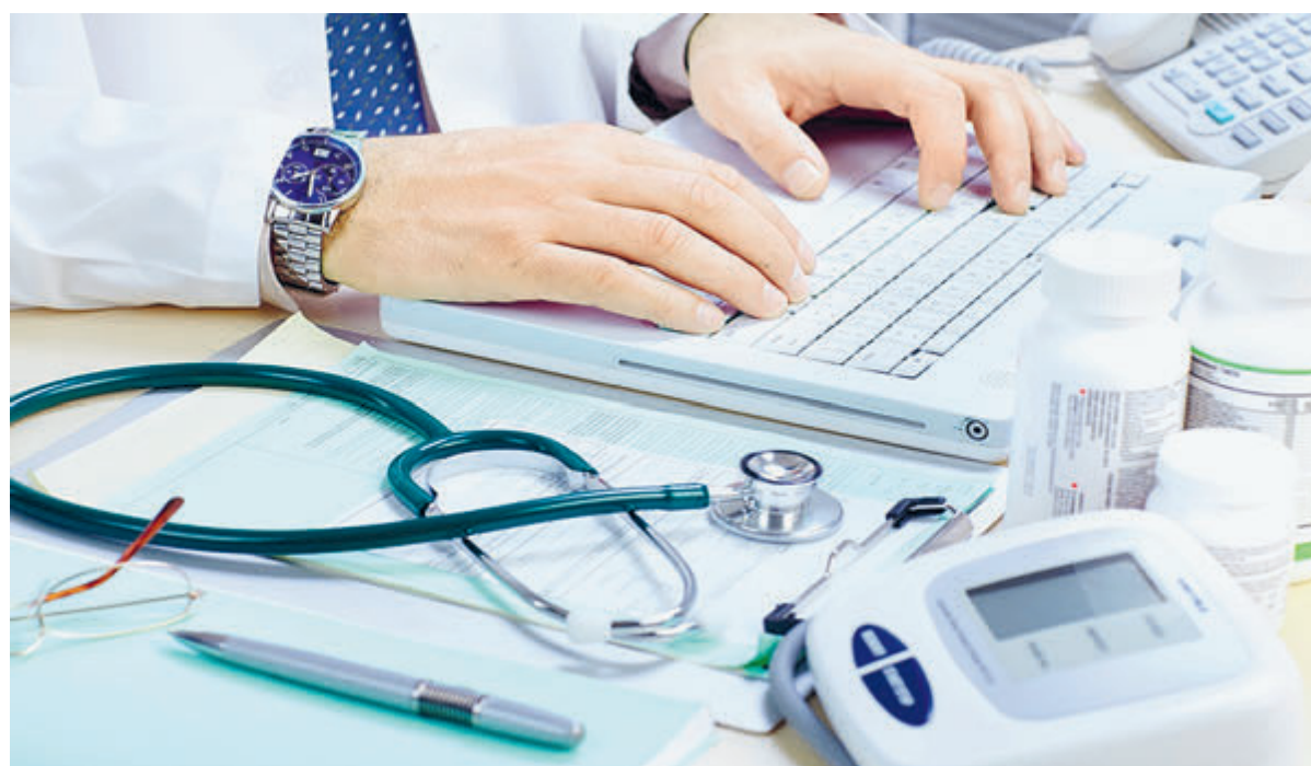
За январь 2022 года в России выдали 6,1 млн больничных, то есть бюллетень оформил каждый 12-й работающий – в 2,3 раза больше, чем годом раньше

Глава свердловской полиции издал приказ, запрещающий сотрудникам МВД публиковать «в СМИ и сети Интернет сведения, дискредитирующие качество оказания помощи ведомственными учреждениями здравоохранения». Сей документ, понятное дело, тут же появился в «сети Интернет» и вызвал больше 500 комментариев. Вот самые добрые из них: «А генерал пробовал скорую вызвать по номеру 103 или 112? Знает, что люди по несколько дней в очередях стоят, чтоб больничный