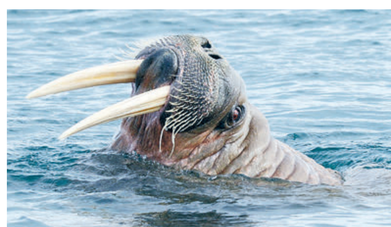
В высоких широтах работали экологические экспедиции «Роснефти» по изучению популяций белого медведя и атлантического моржа.