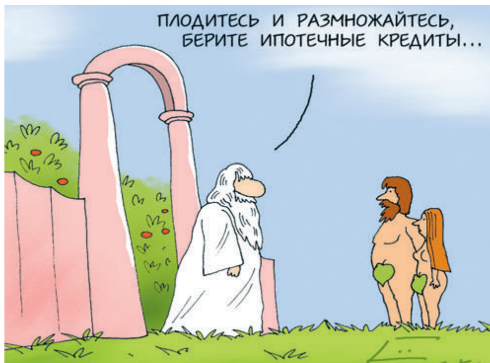
ИЛЛЮСТРАЦИЯ / CARTOONBANK.RU