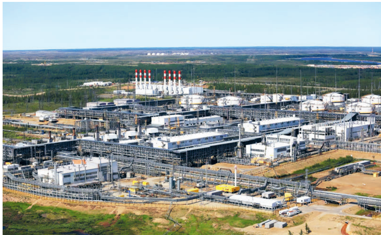
Флагманский проект «Восток Ойл» станет для «Роснефти» ключевым драйвером роста производства.

Сотрудничество «Роснефти» с китайскими партнерами носит интегральный характер