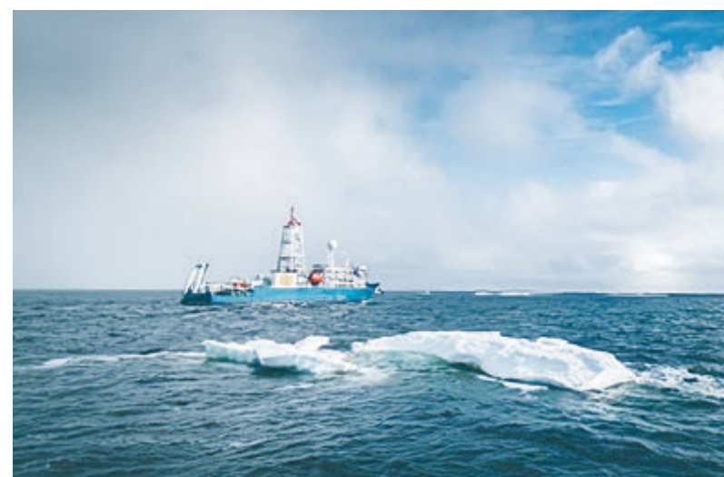
В 2021 году «Роснефть» впервые в истории провела бурение малоглубинных стратиграфических скважин в Восточной Арктике.

Весной 2021 года на острове Земля Александры архипелага Земля Франца-Иосифа велись исследования белого медведя в период выхода самок из родовых берлог. С помощью квадрокоптера ученые получили уникальные кадры медведиц с потомством. В августе – сентябре 2021 года на архипелаге Новая Земля в районе мыса Желания выполнены работы в безледный период – самый сложный для белых медведей. Проведен комплекс морфометрических измерений животных, взвешивание, отбор проб крови и шерсти для генетического, биохимического и токсикологического анализа. ■