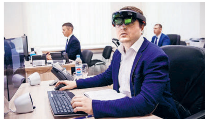
В прошлом году «Роснефть» провела Марафон IT-соревнований для программистов, где приняли участие более 700 специалистов из 13 стран.

Также на основе собственного уникального катализатора «Роснефть» выпустила дизельное топливо с улучшенными низкотемпературными свойствами. Два вида топлива – зимнее и арктическое – произведены с помощью сероустойчивого катализатора изодепарфинизации на основе