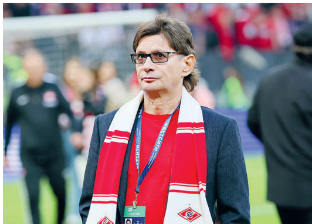
Что станет со «Спартаком» с уходом Леонида Федун из «ЛУКОЙЛа»? Вопрос не праздный.

Трава на стадионах соскучилась по футболу