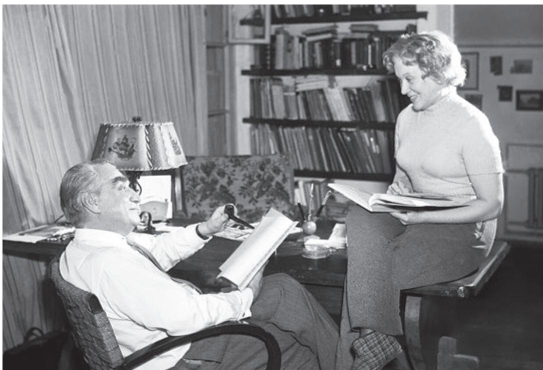
Григорий Александров и Любовь Орлова на даче во Внуково. 1960-е.

Позже Любовь Орлова вспоминала: «Все это пришлось тщательно репетировать, надо было следить, чтобы ни головой, ни рукой не захватывали».