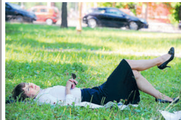
Вот она, сиеста по-русски.

Но если работодатель не слушается санитарных врачей, ему за это... ничего не будет. Ибо требование о сокращении рабочего дня в зависимости от температуры в помещении ранее содержалось в СанПиН 2.2.4.548-96, обязательных для соблюдения, однако уже утратило силу. Результат: 64% московских компаний в этом году отказались менять режим работы летом в любую