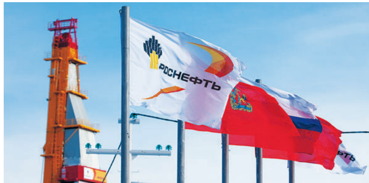
На флагманском проекте «Восток Ойл» планируется ежегодно добывать около 100 млн тонн.

«Во-первых, компания активно реализует новые проекты. Можно сказать, что тут она является лидером не только в России, но и во всем мире. Не секрет, что под воздействием «зеленой» повестки ведущие компании-мейджоры сворачивают свои инвестиции в нефтегаз, что уже в среднесрочной перспективе