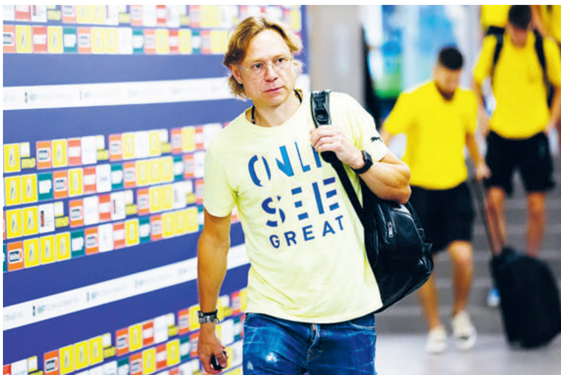
Валерий Карпину надо найти мотивацию для игроков национальной сборной. А это нелегко.