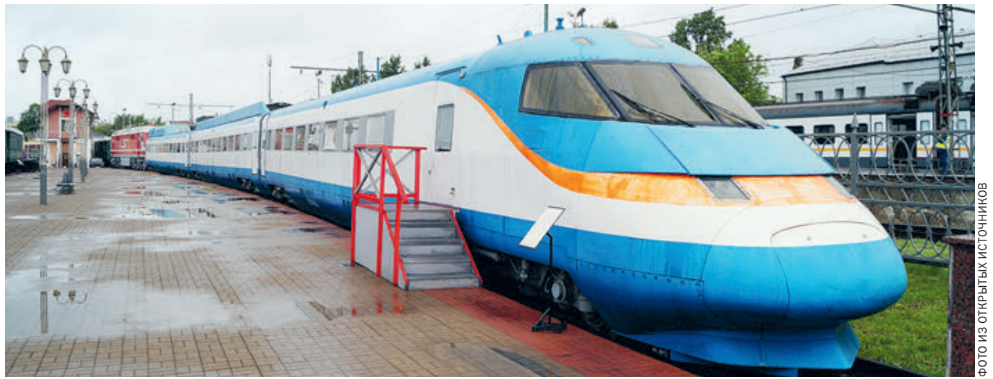
ЭС250 «Сокол» так и остался музейным экспонатом...

На проектно-исследовательские работы и финансово-экономическое обоснование потратили уйму денег. Параллельно велись переговоры с немецкими партнерами – типа, что дешевле предложит. Но к 2019 году было объявлено, что от проекта решено отказаться. Дескать, дорого, не окупится. Опять вернулись