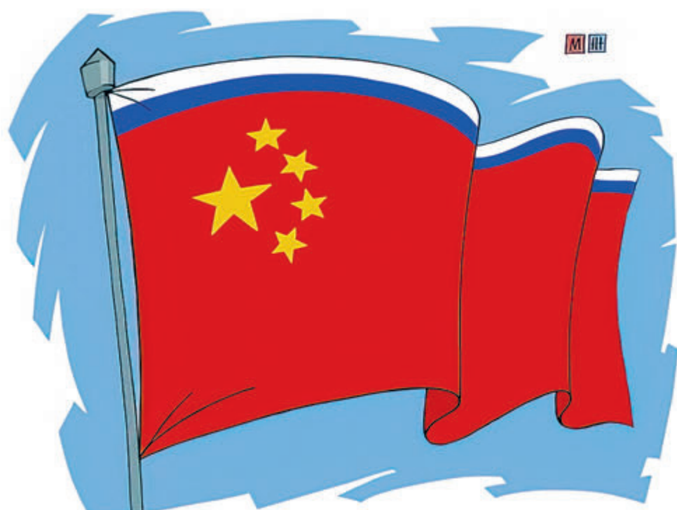
ИЛЛЮСТРАЦИЯ СЕРГЕЯ БАНКА. RU