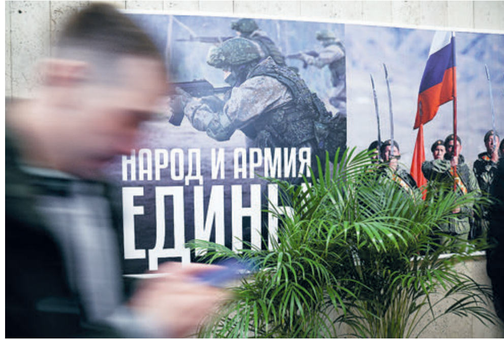
Москва. Пункт отбора на военную службу по контракту.