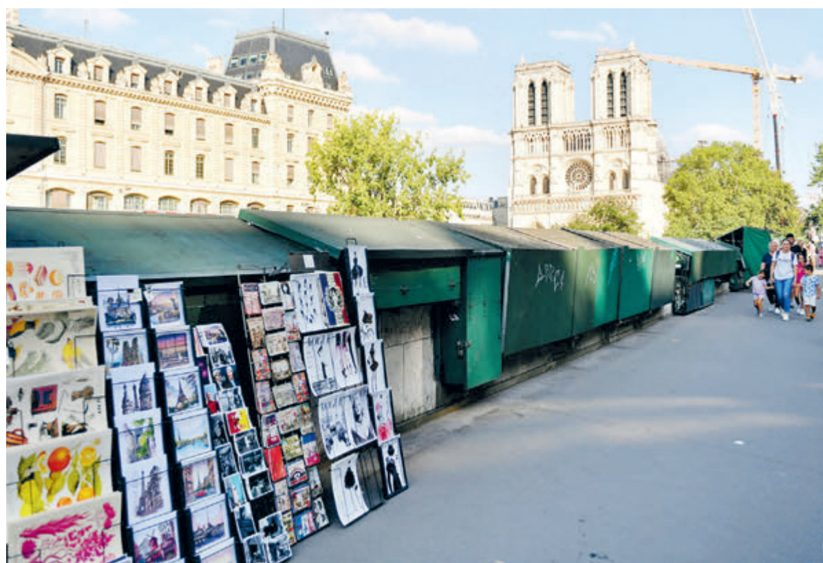
Лавки букинистов на берегах Сены – неотъемлемая часть Парижа.

Однако у мэрии и правительства остается серьезное препятствие для превращения берегов Сены в гигантские трибуны, а мостов – в места награждения. На пути гуляний сотен тысяч фанатов стоят лавки букинистов. На берегу Сены регламентиро-