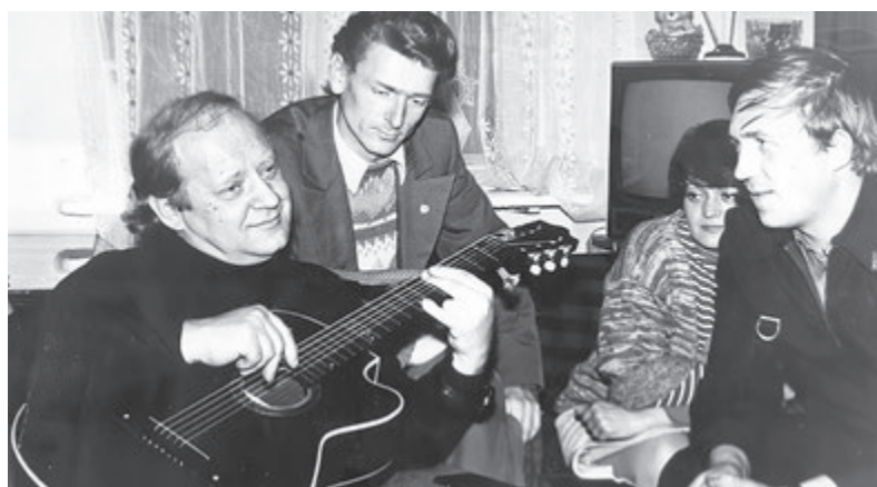
Визбор в компании с Высоцким.