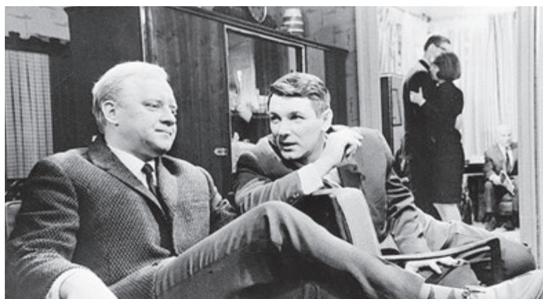
Кадр из фильма «Июльский дождь».