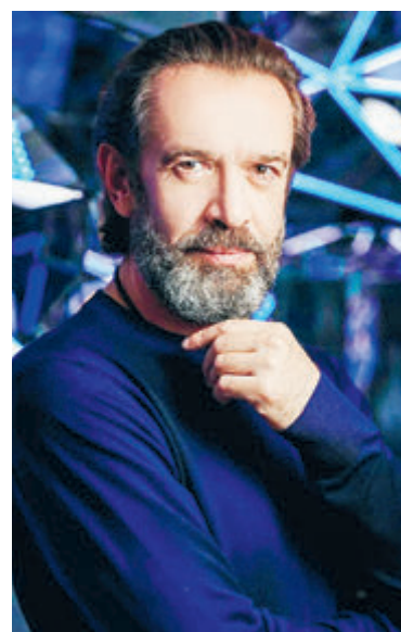
Ба! Знакомые все лица: Владимир Машков, Евгений Герасимов, Константин Богомолов.

Говорят, одной из причин движения Евгения Владимировича стали его успехи на посту депутата Мосгордумы, из стен которой он очень содействовал столичным театрам, когда у тех возникали трудности. Ну а с его главным девизом – «спектакли должны помогать человеку жить, а русский театр – лучший театр в мире» – решится спорить сегодня лишь, как теперь принято говорить, конченый отщепенец. Вот только хватит ли у человека, последние десятилетия известного скорее как политик, чем как создатель художественных ценностей, сил творчески увлекать за собой сразу два крупных театральные коллектива?