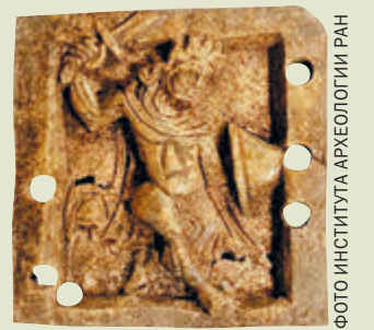
ФОТО ИНСТИТУТА АРХЕОЛОГИИ РАН

Города знаменитого Золотого кольца еще способны удивлять ученых и туристов. Недавно в центре Суздаля во время раскопок обнаружили ценные артефакты XII века. Особенно археологов поразила вырезанная из кости пластина с рельефом обнаженного воина, держащего в руках короткий меч и круглый щит. Так в Древней Греции, а позже и в Риме изображали