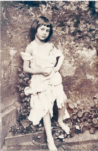
Алиса Лидделл в образе нищенки. 1858 год. Фото Льюиса Кэрролла.

на Рождество самую первую – рукописную версию книги с собственноручными иллюстрациями Кэрролл преподнес своей музе. Теперь этот экземпляр хранится в Британской библиотеке