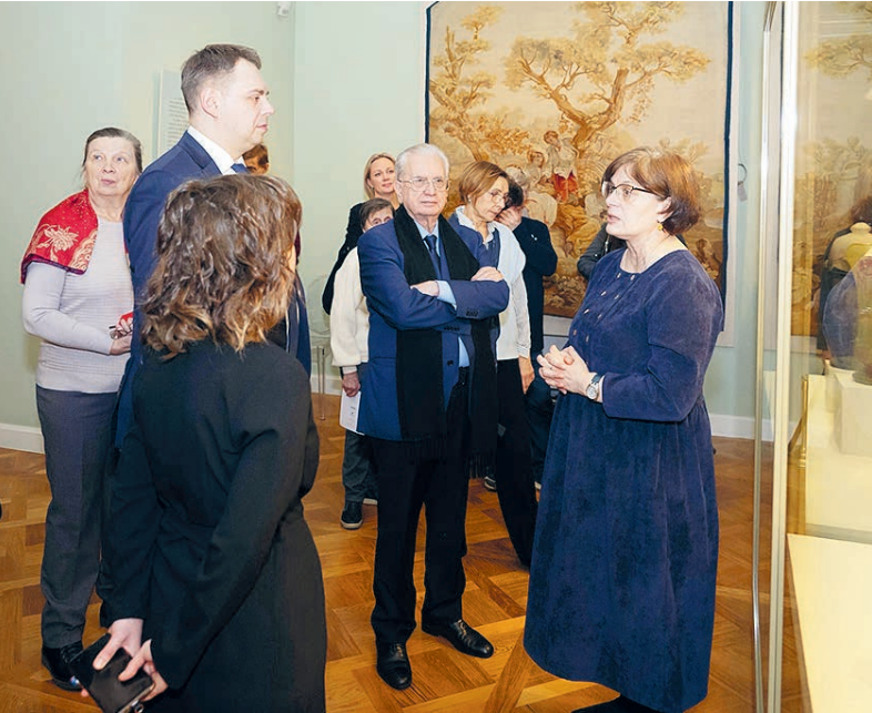
Директор Эрмитажа Михаил Пиотровский (в центре) принял участие в открытии экспозиции «Искусство эпохи модерна».