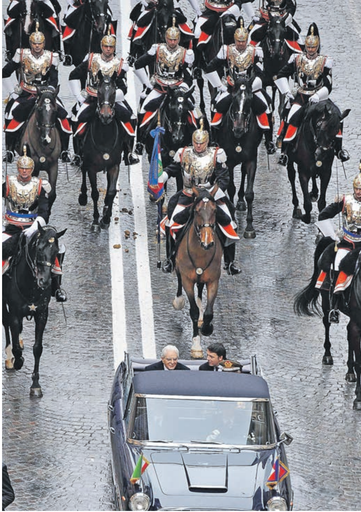
Сегодня точку в номере ставит новоизбранный президент Италии Серджио Маттарелла, направляющийся вместе с премьер-министром Маттео Ренци к месту инаугурации...