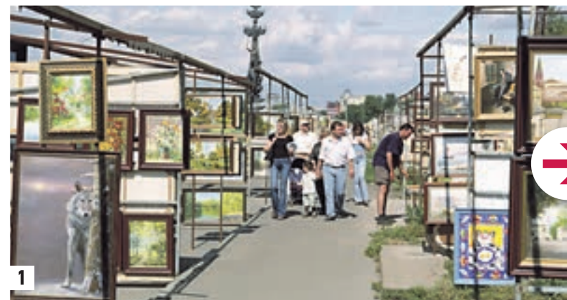
1 июля 2002 года 14:05 Вернисаж на обочине Крымской набережной (1) 28 сентября 2013 года 19:40 Та же набережная после преобразования, справа — новый вернисаж, волнистая крыша которого укрывает художников и их творения от непогоды (2)