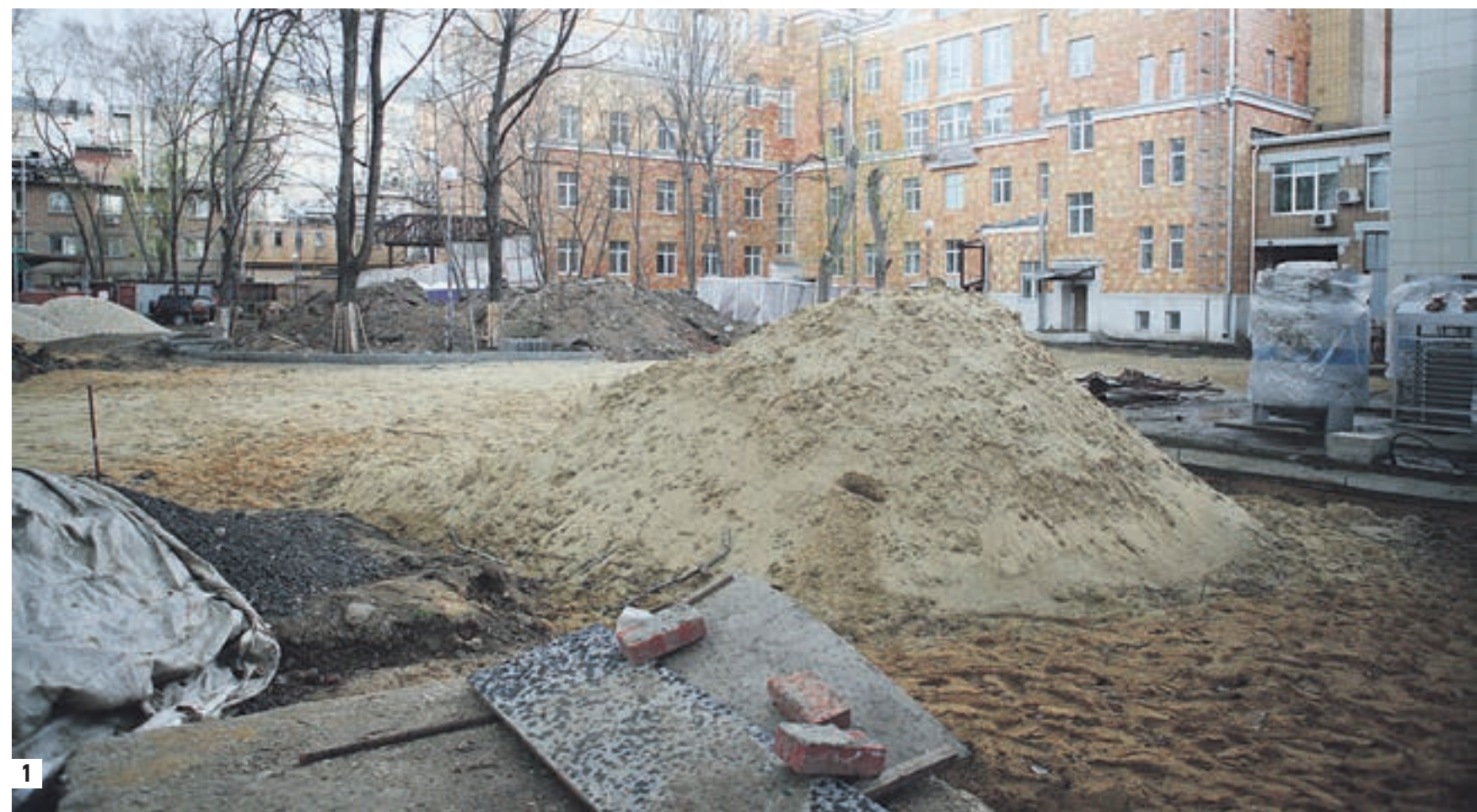
Вчера 15:10 Улица Правды, 15, строение 1. Здесь, на стройплощадке будущего родильного дома, в песчаном грунте рабочие нашли неразорвавшийся снаряд времён Великой Отечественной войны (1) Фото военных лет. Советские артиллеристы ведут огонь из 122-миллиметровой гаубицы М-30. Эта пушка также устанавливалась и на самоходки (2)