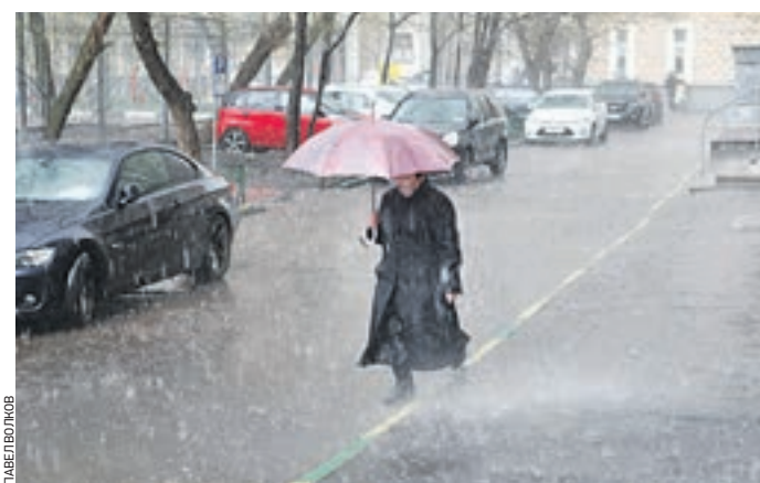
Вчера, 15:30 Весенней грозы не ожидали даже синоптики