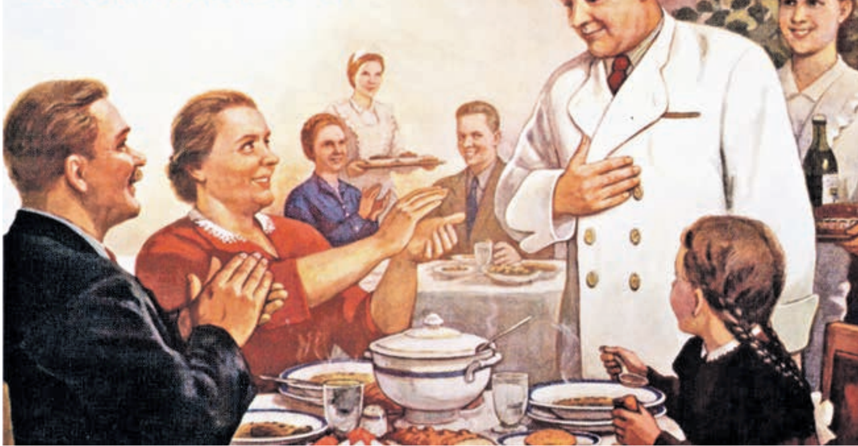
Советский агитационный плакат «Заслужите похвалу!» художника Виктора Говоркова, 1954 год. В послевоенные годы восстановления страны назрела необходимость повышения качества обслуживания населения во всех сферах быта. Эта задача решалась в том числе и средствами плановой живописи