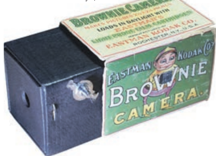
Вчера 11:00 Корреспондент «ВМ» обрел новый экспонат для своего домашнего музея. Фотоаппарат «Кодак-Брауни» 1900 года в оригинальной упаковке

15 тысяч экземпляров, то цена в тысячу долларов может быть реальной. Но поймите, для любого коллекционера каждая вещь имеет индивидуальную стоимость — все зависит от его собрания и уникальности предмета. Вообще сегодня наш антикварный рынок сильно просел, и теперь хорошие вещи можно купить в два-три раза дешевле, чем, скажем, три года назад.