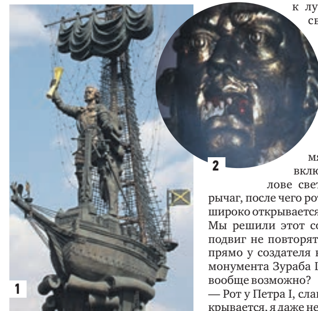
Памятник Петру I в Москве (1). Кадр из фильма «Тряпичный союз» (2)

Что нужно такого сказать Петру I, чтобы он то ли от возмущения, то ли от культурного шока открыл рот? Оказывается, ничего. Можно просто пощекотать в нужном месте.