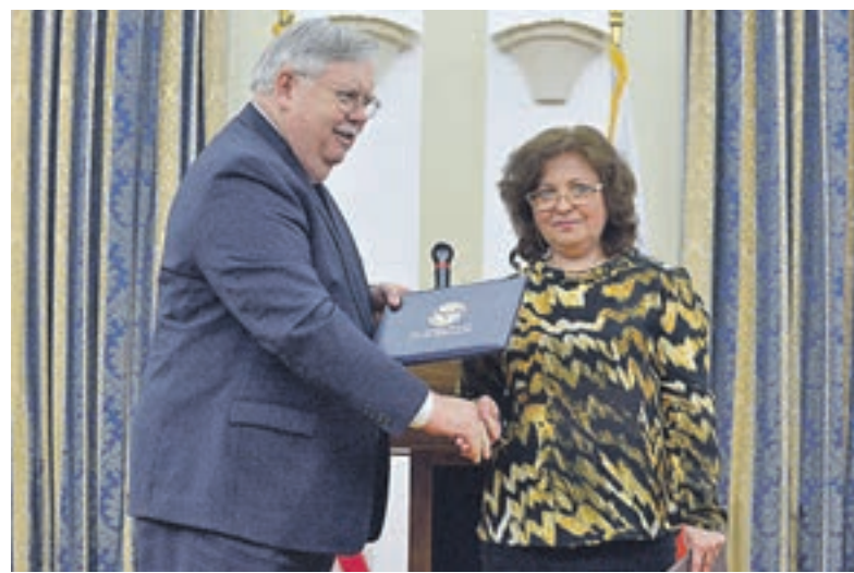
Вчера 12:44 Посол США в России Джон Теффт (слева) и директор Департамента науки и образования Министерства культуры РФ Александр Аракелова на торжественной церемонии

— Все документы — в общей сложности их 28 — найдены сотрудниками Министерства внутренней безопасности США по просьбе представителей Российской Федерации, —