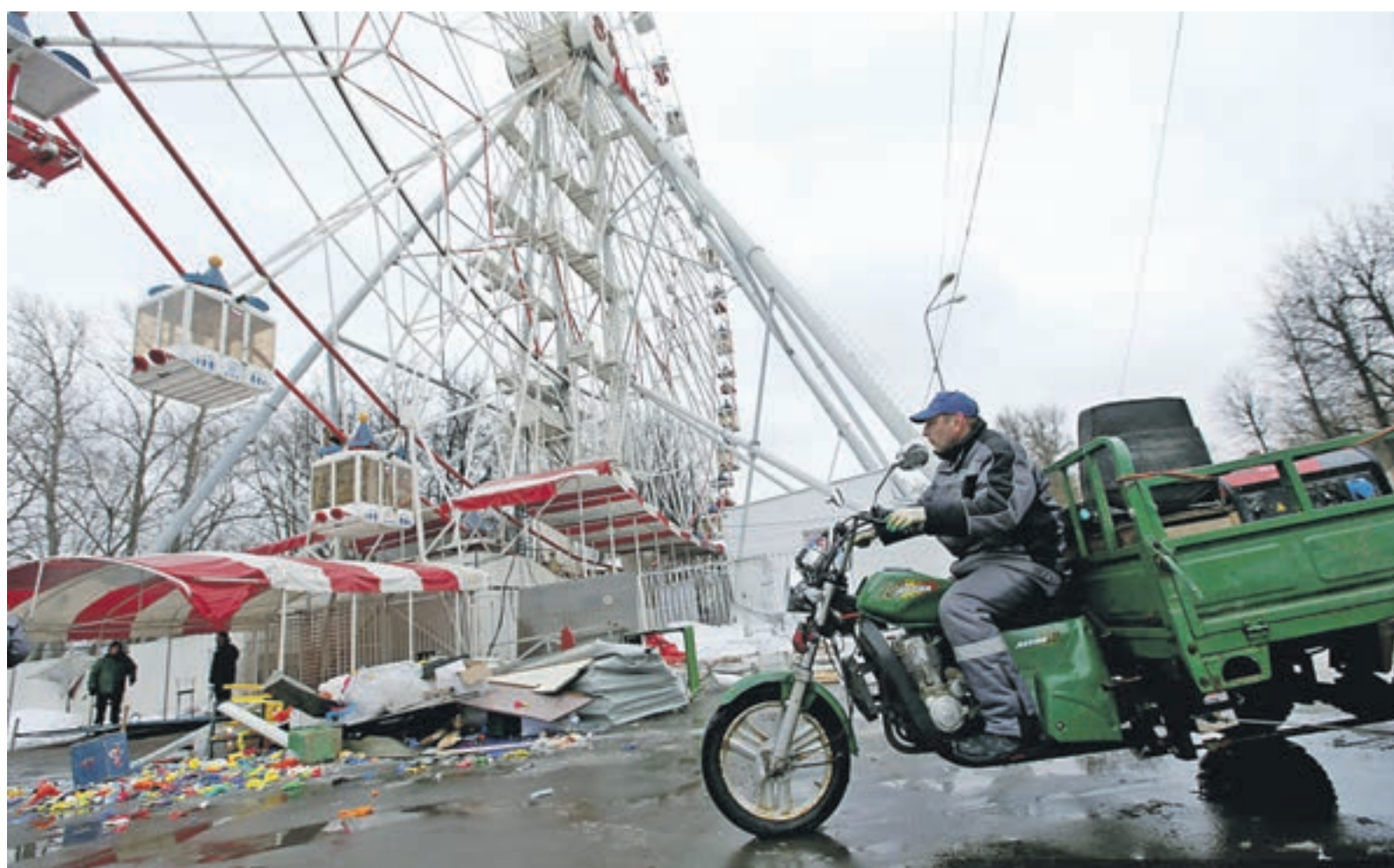
Вчера 13:11 В парке ВДНХ сносят 12 аттракционов, в том числе знаменитое колесо обозрения «Москва-850», некогда самый высокий аттракцион в Восточной Европе. Судебная тяжба между администрацией парка и компанией-владельцем аттракционов длилась с 2014 года