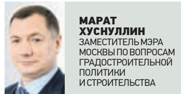
МАРАТ ХУСНУЛЛИН ЗАМЕСТИТЕЛЬ МЭРА МОСКВЫ ПО ВОПРОСАМ ГРАДОСТРОИТЕЛЬНОЙ ПОЛИТИКИ И СТРОИТЕЛЬСТВА

В этом году крупнейший международный конгресс в области урбанистики состоится в Москве уже в седьмой раз и будет посвящен вызовам развития глобальных мегаполисов. Тема форума звучит так: «Эпоха агломераций. Новая карта мира». Форум объединит сразу несколько форматов: деловую программу, городской фестиваль, экспериментальные лаборатории и крупнейшую в России девелоперскую выставку. Официальное исследование форума будет посвящено анализу агломерационных процессов в мировой и российской экономике на примере моделей управления такими глобальными мегаполисами, как Токио, Сеул, Нью-Йорк, Лондон, Пекин, Шанхай и Буэнос-Айрес. На форум съедутся представители 40 стран, 400 спикеров, свыше 150 из которых — международные эксперты.