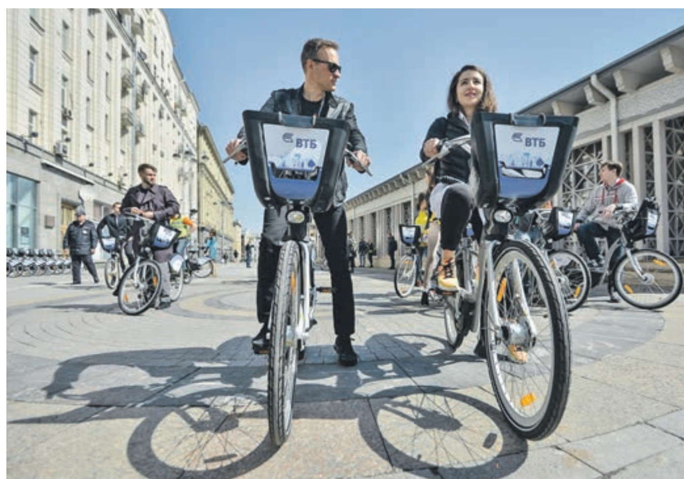
15 июня 10:15 Этот год для проекта по развитию городского проката велосипедов в столице — юбилейный. Проект был запущен ровно пять лет назад

Выделил три наших продукта: карта «Супер3», программа «Люди дела» и сервис по оплате ЖКХ. Это самые удобные, объемные и коммерчески успешные проекты, выгодные как банку, так и горожанам. Недавно ВТБ запустил карту «Супер3» — это цифровой продукт, исключительно для Москвы. В дебетовую карту интегрировано приложение «Тройка» для оплаты проезда на городском транспорте. Разрабатывая карту совместно с Департаментом транспорта, мы решили, что при оплате покупок в магазинах, совершении переводов и прочих операций с помощью карты будем возвращать на нее не мили или бонусы, а начислять реальные деньги для оплаты проезда в метро. Вот это и есть применение дизайн-мышления на практике: способ выявить новые продукты и сервисы, необходимые клиентам. То же самое и с сервисом оплаты жилищно-коммунальных