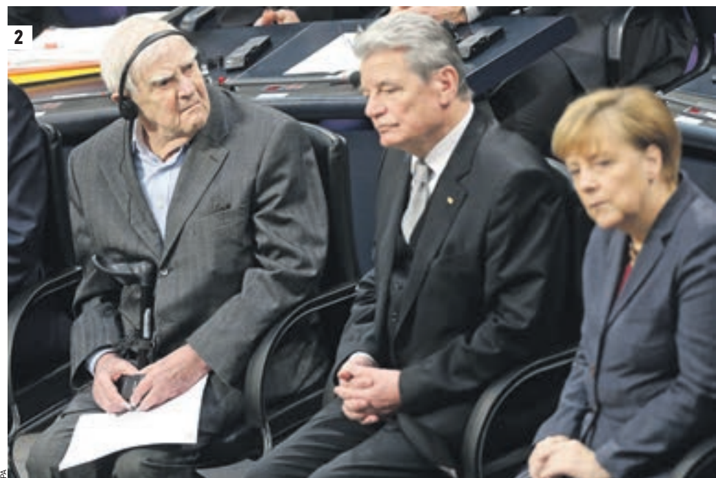
4 февраля 2014 года. Санкт-Петербург. Писатель Даниил Гранин во время творческой встречи с читателями (1) 27 января 2014 года. Берлин. В зале заседаний бундестага (слева направо) Даниил Гранин, президент Германии Йоахим Гаук и канцлер Германии Ангела Меркель (2)

ПОСЛЕДНЯЯ АВТОРСКАЯ КОЛОНКА ДАНИИЛА ГРАНИНА, НАПИСАННАЯ ДЛЯ «ВЕЧЕРНЕЙ МОСКВЫ» → стр. 4