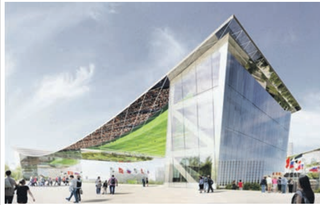
Такой будет арена стадиона спорткомплекса имени Эдуарда Стрельцова в Москве после реконструкции

Типовые панельные «коробки» больше не пользуются спросом у горожан. Москвичи теперь предпочитают покупать квартиры в новостройках с собственной инфраструктурой.