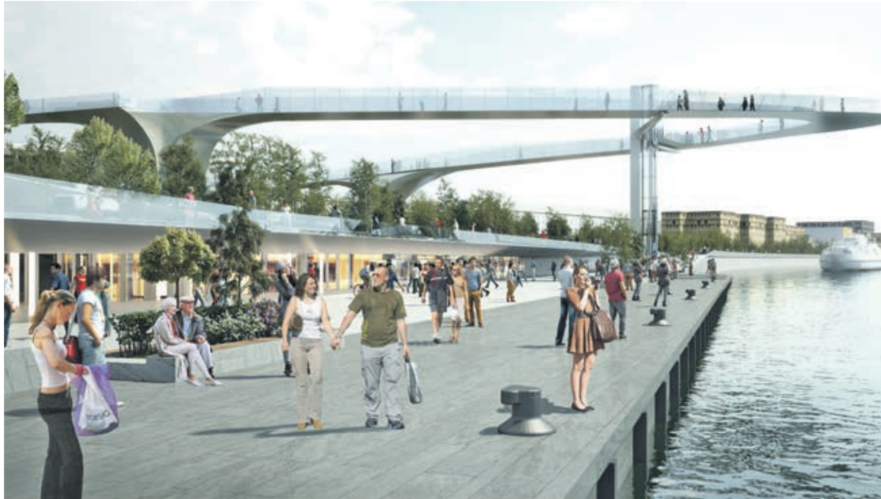
6 июля 2017 года. 12:44 Московский урбанистический форум впервые проходит на ВДНХ. Один из глобальных и самых обсуждаемых проектов — реконструкция набережной Москвы-реки и строительство парка «Зарядье»

Форум в равной степени можно отнести как к сугубо деловым, так и к культурным событиям. Кажется, что его проведение не случайно совпало по времени с первым скромным, но знаковым юбилеем: пять лет назад столица изрядно расширилась, обогатившись новыми округами, именуемыми ныне Большой Москвой. Этот шаг ознаменовал собой начало реальных, знаковых и принципиальных изменений, на наших глазах преобразующих город. И более того — благодаря расширению Москвы и включению в нее ряда современных, но пять лет назад еще совсем не развитых районов, был создан образец современного подхода к градостроительству, позволяющий в рекордные сроки создать самую оригиналь-