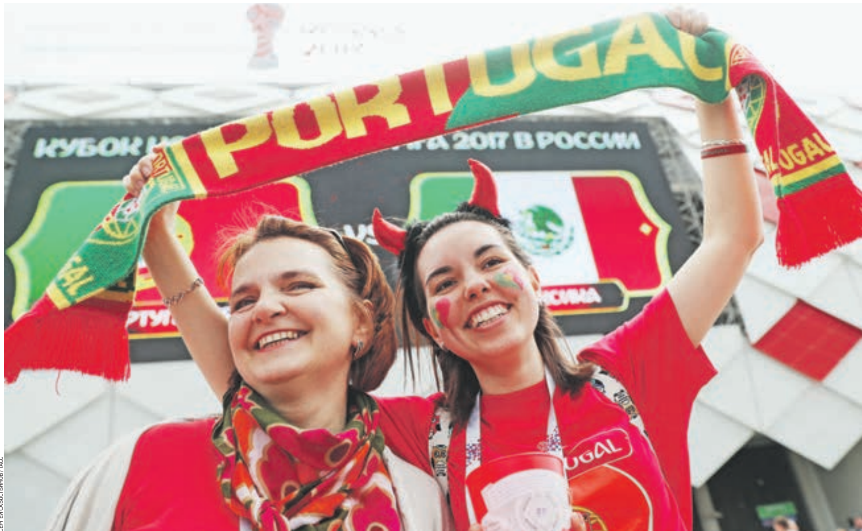
2 июля 15:21 Болельщицы перед началом матча за третье место Кубка конфедераций FIFA между сборными Португалии и Мексики