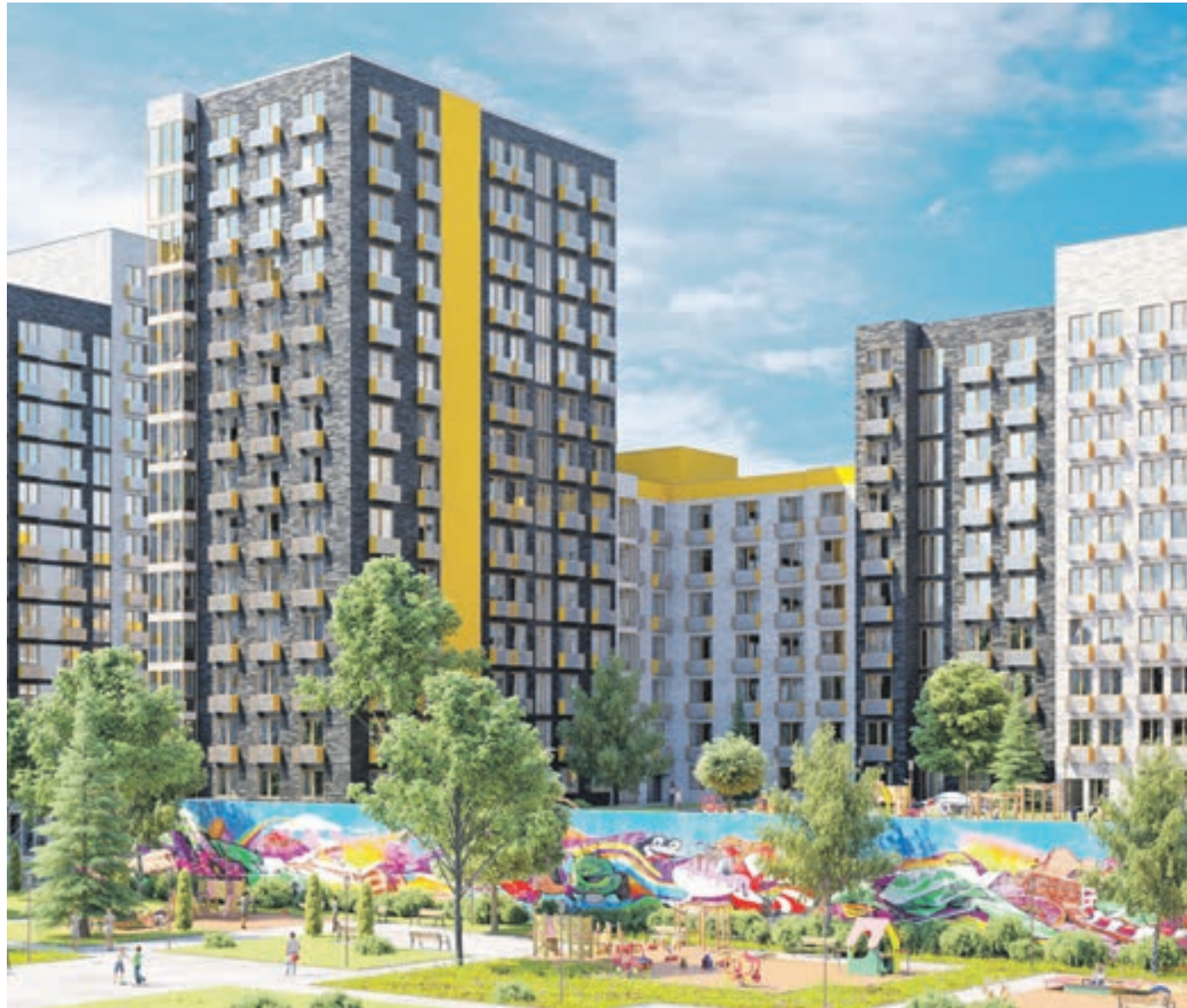
ЖК «Москвичка» — яркий проект в Новой Москве. Столичная прописка и транспортная доступность делают его особо привлекательным для тех, кто желает приобрести квартиру