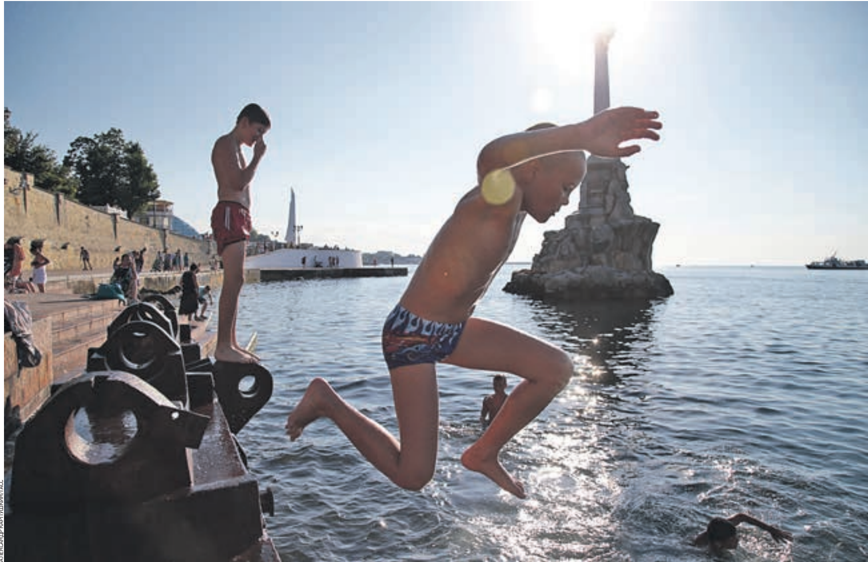
24 июня 2017 года. Купание в центре Севастополя у знаменитого памятника погибшим кораблям. В Крым, как уверяют туроператоры, москвичи едут не только ради пляжного отдыха, но и для того, чтобы посетить исторические места. Поэтому у полуострова большой туристический потенциал