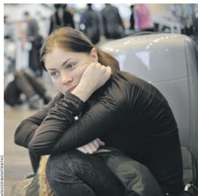
30 июня 2017 года 15:10 Москвичка ждет регистрации на рейс в аэропорту «Шереметьево»