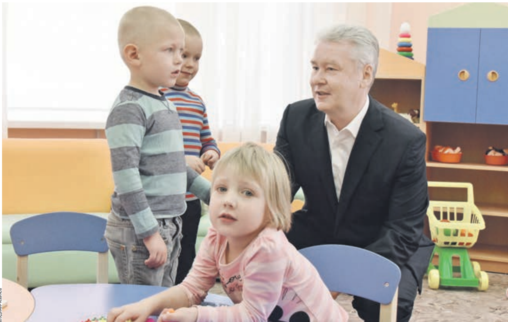
31 августа 2015 года. Мэр Москвы Сергей Собянин осмотрел дошкольное отделение школы № 656. Благодаря открытию в том числе этого заведения удалось ликвидировать дефицит мест в детсадах в районе Бескудниково Северного округа

По словам главы города, в результате москвичи экономят два-три рабочих дня для получения госуслуг. Внедрение электронных сервисов позволяет также экономить солидные бюджетные средства. — За счет внедрения персонализированного учета мы еже-