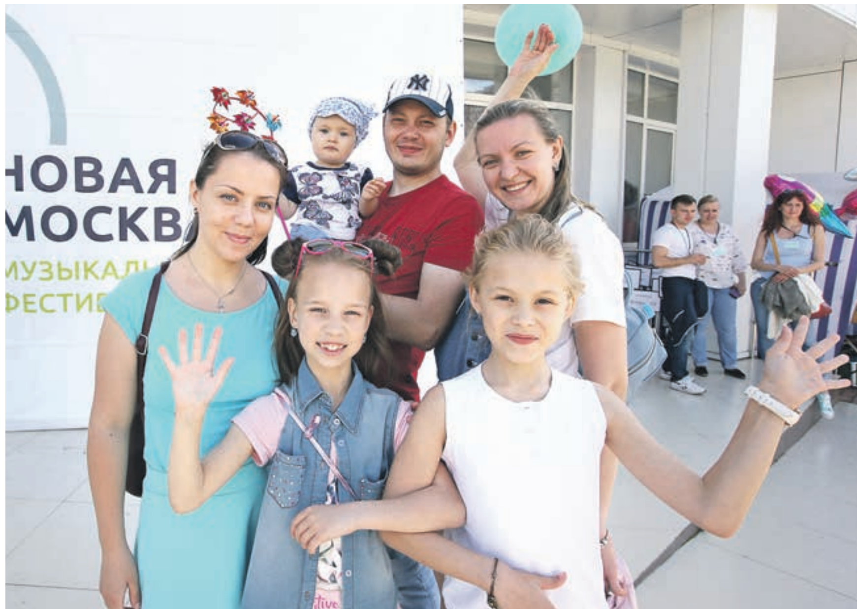
1 июля 15:20 Пятилетие ТиНАО жители поселения Киевский отметили большим концертом лауреатов музыкального фестиваля «Новая Москва». В этот день праздничные мероприятия прошли во всех поселениях и городских округах Новой Москвы

Базовыми документами для реализации крупнейшего проекта стали территориальные схемы, Генплан и Правила землепользования и застройки. При этом Новая Москва развивается по восьми принципам: одновременная разработка всей градостроительной документации, равномерное создание 12 точек роста, развитие дорожно-транспортной инфраструктуры, формирование благоприятной экологии. Районы развиваются комплексно — строится жилье и создаются социальные объекты.