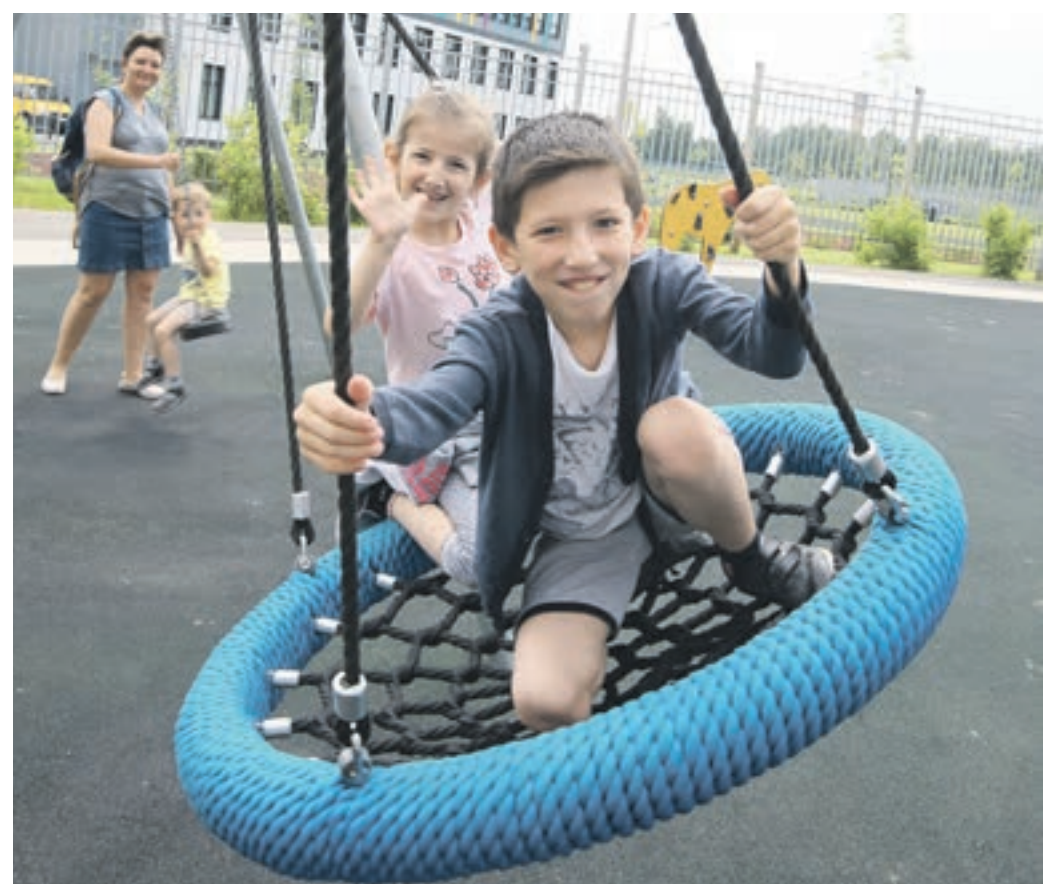
30 июня 14:15 Во дворе школы в районе Новые Ватутинки в ТиНАО всегда весело и интересно

Аведь без грамотно спланированной инженерной инфраструктуры такой район не построить. Котельная, которая возведена усилиями застройщика с самыми первыми домами, теперь обеспечивает оба микрорайона теплом и горячей водой, а из четырех скважин глубиной 160 метров очищенная вода поступает в более 8 тысяч квартир, коммерческие и социальные объекты. Сейчас 19 многоэтажных домов жилаго назначения отныне уже построены в микрорайоне Центральный, между