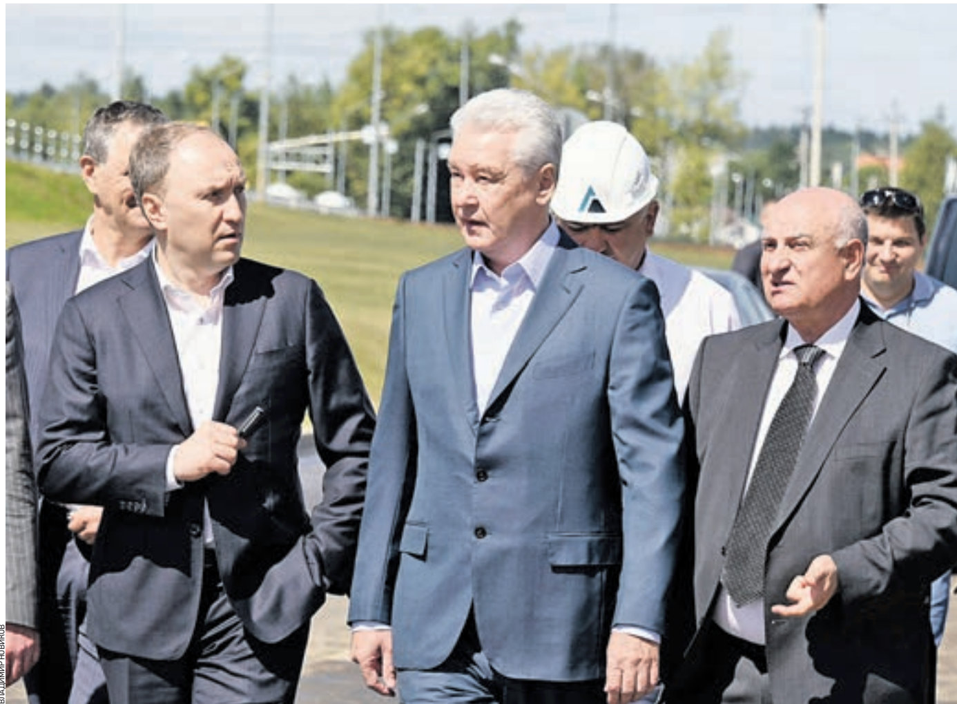
Вчера 12:20 Мэр Москвы Сергей Собянин (в центре), руководитель Департамента строительства Андрей Бочкарев (слева) и его первый заместитель Петр Аксенов (справа) открыли путепровод в Крекшине. Благодаря современному искусственному сооружению автомобилисты не будут застревать в пробках, пропускная способность этого транспортного узла возрастет в 5–6 раз — с 350 до 1600–2100 автомобилей в час

Как сообщил первый замглавы Департамента строительства Москвы Петр Аксенов, путепровод в Крекшине построили вдвое быстрее: вместо трех лет — за полтора года. — Самый сложный оказался вести работы на болотистой местности, — отметил он. — Предварительная геологическая экспертиза показала, что грунты на глубине 14 метров позволяют установить сваи. Но когда начали ставить опоры, выяснилось, что такой длины не хватает. После перепроектирования пришлось возводить опоры на глубине до 22 метров. Но все трудности позади, строители сделали хороший подарок Новой Москве. Это уже четвертое искусственное сооружение на присоединенных территориях. По словам Сергея Собянина, путепровод обеспечил новую поперечную связь и беспрепятственное движение автомобилей между Киевским, Боровским и Минским шоссе. Подрядчик реконструировал и существующую дорогу, оборудовал дополнительные съезды и примыкания. Их общая протяженность — более трех километров. А для комфортного передвижения пешеходов здесь обустроили тротуары и два лестничных хода с путепровода. По склонам путепровода уложили рулонный газон.