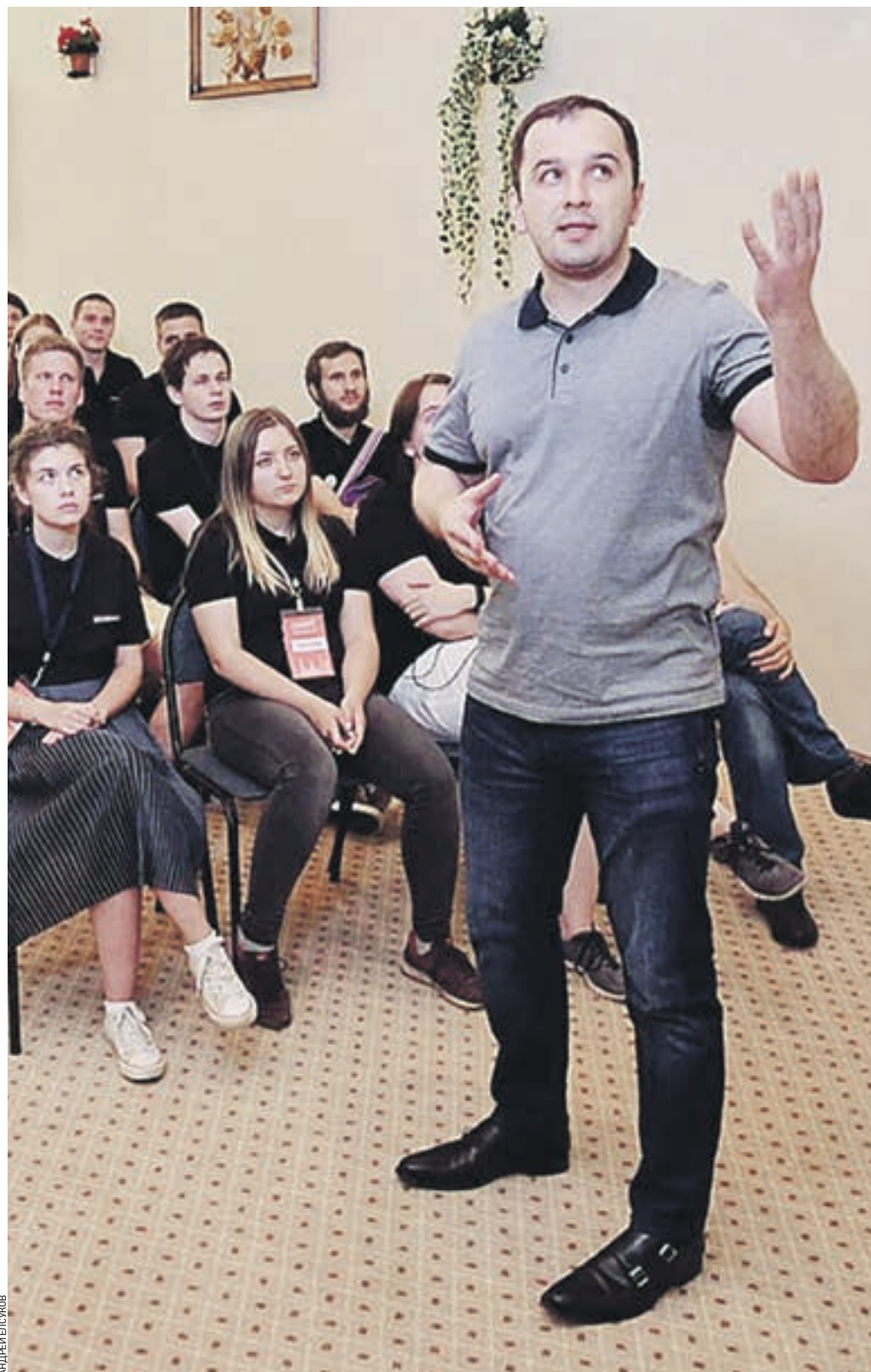
5 августа 18:21 Первый заместитель руководителя аппарата мэра и правительства Москвы Вячеслав Шуленин общается с участниками молодежного саммита «Новая Москва-2017»

Участники проделали гигантскую работу для двух с половиной дней: сформировали концепции своих проектов, наметили план реализации, выслушали обратную связь. Конечно, идеи нуждаются в доработке, мы будем продолжать диалог с молодежью.