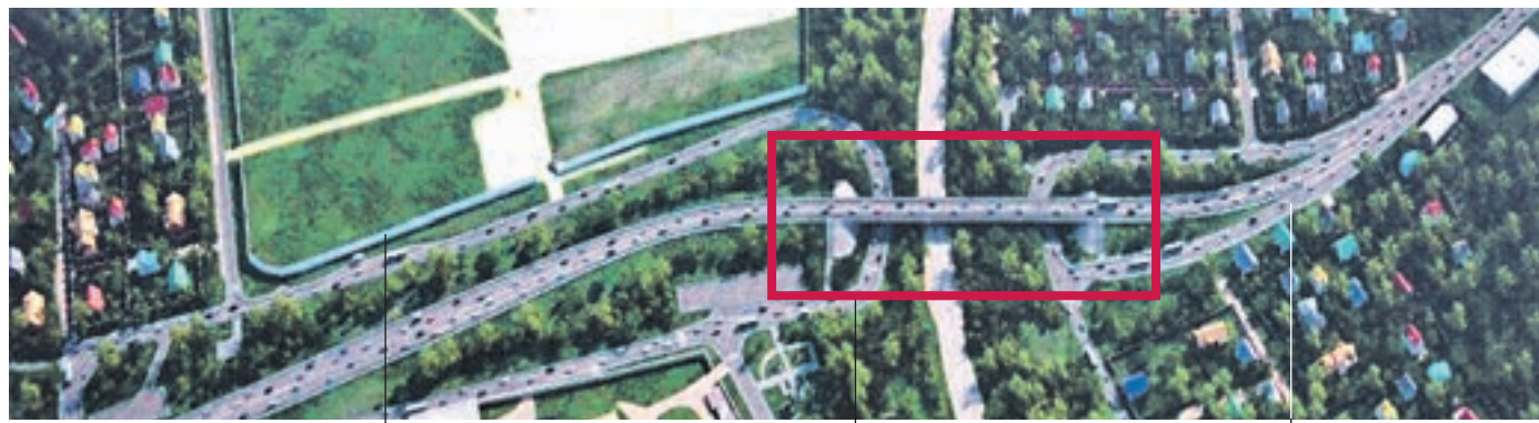
На всем протяжении автодорожного путепровода устроены защитные экраны (свыше 800 метров), ограждающие от шума и пыли жилые дома в деревне Крекшино и одноименном СНТ Возведена двухполосная эстакада длиной 168 метров Проведена реконструкция существующей дороги от улицы Солнечная до улицы Центральная (3,1 километра). Основной ход дороги расширен до двух полос в каждом направлении, в подэстакадном пространстве и на дублерах организованы разворот и съезды к прилегающей застройке

Всего в Москве построено десять путепроводов над Киевским, Курским, Павелецким направлениями железных дорог, эстакада в Крекшине стала 11-й по счету. Осталось возвести еще один путепровод во 2-м Южнопортовом проезде, который сдадут в октябре. — В этом году построены три путепровода на Киевском направлении железной дороги, — Сергей Собянин объявил о завершении строительства искусственных сооружений через Киевское направление железной дороги.