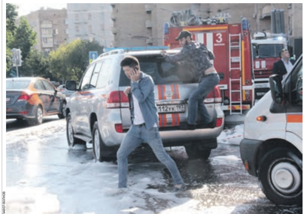
Вчера 15:20 Пожарные использовали для тушения специальную пену, которая разлилась по Таганской площади. Но потоп не напугал москвичей: они спешат по делам через огонь и воду

Вчера днем в торговом центре, расположенном по адресу: Таганская площадь, дом 86, несколько часов полыхал пожар.