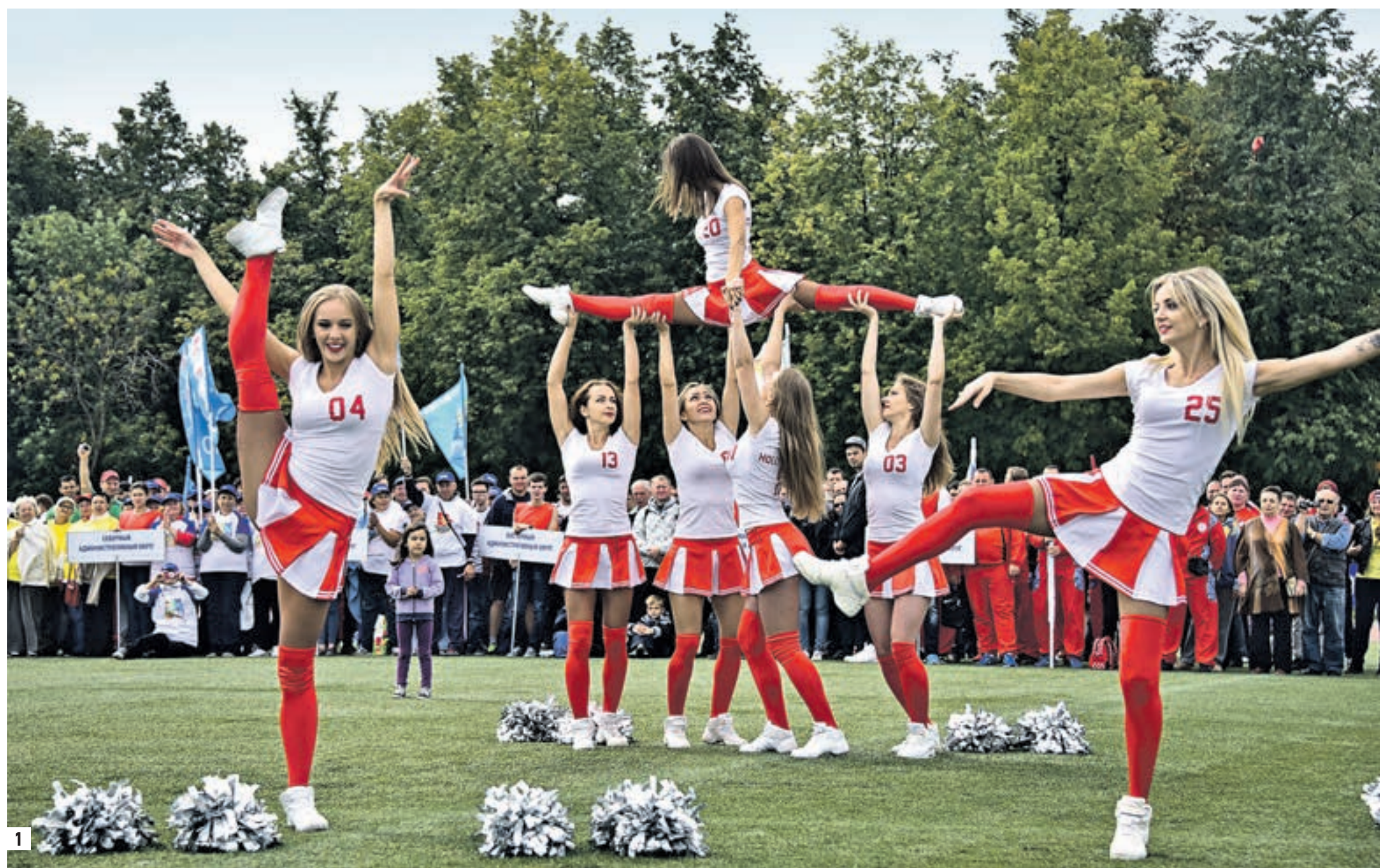
13 августа 2016 года 15:15 День физкультурника в спорткомплексе «Лужники». Показательные выступления чирлидеров — группы поддержки спортивных команд (1) Перетягивание каната — одно из самых зрелищных, азартных и любимых мужчинами видов командных состязаний (2)