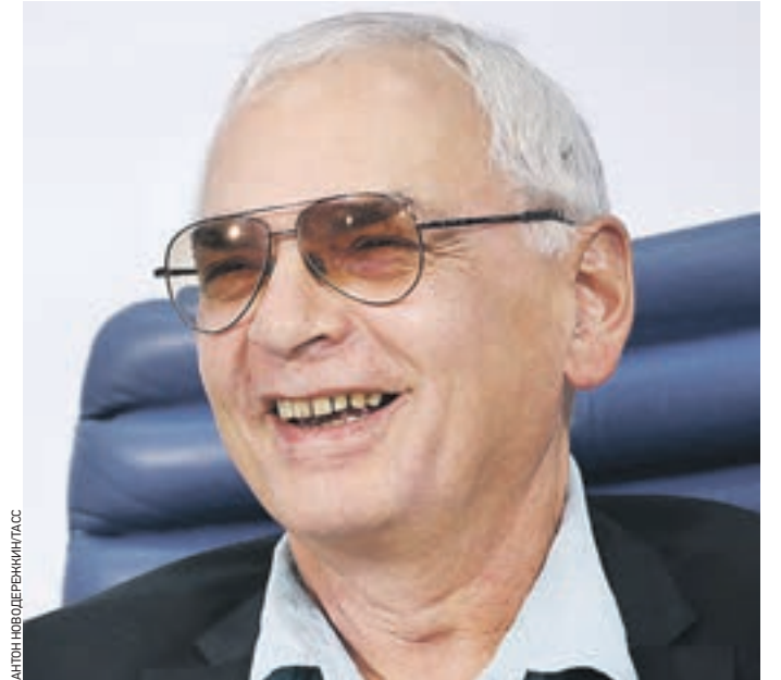
29 августа 2016 года 12:30 Карен Шахназаров на встрече с журналистами

Вчера гендиректор концерна «Мосфильм» Карен Шахназаров провел мастер-класс в рамках XXIII фестиваля «Окно в Европу» в Выборге. Кинокартина режиссера «Анна Каренина. История Вронского» вошла в программу «Выборгские премьеры». Карен Георгиевич рассказал «ВМ» о фильме, подвел итог работы и поделился планами на будущее.